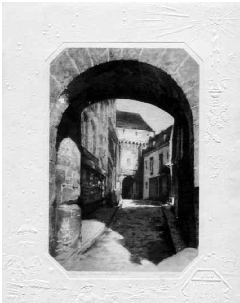
Улица Мюнхена на рисунке немецкого художника