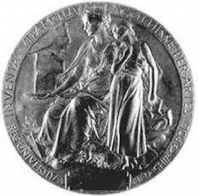
Медаль Нобелевской премии по физиологии или медицине