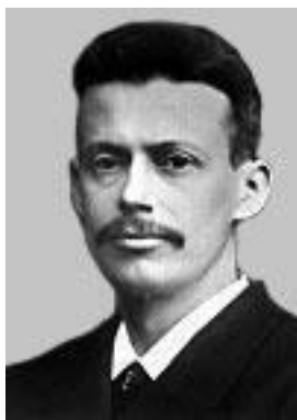
НИЛЬС РЮБЕРГ ФИНСЕН , Дания (NIELS RYBERG FINSEN) 1860–1904