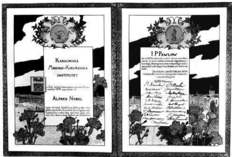
Диплом Нобелевской премии И. П. Павлова.

Перевод текста диплома: “Каролинский медико-хирургический институт, который согласно духовного завещания составленного 15/27 ноября 1895 года Альфредом Нобелем имеет право присуждать Нобелевскую премию за важнейшие открытия, которыми обогатилась в последнее время фи-