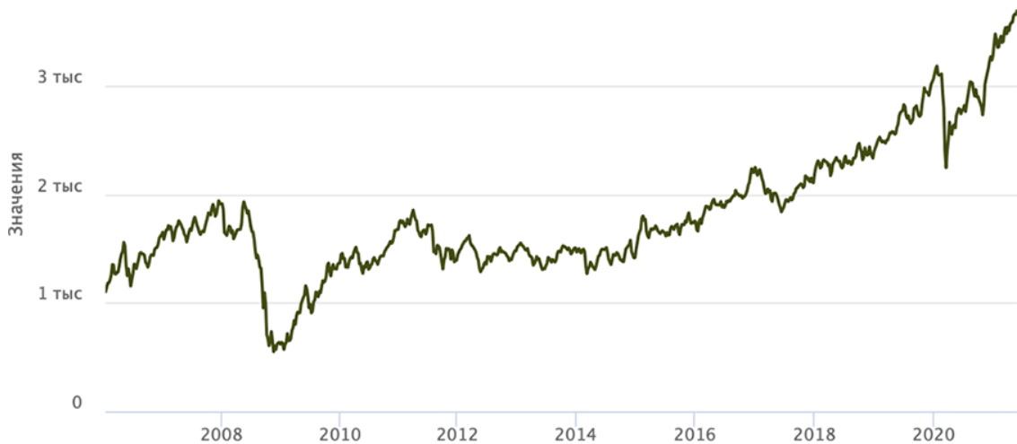
Рис. 2. Динамика «Индекса Мосбиржи» 2006–2020 гг