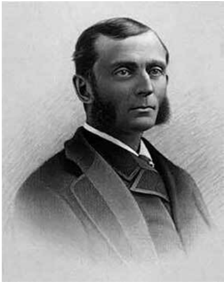
Джордж Миллер Бирд, доктор медицины (1839–1883)