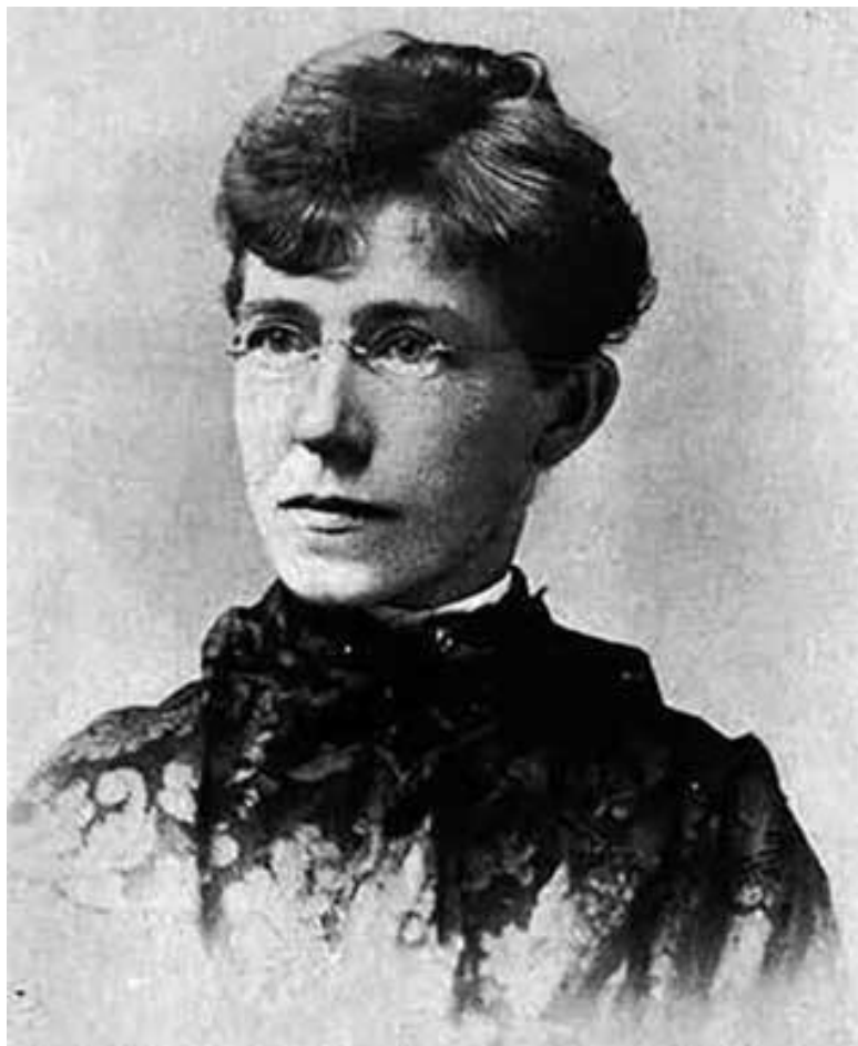
Маргарет Абигейл Кливз, доктор медицины (1848–1917)