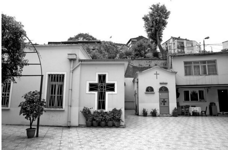
Рис. 6. Новodelный «Влахернский монастырь» в Стамбуле, построенный в XIX–XX веках. Фотография 2008 года.

известны были Влахерны по Богородичной церкви, построенной императором Львом Великим, при котором в 474 году положены были в эту церковь честные ризы Пречистые Девы Богородицы, принесенные из Палестины; память этого события празднуется Православной Церковью 2 июля. Храм этот сгорел в 1434 году; ныне виднеются только малые остатки его (написано в конце XIX века – Авт.). Частицы хранившихся здесь одежд Богоматери показываются теперь в разных местах, например, в Москве, в соборах Успенском и Благовещенском» [988:00], статья «Влахерны».