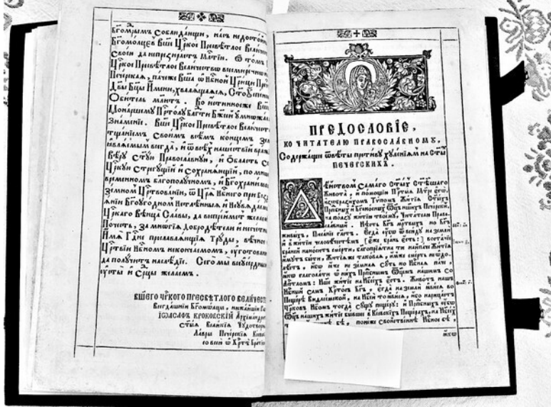
Рис. 4. Первые страницы «Жития Печерских святых», напечатанных в Киево-Печерской Лавре при архимандрите Иоасафе Кроковском: конец посвящения Петру I и начало Предисловия к православному читателю, содержащего ответы «противу хулениям на святых печерских».

Краткая справка. Иоасаф Кроковский – архимандрит Киево-Печерской лавры в 1697–1709 годах. Как сам Кроковский, так и двое его предшественников, возглавлявших Киево-Печерскую лавру в 1683–1691 годах – Варлаам Ясинский и Мелентий Вуяхевич-Высочинский – происходили из поль-