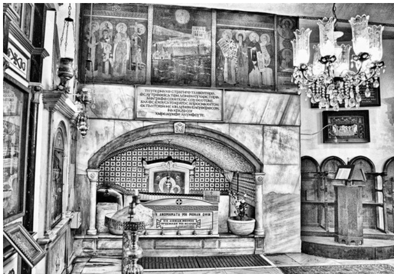
Рис. 7. Новодельная «рака для ризы (или омофора) Бого- родицы» во Влахернском монастыре в Стамбуле. Наверху в центре помещена живописная картина, изображающая тону- щие ладьи русских князей, напавших на Царьград. Фотогра- фия 2008 года.