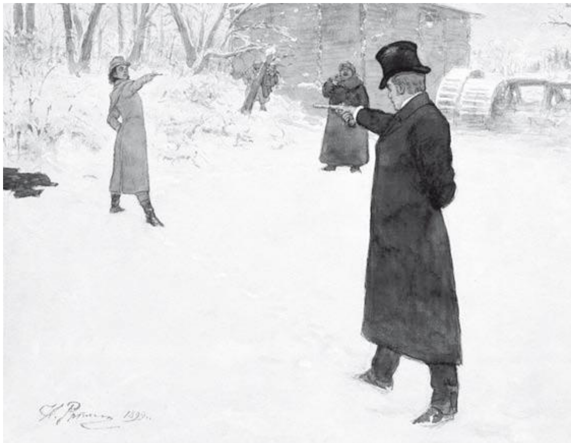
Дуэль Евгения Онегина и Владимира Ленского.

«По-настоящему храбрым людям незачем драться на дуэли, но это постоянно делают многие трусы, чтобы уверить себя в собственной храбрости».