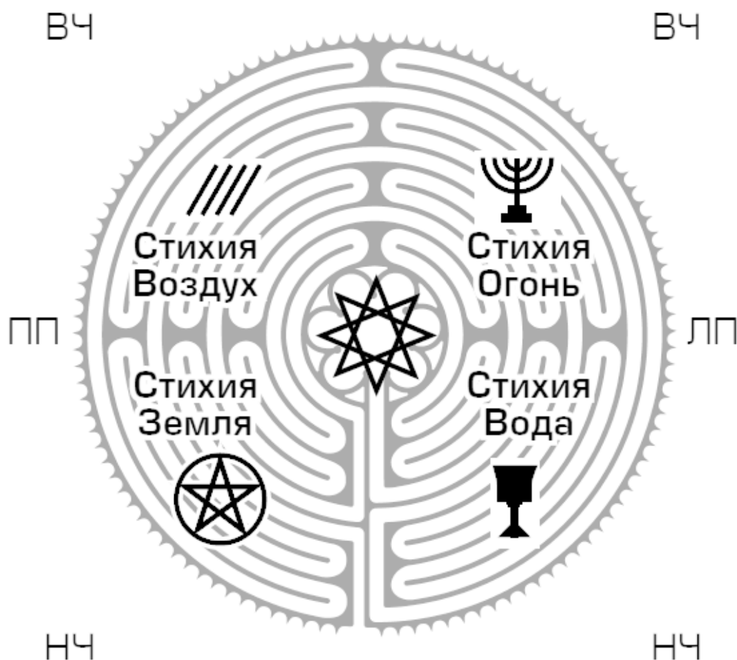
Рис. 1. Схема сознания человека

Подсознание связывают с работой правого полушария. Оно содержит две зоны – НЧ (Стихия