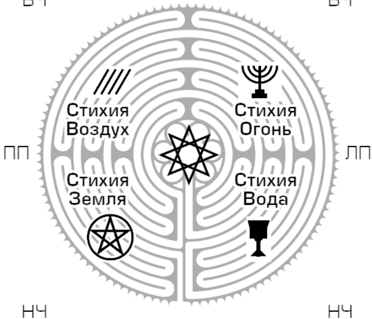
Рис. 1. Схема сознания человека

Земля) и ВЧ (Стихия Воздух). В НЧ-зоне правого полушария (Вишуддха – Аджна) находятся структуры личности, сформированные в прошлых воплощениях. Эти личности, как правило, находятся в пассивном, неактивном состоянии. По аналогии с информационными технологиями это состояние можно назвать «заархивированным». Активные прошлые воплощения (Союзники) можно описать как «разархи-