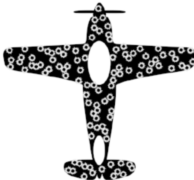
Рисунок повреждений на самолете, вернувшемся из вылета

Командование разработало план, казавшийся самым военным идеальным: защищать броней необходимо поверхности с наибольшим количеством попаданий. Именно туда попадали снаряды, а значит, эти области требовали дополнительной защиты. План был образцом здравого смысла. Для военных это был лучший способ защитить храбрых летчиков от вражеского огня.