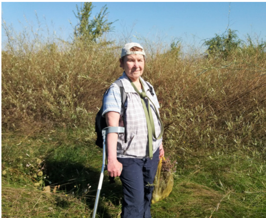
сентябрь 2021

А там! Бурьян частично высох и полёг, и всё равно получался выше моей головы. Привычные дорожки оказались непроходимыми. За счёт этого – никаких людей вокруг. Раньше их и не было, появились в прошлом году, когда во время карантина нигде гулять не разрешали, а народ ринулся на поле воздухом дышать.