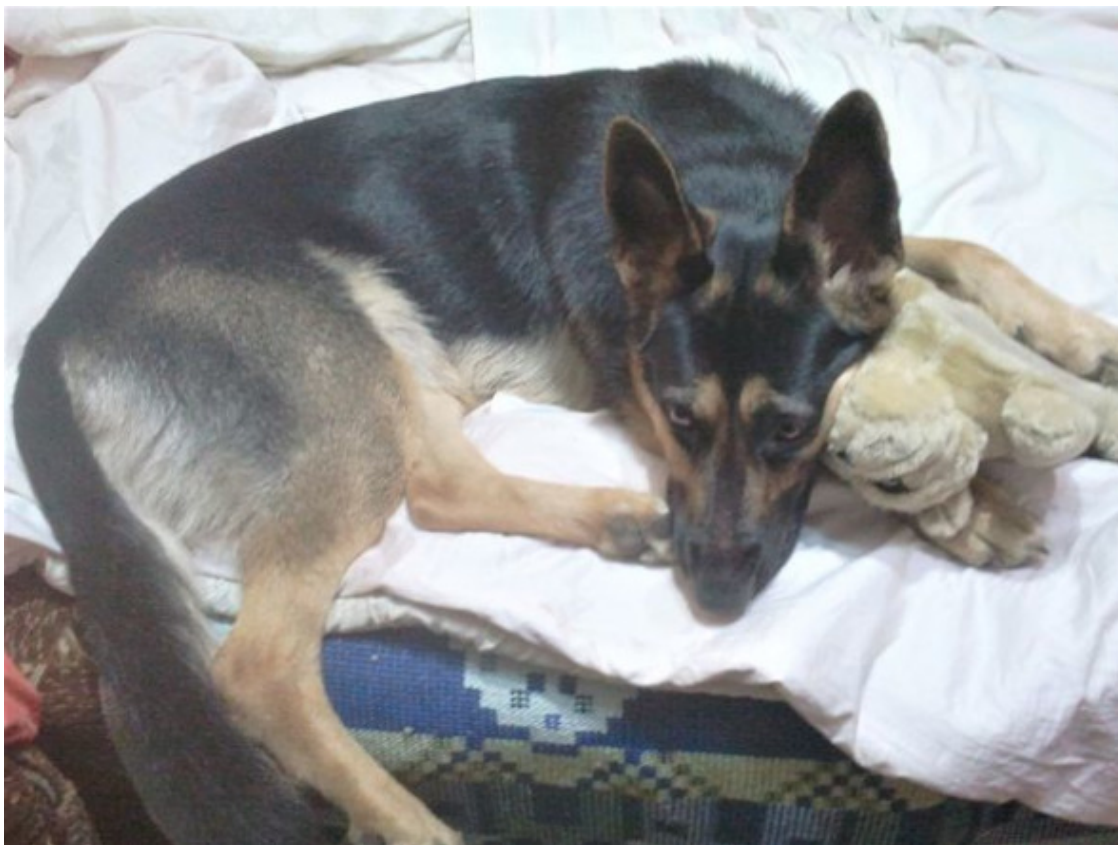
Кейси год и три месяца

...Пришла кошка. Улеглась мне на плечо, запела песню над ухом. Собака завозилась на своём матрасике, прислушалась. Зевнула, потянулась и тоже явилась ко мне на диван. Развалилась поперёк, тяжёлую морду пристроила мне на колени. Закрывает глаза и засопела.