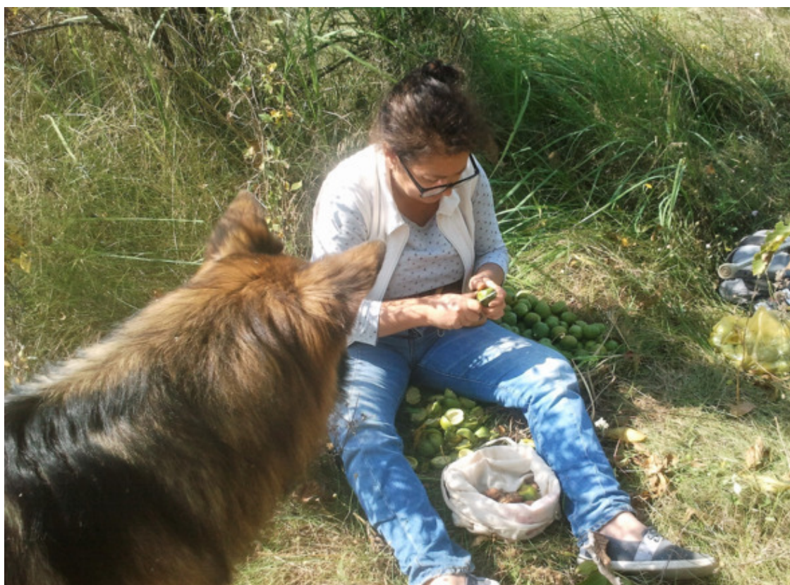
Подруга и Зевс