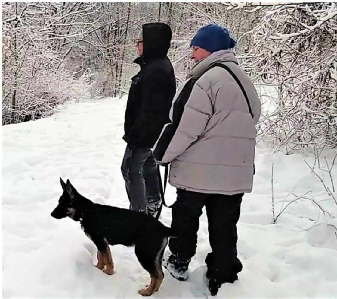
Подруга, я и Кейси – 3,5 месяца. Зевс за кадром остался

Со щенком гуляют пять раз в день, затем – четыре, в полгода – три. Мы с мужем натапывали километры. Раньше ходили по очереди, теперь тренировались вместе.