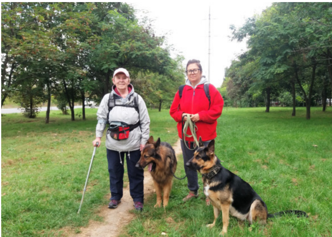
сентябрь 2021

Р. S. Ларисе только что исполнилось 58 лет, мне в конце октября стукнет 67)