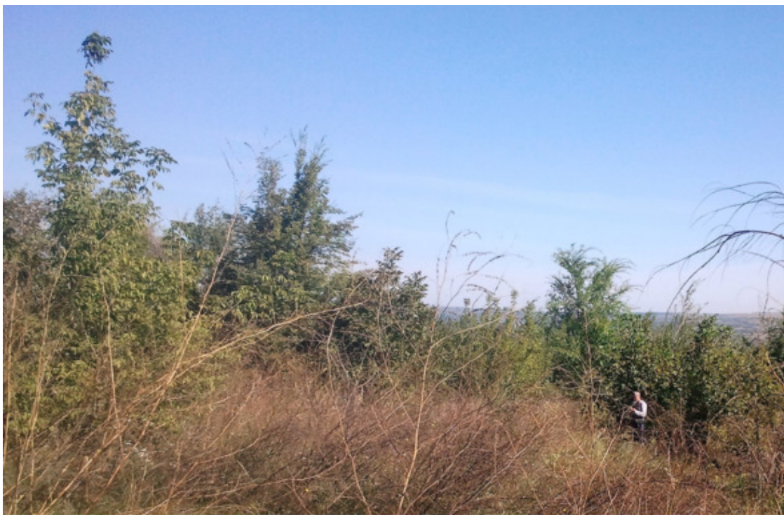
Муж возле орехового дерева

Совершенно не ожидали подобного великолепия, по два полных рюкзака домой приносим. Плюс ещё алыча в руках, яблоки.