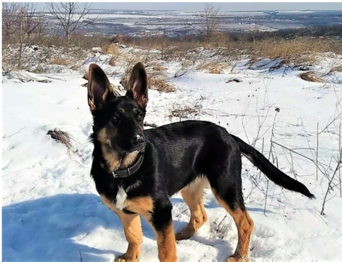
Кейси 5 месяцев

И слушаться Кейси не собиралась. С Тигрой я гуляла одна, занималась на каждой прогулке.