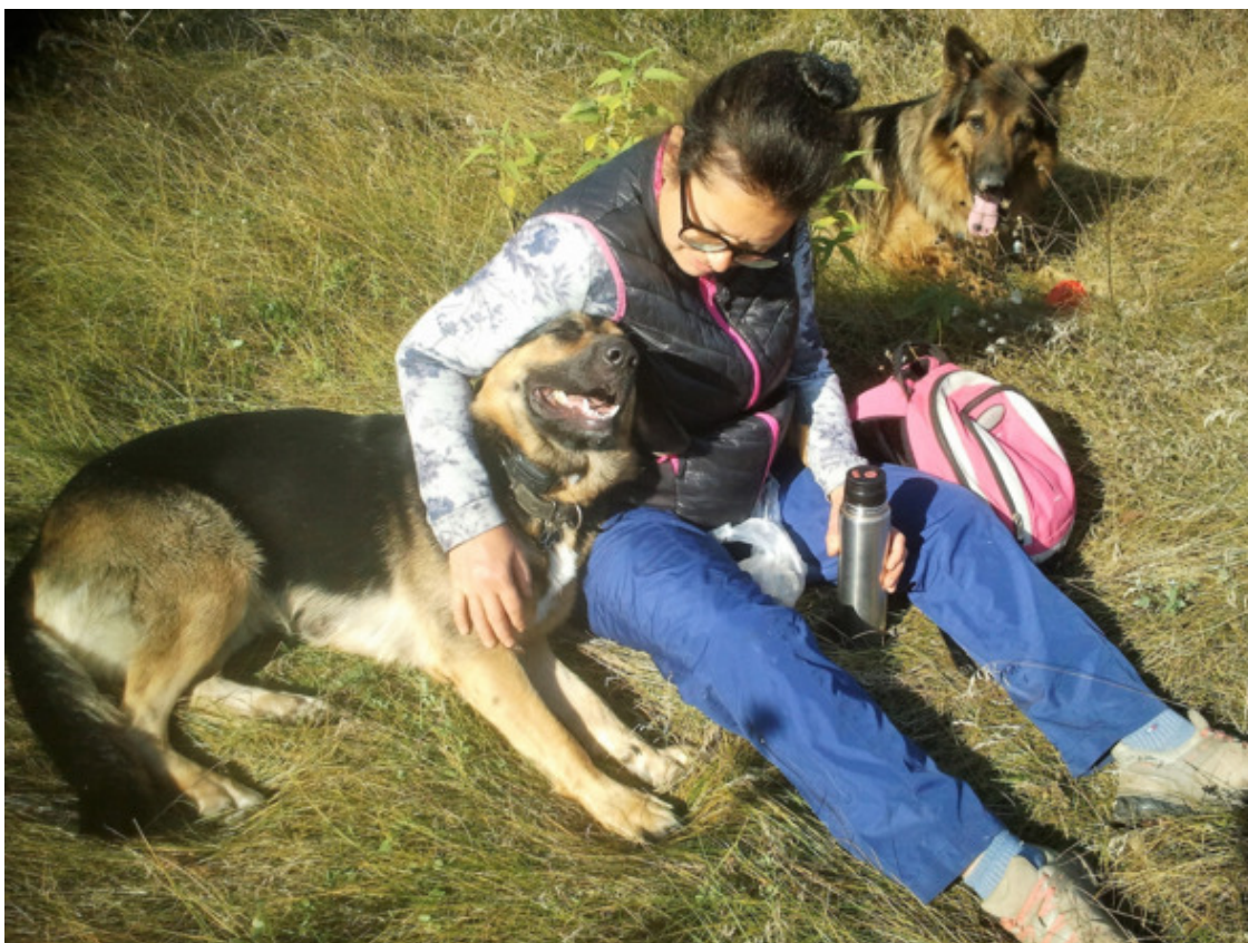
Подруга, Зевс и Кейси

На поле среди топинамбуров мы с подругой и раскинули праздничный «стол». Достали термосы с чаем, разложили сладости. Кейси моментально пристроилась рядом, предвкушая угощение. Зевс чинно лежал в сторонке.