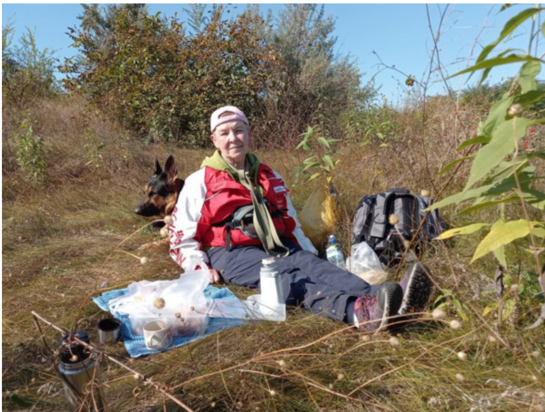
Я и Кейси за спиной

Раньше оказалась незаменимой при сборе орехов, чтобы наклонять высокие ветки. Умные люди несли на промысел длинные шесты с крюками на концах, но при этом не гуляли с собаками.