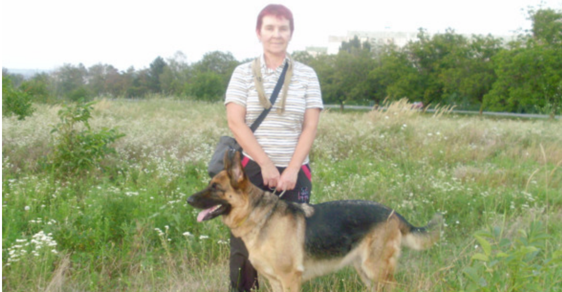
Я с Тигрой на поле

Последний Тигрин год работала и редко гуляла с собакой. Занимался муж, да и она уже не скакала. Мне «стукнуло» 63.