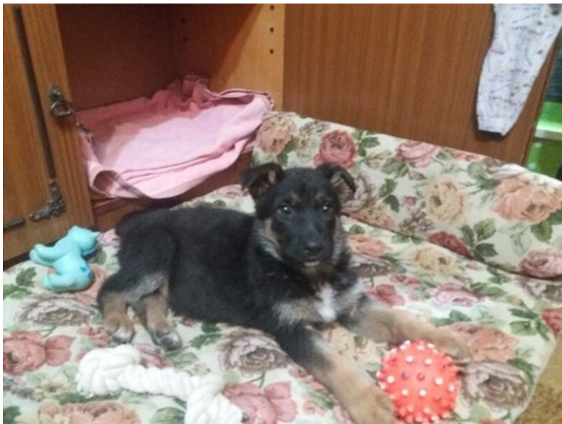
Кейси 2 месяца

Вторая проблема – при Тигре не было маленьких детей. Щенок передвигался по всей квартире беспрепятственно.