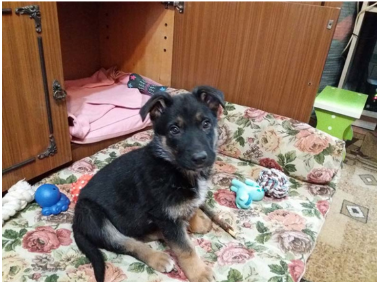
Кейси 2 месяца

Мурка забилась в самый дальний угол – за стол под батарею. Выманить не смогли. Ночью сама проскользнула в туалет и назад. Просидела сутки. Не пила, не ела, в логово не пряталась.