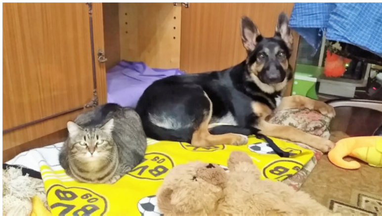
Кейси – 6 месяцев

По другу, которого потеряла и вновь обрела. Никто не возвращается назад. И только кошка совершила невозможное – отстояла своё право на прежнюю жизнь. С новой овчаркой по имени Кейси.