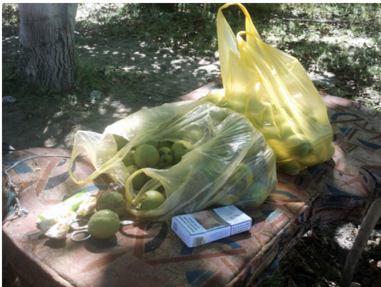
Орехи – грецкие, здесь они ещё в зелёных шкурках

Двинулись дальше, а там опять даров природы видимо-невидимо, алычой давно все морозильники забили, она растёт и растёт.