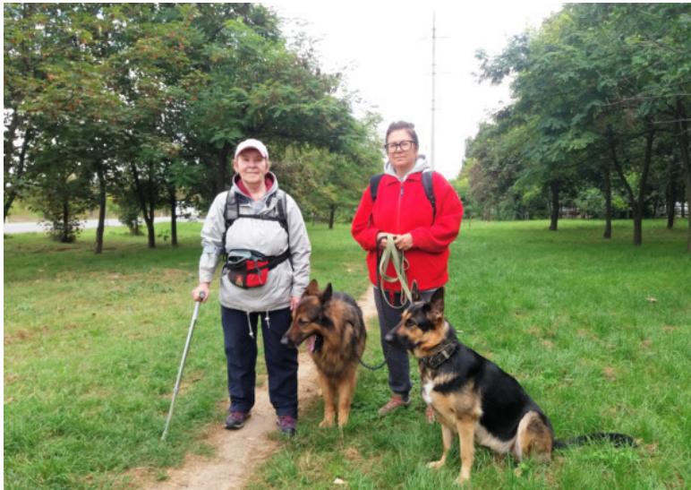
сентябрь 2021