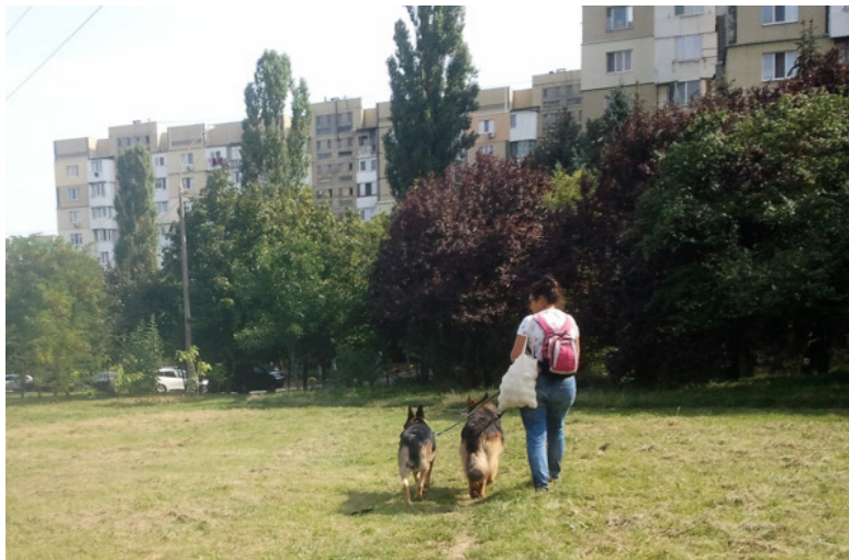
подруга с Кейси и Зевсом