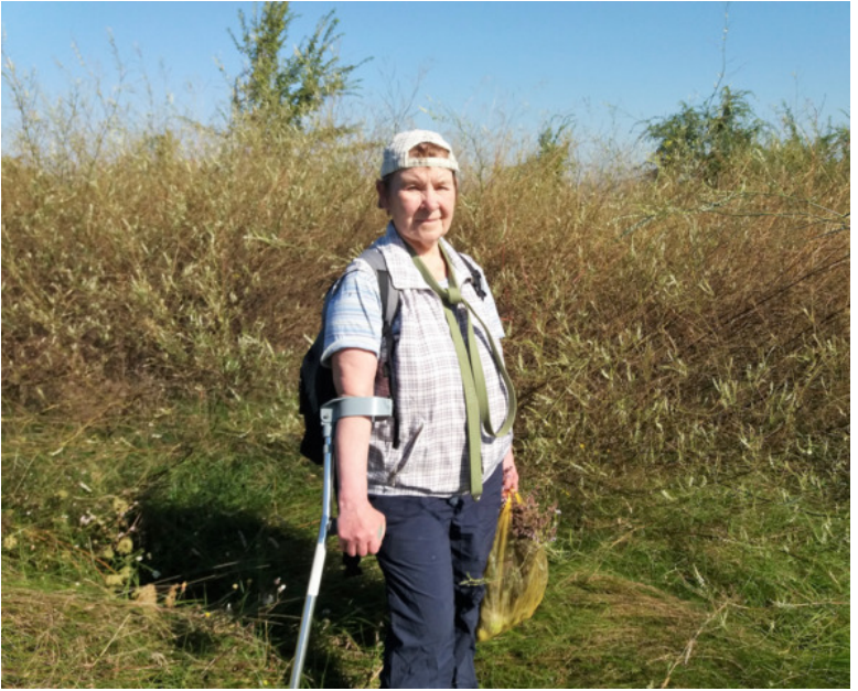
сентябрь 2021

Раньше их и не было, появились в прошлом году, когда во время карантина нигде гулять не разрешали, а народ ринулся на поле воздухом дышать.