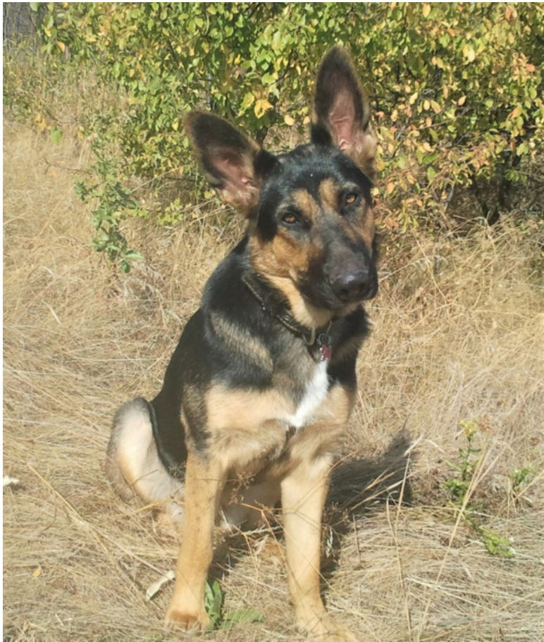
Кейси в день рождения 1 год