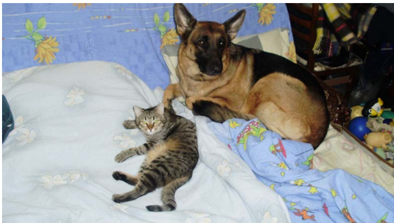
Мурка и Тигра

Нашей Мурке одиннадцатый год. Выросла кошка с овчаркой Тигрой, спали вместе со мной на диване. Собачий век несправедливо короток, и в апреле прошлого года проводили её за Радугу. Рухнул привычный мир. Для всех и для кошки – тоже.