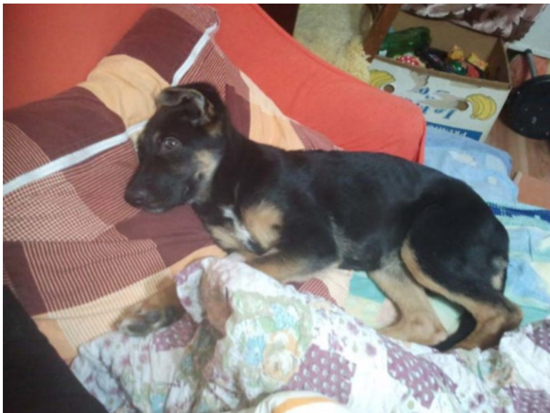
Фото – Кейси на моей подушке, любимом Тигрином месте

На Тигрино место пустили чудовище. Оно располагалось на моей подушке и теперь доставало до спинки дивана. Зубастая пасть дотягивалась почти до всех укромных местечек, ранее недосыгаемых. Нигде Мурке не было покоя.