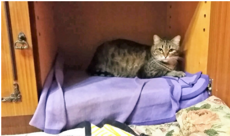
Мурка в домике