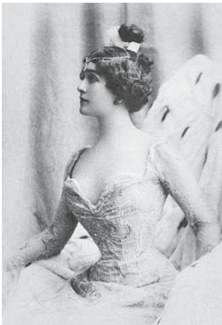
Лина Кавальери в опере Пуччини «Тоска», 1907