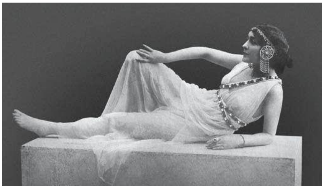
Лина Кавальери в опере Массне «Таис», 1905

Из Америки я вернулась в Россию, где в Петербурге, Москве, Киеве и Харькове должен был проходить итальянский оперный сезон. Именно тогда я пела с незабываемым Маттиа Баттистини 31 в опере Массне «Таис», в которой я начала выступать в парижской Опере, а затем по всему миру. Баттистини очень любил свою партию Атанаэля и, чтобы чувствовать себя совершенно непринужденно в роли просвещенного отшельника, носил грубую одежду дома весь день перед спектаклем. Время от времени он смотрел из открытого окна (мы были в мае), и однажды кто-то заметил его. Небольшая толпа зевак остановилась и с изумлением рассматривала его. Маттиа, очень внушительный, в своем сценическом костюме монаха, целиком показался на подоконнике и величественным жестом благословил своих уличных зрителей.