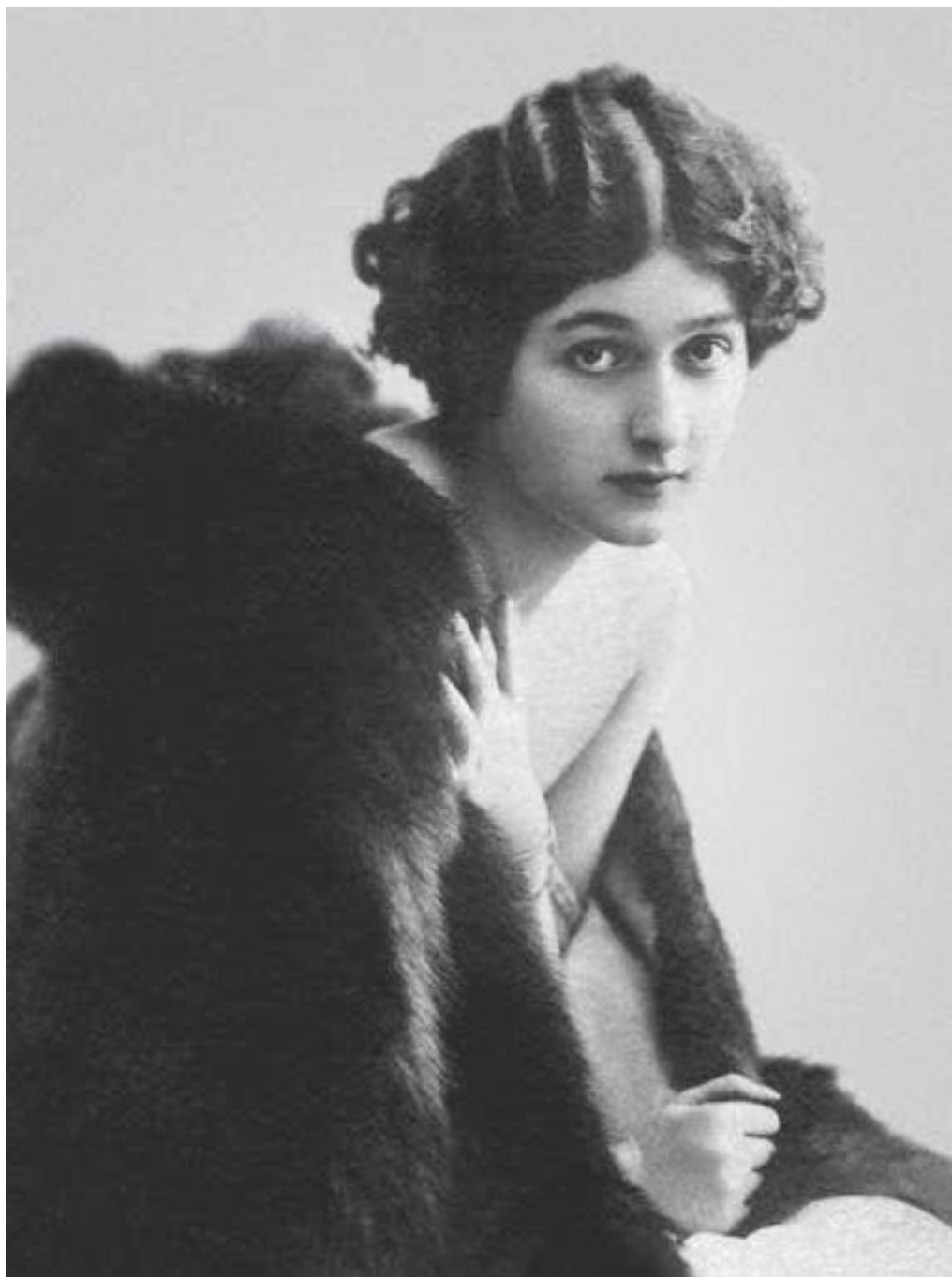
«Такой я была в России...»