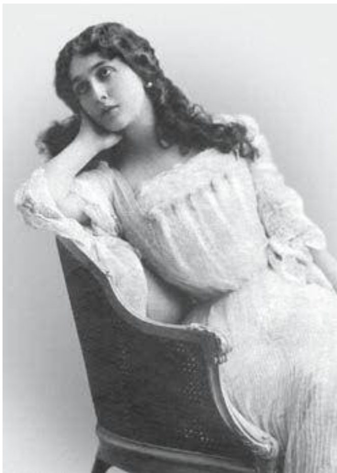
Лина Кавальери, 1900

Когда через несколько часов я очнулась, то оказалась в своей постели в гостиничном номере. Я бы могла подумать, что все это мне приснилось, если бы не резкая боль под левым виском, и я поняла: вся голова тщательно забинтована. Падение оставило у меня многочисленные синяки и глубокую рану на лице, несомненно вызванную разбитым стеклом. Рана была неопровержимым свидетельством этого индо-лондонского приключения, вокруг которого почти не было шума. Я так и не узнала истинных намерений махараджи по отношению ко мне в тот ужасный вечер. Меня до сих пор спрашивают, откуда у меня этот шрам под левым виском.