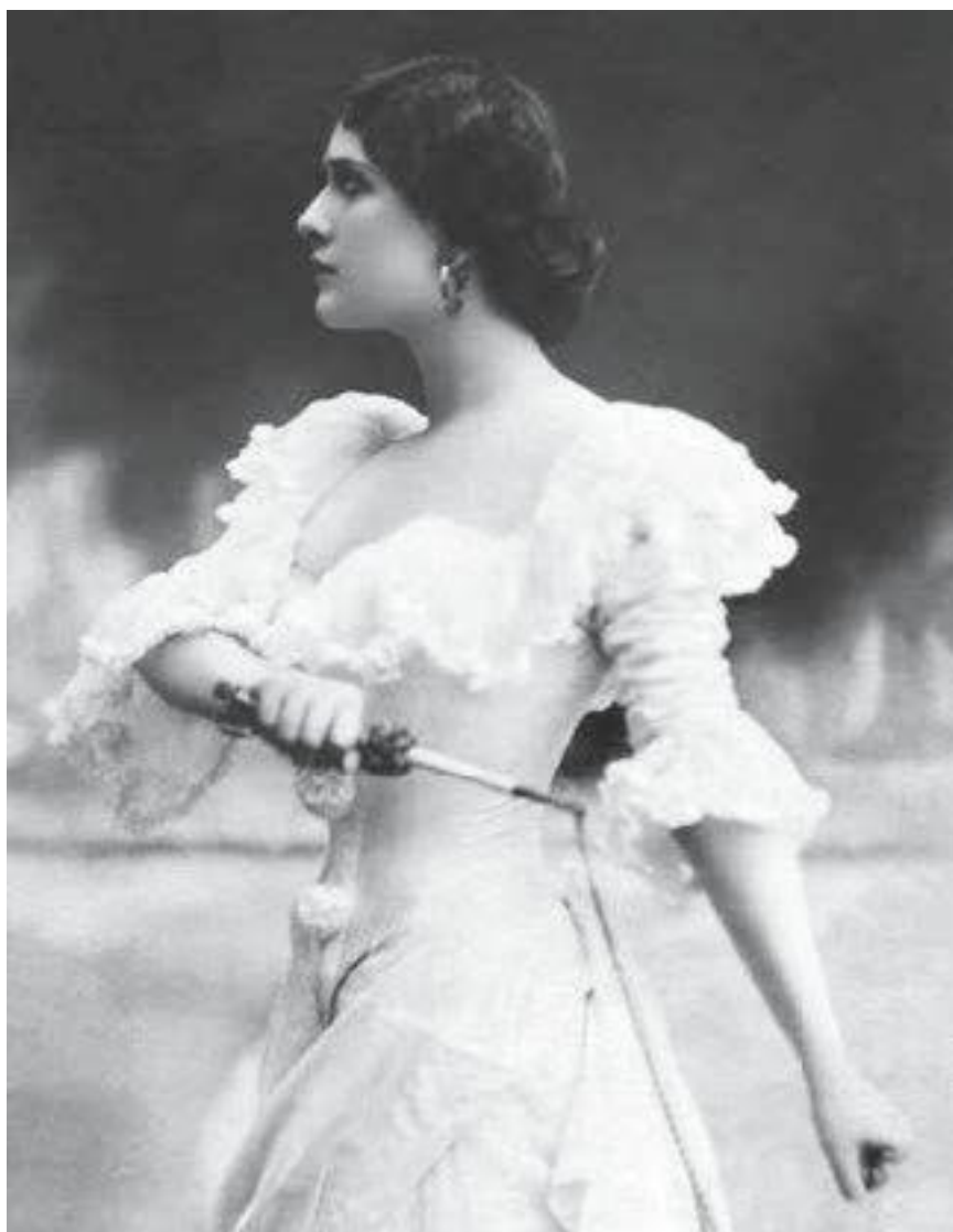
Лина Кавальери, 1890-е годы