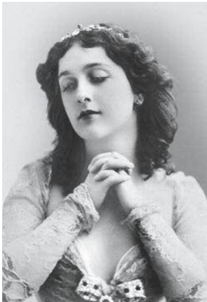
Лина Кавальери, 1890-е годы

Затем меня пригласили в Salone Margherita и, наконец, Неаполь. Это стало для меня трамплином, чтобы совершить прыжок через Альпы и добраться до Парижа, где в Folies Bergère я достигла подлинного успеха. Париж! Великий город, завораживающий провинциальные души, необъятный международный мегаполис, оазис всех влюбленных! Я помню картинку французской столицы, которую я наблюдала однажды вечером из окна кафе на Елисейских Полях. Было холодно, свет уличных фонарей расплывался масляным пятном, как на промокательной бумаге. «Париж, – подумала я, – это огромная сцена величайшего европейского театра жизни, на которой актеры и зрители сменяются каждый день, готовые показать комедию или раскритиковать ее, в зависимости от того, надежды или разочарования, любовь или ненависть, счастье или горе, богатство или бедность, позитивное или фатальное преобладает в мимолетный момент нашего существования».