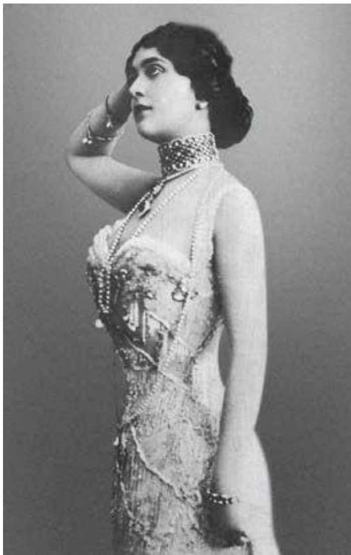
Лина Кавальери, 1900-е годы