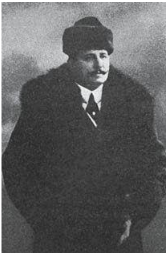
Маэстро Тото Амичи, 1910

Но я хочу упомянуть и другие имена, не для того чтобы продемонстрировать список известных личностей, любимых публикой разных стран, а потому что это дорогие для меня люди. Из воспоминаний встают образы, вызывающие в моем сердце нежность и благодарность: незабываемый итальянский тенор Анджело Мазини; кумир русской публики, баритон Маттиа Баттистини; колоратурное сопрано Луиза Тетраццини; бас Витторио Аримонди; австрийский оперный певец Йозеф Кашманн; один из лучших теноров в истории оперного театра Франческо Таманьо; великий Энрико Карузо; скрипач и певец Джузеппе Ансельми; итальянский баритон Антонио Скотти и гитарист-волшебник, самый дорогой спутник моих творческих начинаний, сердечный друг и соотечественник Тото Амичи.