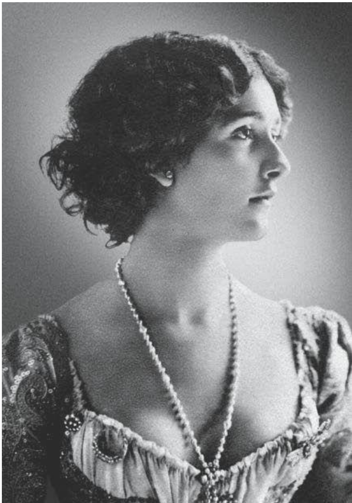
«Дебютантка в концертном кафе», 1890-е годы

Мой репертуар начался с трех песен: O Cavallo d'o Colonello , Streghe и Chiara Stella . Приложив немало усилий, мне удалось устроиться в маленький театр на пьяцца Навона, где я зарабатывала не меньше лиры за ночь!