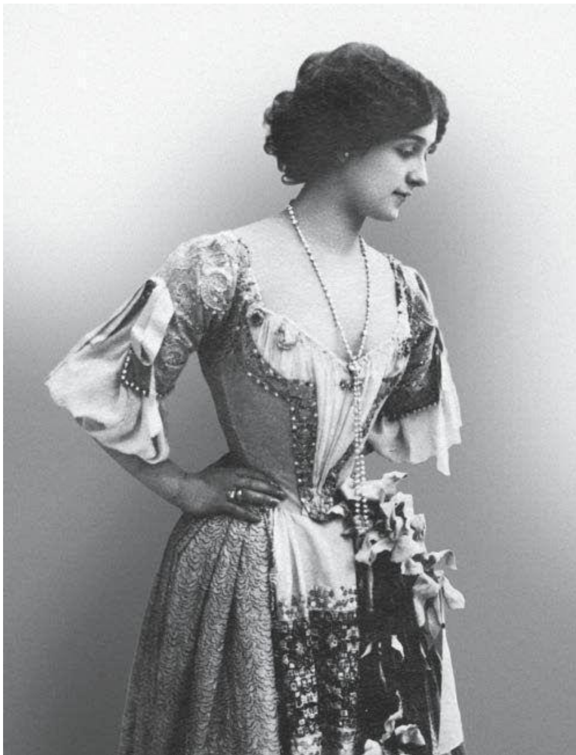
Лина Кавальери в роли Мими в опере Пуччини «Богема»

Это был Неаполь, где каждый ребенок поет с утра до вечера, как будто они рождаются с радостью, заглушающей боль. Это был Неаполь – великолепный амфитеатр, где природа ежедневно показывает необыкновенное зрелище своим восторженным поклонникам. Именно Неаполь закалил меня для боя, сделал меня победительницей! Вы когда-нибудь вдыхали запахи водорослей, поднимающихся порывами со скал Марджеллины? Вы когда-нибудь любовались сиянием тысячи огней, покрывающих побережье Позиллипо и отражающихся в стальных водах залива, как множество колышущихся светлячков? Глядя на Сорренто, усеянный огоньками