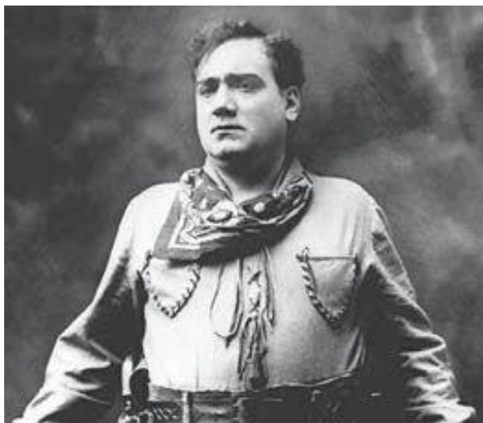
Энрико Карузо, 1903