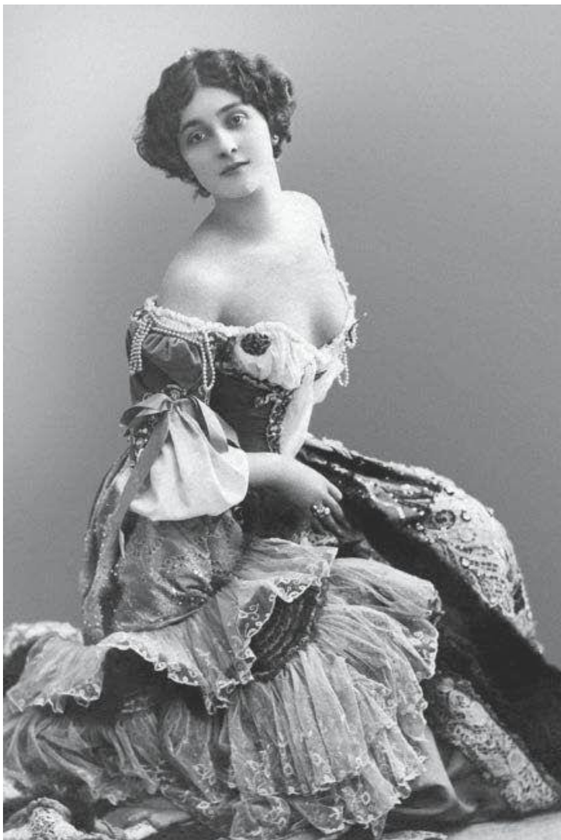
Лина Кавальери, 1900