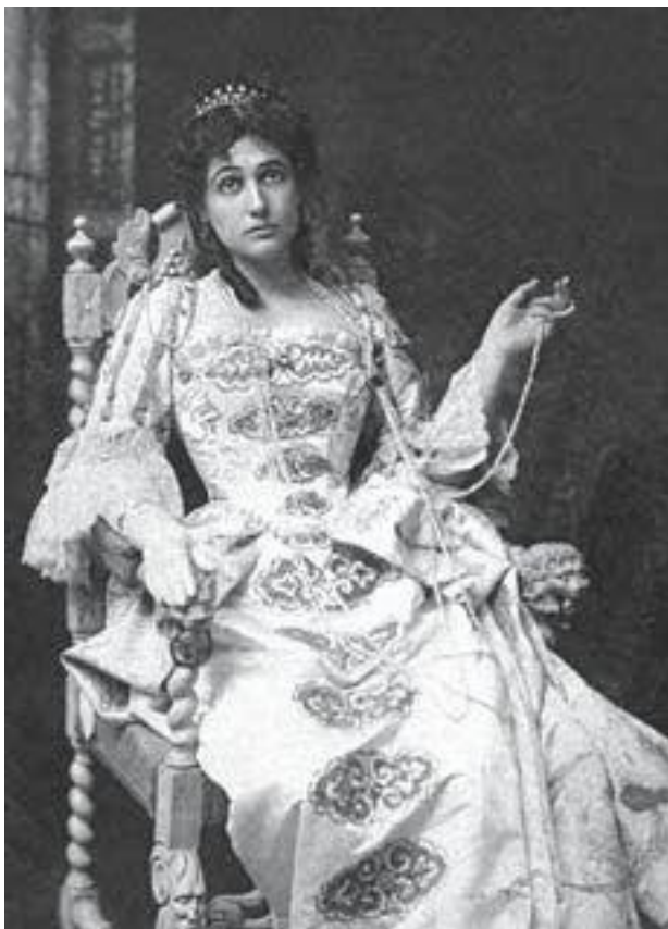
Лина Кавальери в роли Недды в опере Леонкавалло «Паяцы»