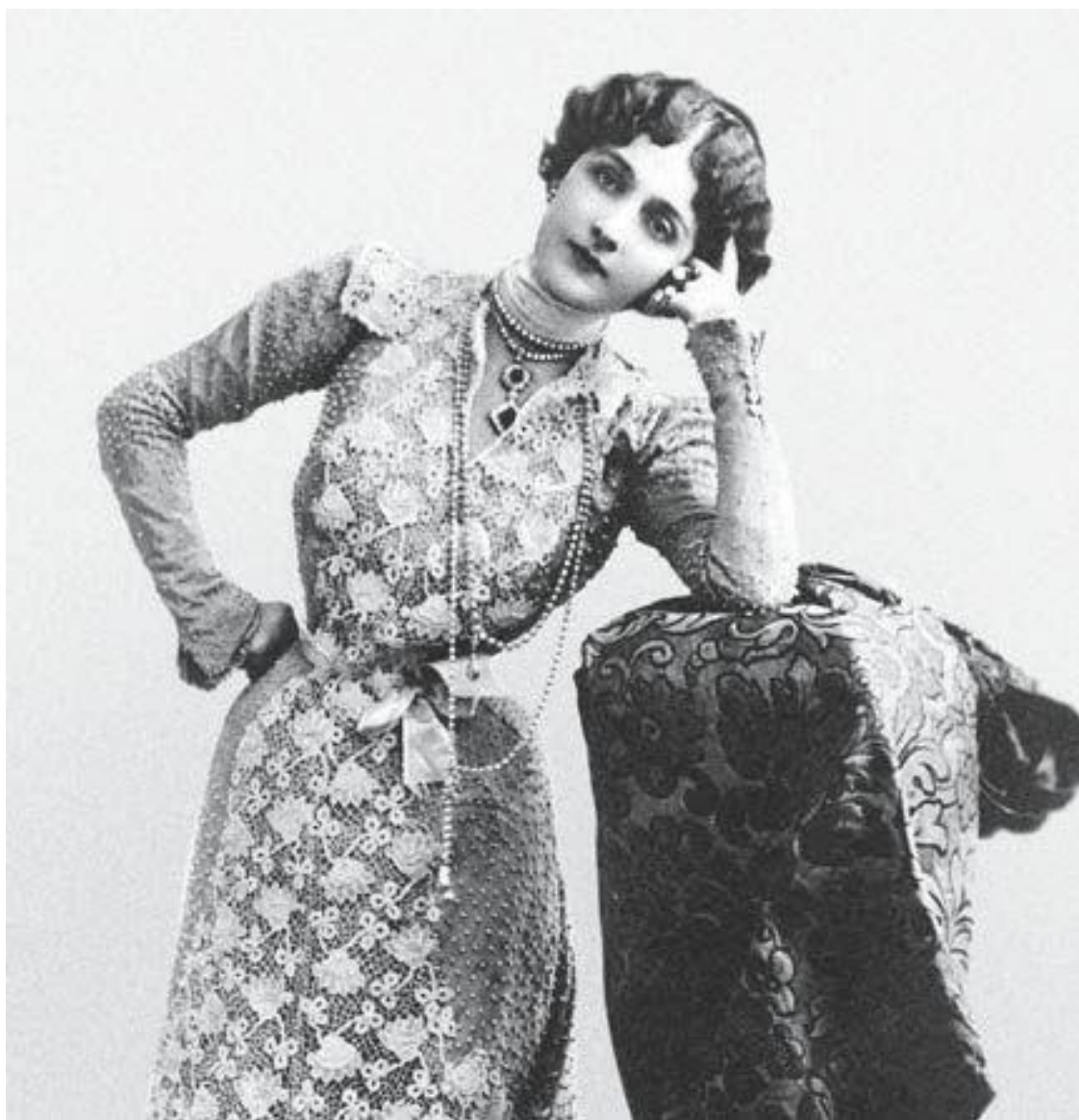
Лина Кавальери, 1890-е годы

Последний случай произошел в Мариенбаде. Маркиза де Гама пригласила меня на музыкальный вечер, пришлось петь. Среди присутствовавших был король Англии Эдуард VII 12 . Он был очень вежлив, слушал меня с интересом, а когда подошел ко мне с комплиментом, спросил, знаю ли я романс «До свидания» Франческо Паоло Тости 13 . Король был большим другом и искренним поклонником великого музыканта, автора Marechiare . Я не знала этого романса и по названию Goodbye , не знаю почему, решила, что это веселая и легкомысленная песенка. Я решила подчеркнуть свою художественную восприимчивость и немного сухо ответила: «Нет, сир, это недостаточно серьезно для меня. Я такое не пою!» Изумленный король Эдуард лишь ответил мне коротким вопросительным междометием. Лишь несколько лет спустя я услышала этот знаменитый романс, полный чувства ностальгии, и поняла весь ужас моей «оплошности» и высокомерия.