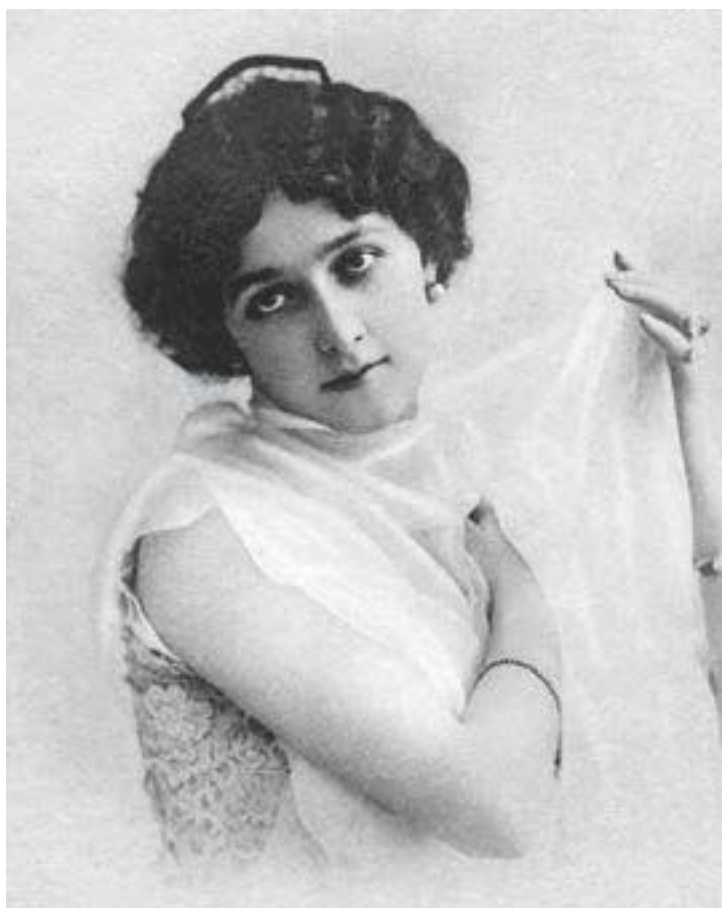
Лина Кавальери, 1900-е годы

Почти для всех женщин в годы юности брак представляет собой мечту, желаемую цель. И это правильно. Общество со своими моральными и систематизированными законами, сама природа заставляет так думать. Создание новой семьи, рождение детей – это сама причина нашего существования. Следовательно, брак необходим. Любые возражения против брака разбиваются об эту этическую и естественную истину. Бывает, что союзы несчастливы, но это происходит из-за неправильного представления о том, как брак устроен. Любовь и брак не могут иметь одинаковую продолжительность, по крайней мере в большинстве случаев. Это должны понять все девушки и мужчины, вступающие в брак. Это уберегло бы их от многих печалей.