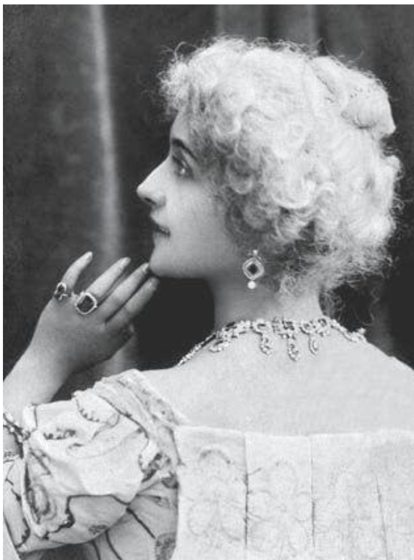
Лина Кавальери в опере Пуччини «Манон Леско», 1907

После триумфального показа «Федоры» были поставлены оперы «Богема» и «Манон Леско». Между репетициями Карузо ходил в зоопарк в Центральный парк, его забавляли обезьяны. Однажды днем он, как обычно, вышел на прогулку, по своей привычке засунув руки в карманы своего большого пальто. Он остановился перед вольером с обезьянами, которые прыгали и резвились. Вокруг собралась большая толпа, все смеялись и веселились. Перед тенором стояла дама, вдруг она закричала и набросилась на певца. Вмешался полицейский, и взволнованная дама заявила, что, пользуясь толкучкой, «этот джентльмен осмелился подойти к ней очень близко и... ущипнул ее». «Джентльмен» доказывал свою невиновность, сообщил свои личные данные и заявил, что стал жертвой шантажа. Но полицейский ничего не стал слушать, арестовал его и повел в участок.