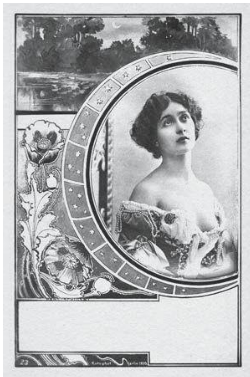
Лина Кавальери. Открытка

В Америке меня провозгласили «самой красивой женщиной в мире». Любой, кто знает Америку, понимает, насколько выступления там влияют на всю карьеру. Пробираясь сквозь толпу, ожидавшую нас, я подумала, что в этой свободной стране нас так встречают, что мы не можем свободно и благополучно ступить на землю. В стране Дяди Сэма этой свободы действительно нет: непрекращающийся вихрь жизни захлестывает вас с первого момента вашего прибытия, заставляя маршировать в безудержном ритме. Кругом небоскребы уходили в небо и напоминали мне Вавилонскую башню из Библии, только с той разницей, что здесь не было смешения языков и все люди были готовы подняться в небо, захватить землю и стать владыками моря.