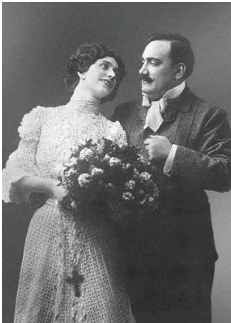
Лина Кавальери и Энрико Карузо, 1907

На следующий день американские газеты, жадные до скандалов, много писали о моем исполнении Федоры и спорили о возможности или запрещении подобных сцен. New York World писала: «Кавальери и Карузо в горячих объятиях вызвали восхищение у публики в “Метрополитен-опера”». Я была счастлива, особенно потому, что объектом моего живописного поцелуя был Карузо, мой большой и хороший друг, которым я всегда безмерно восхищалась. Зачем это отрицать?!