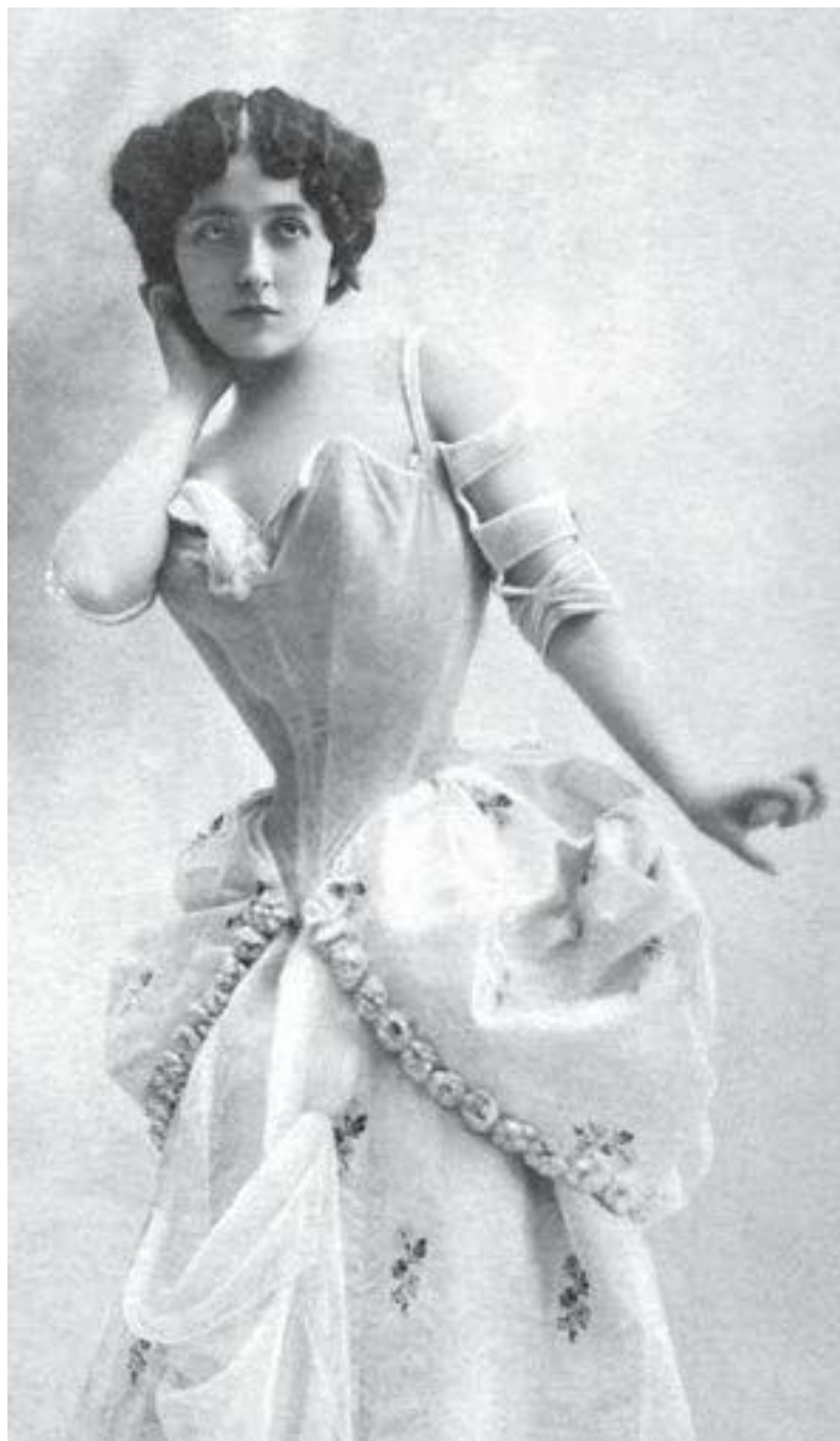
Лина Кавальери в сценическом костюме, 1900-е годы

Когда стихли последние такты оперы и публика разошлась, артисты собрались, чтобы обсудить и оценить выступление, и все вместе должны были признать, что успех был необыкновенным. Успех спектакля был обусловлен чудом древней сцены, вызывавшей воспоминания, и гармонией театра.