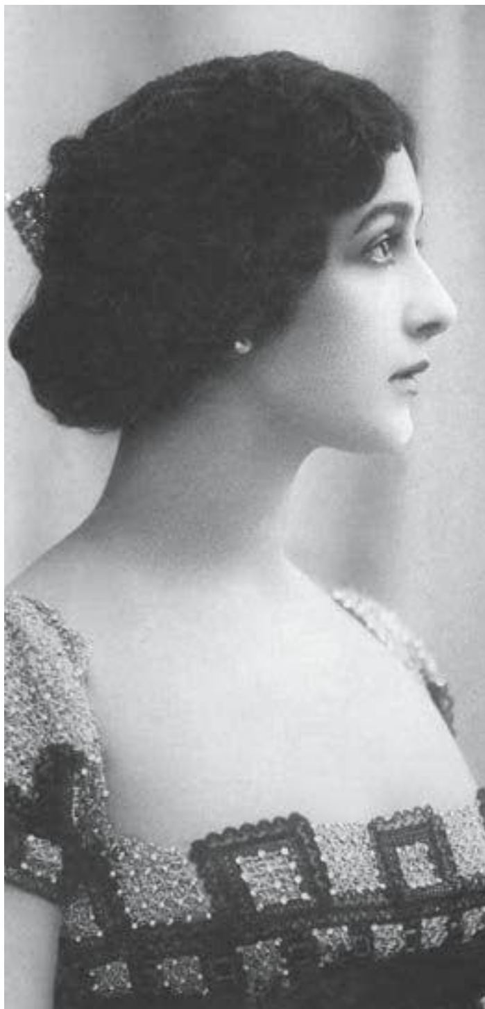
Лина Кавальери, конец 1890-х годов