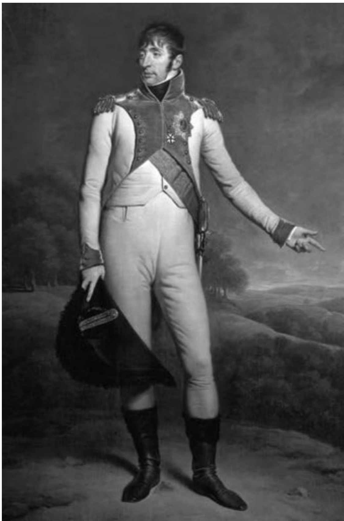
Луи Бонапарт, король Голландии. Художник Ч. Ходжес, 1809