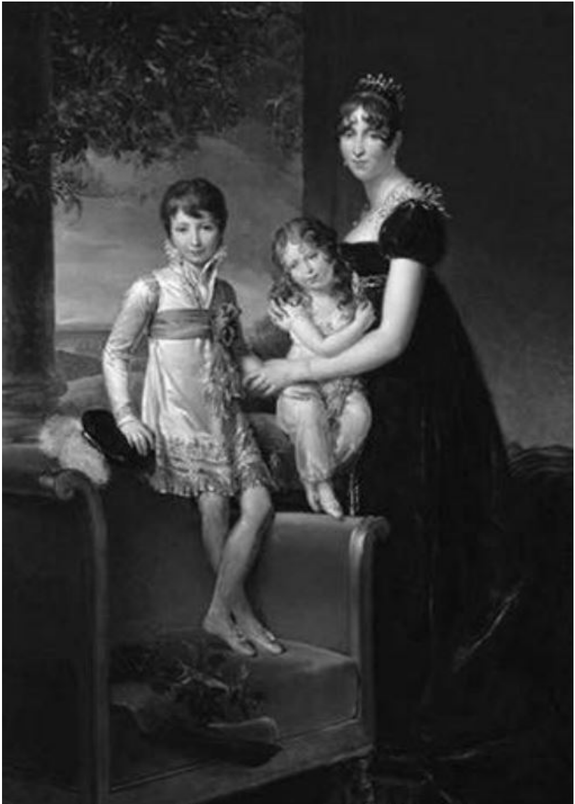
Гортензия Богарне с детьми (Наполеон Луи и Луи Наполеон). Художник Ф. Жирар, 1811

чик, Огюст Шарль. Несмотря на завесу секретности, которой Гортензия и де Флао пытались окружить это событие, император по каналам тайной полиции хорошо был обо всем информирован.