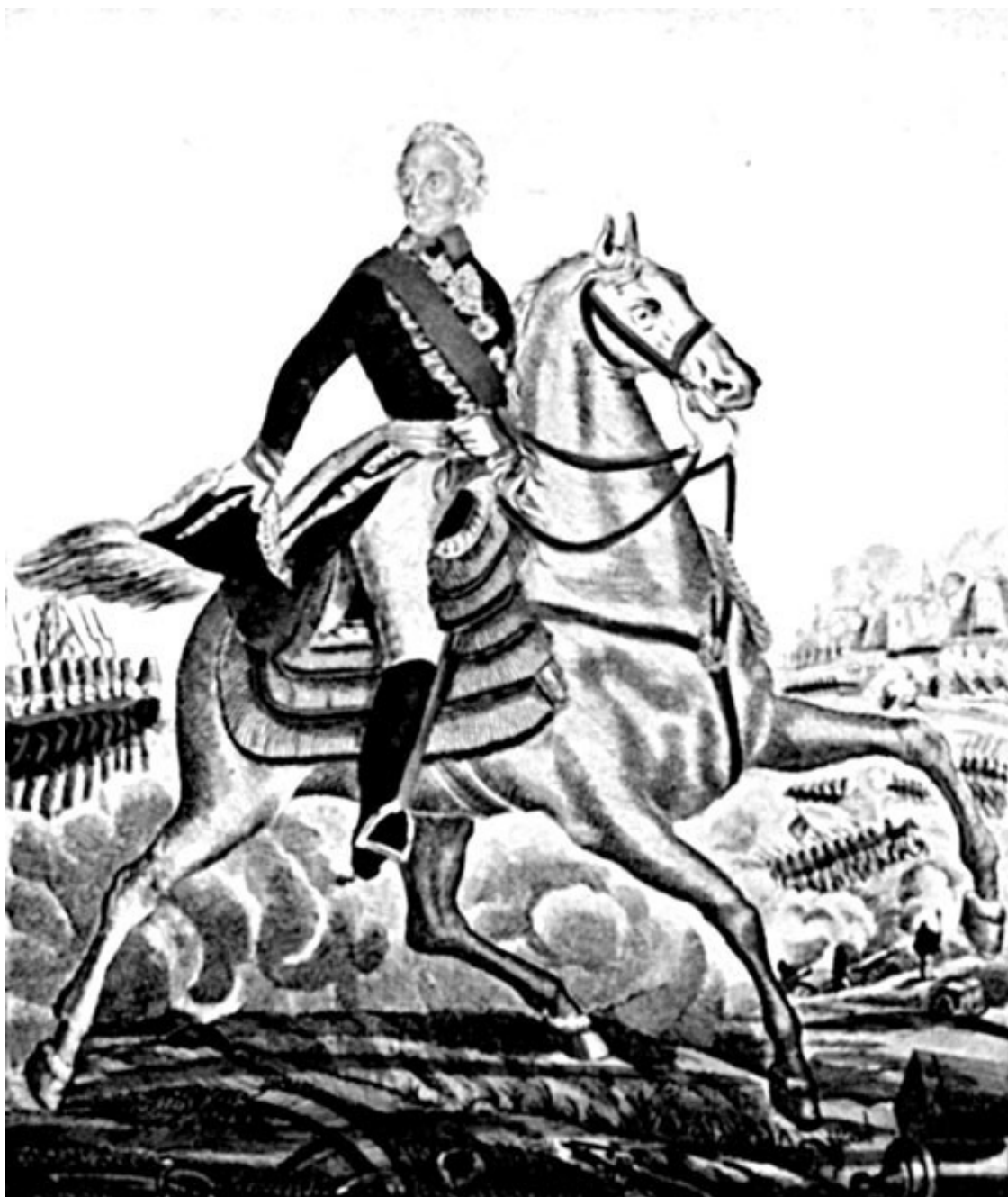
Лубочный образ А.В. Суворова

Здесь в ходе Семилетней войны начинает складываться боевой стиль будущего полководца: тотальная продуманность боя, быстрое и решительное осуществление своего замысла. Причем настолько быстрое и решительное, что фактически неожиданное для противника. Иными словами, противник, возможно, и ожидал, что Суворов нагрянет именно отсюда, но никогда не ожидал такой скорости и такой силы удара. Суворов рискует, но всегда рискует оправданно, не пробует, не пытается, не старается, а тщательно готовит и наносит молниеносный удар, предпочитая холодное оружие (штыки или сабли).