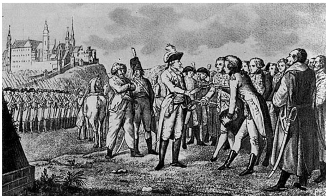
Сдача Краковского замка А.В. Суворову. 1772 г. Гравюра XVIII в.

Часто эту войну изображают как русско-польскую, и, более того, для Польши национально-освободительную, что в корне неверно. Эта война имела все признаки гражданской войны с ярко выраженным религиозным подтекстом. Прежде всего это была война между польским королем Станиславом Понятовским и мятежной шляхтой, которая пыталась сбросить его с трона. Причина недовольства носила религиозный характер. Дело в том, что под давлением России и Пруссии Станислав был вынужден уравнивать в правах католиков, которые были в большинстве, и православных и протестантов, которые были в меньшинстве и которые тогда назывались диссидентами. Наиболее непримиримые польские вельможи-католики собрались в местечке Бар и решили совместно выступить против польского короля, отсюда и пошло название Барская конфедерация. Чуть позже польские протестанты и православные образовали в Случке свою конфедерацию, которая, наоборот, поддержала короля, неудивительно, что Россия выступила на стороне единомышленников, тем более что польский король официально обратился за помощью к Екатерине.