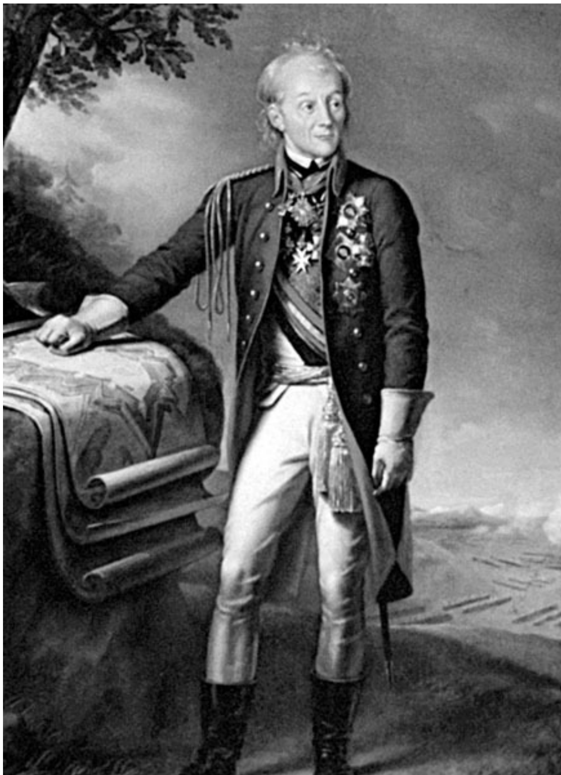
Суворов у карты военных действий. Художник К. Штейбен. 1799 г.

Важно отметить, что кроме постоянного профессионального совершенствования Суворов активно работает над моральным духом подчиненных: религиозность, патриотизм, безупречная нравственность, все служит этой цели. Он буквально взращивает, культивирует победный дух своих войск, строго пресекая любые проявления мародерства, жестокости и насилия к местному населению. Обиженное самолюбие поляков и французов произвело на свет божий бесчисленное количество разного рода пасквилей, рисующих кровожадность Суво-