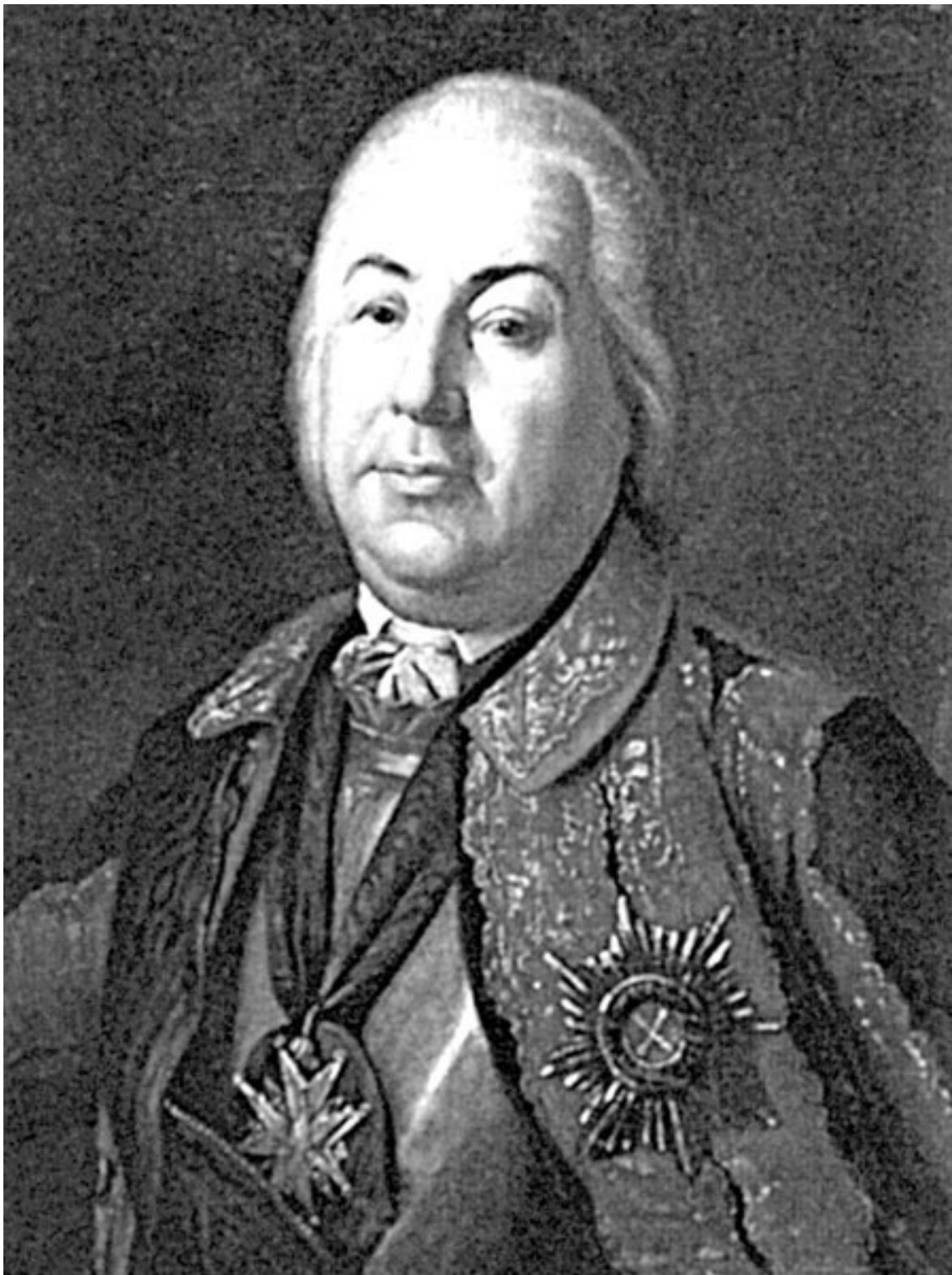
Петр Семенович Салтыков

чине выведен из строя, брать командование на себя. Опять божий промысел направляет судьбу нашего героя, будучи всего лишь подполковником, он имеет возможность учиться воинскому искусству на целом театре военных действий.