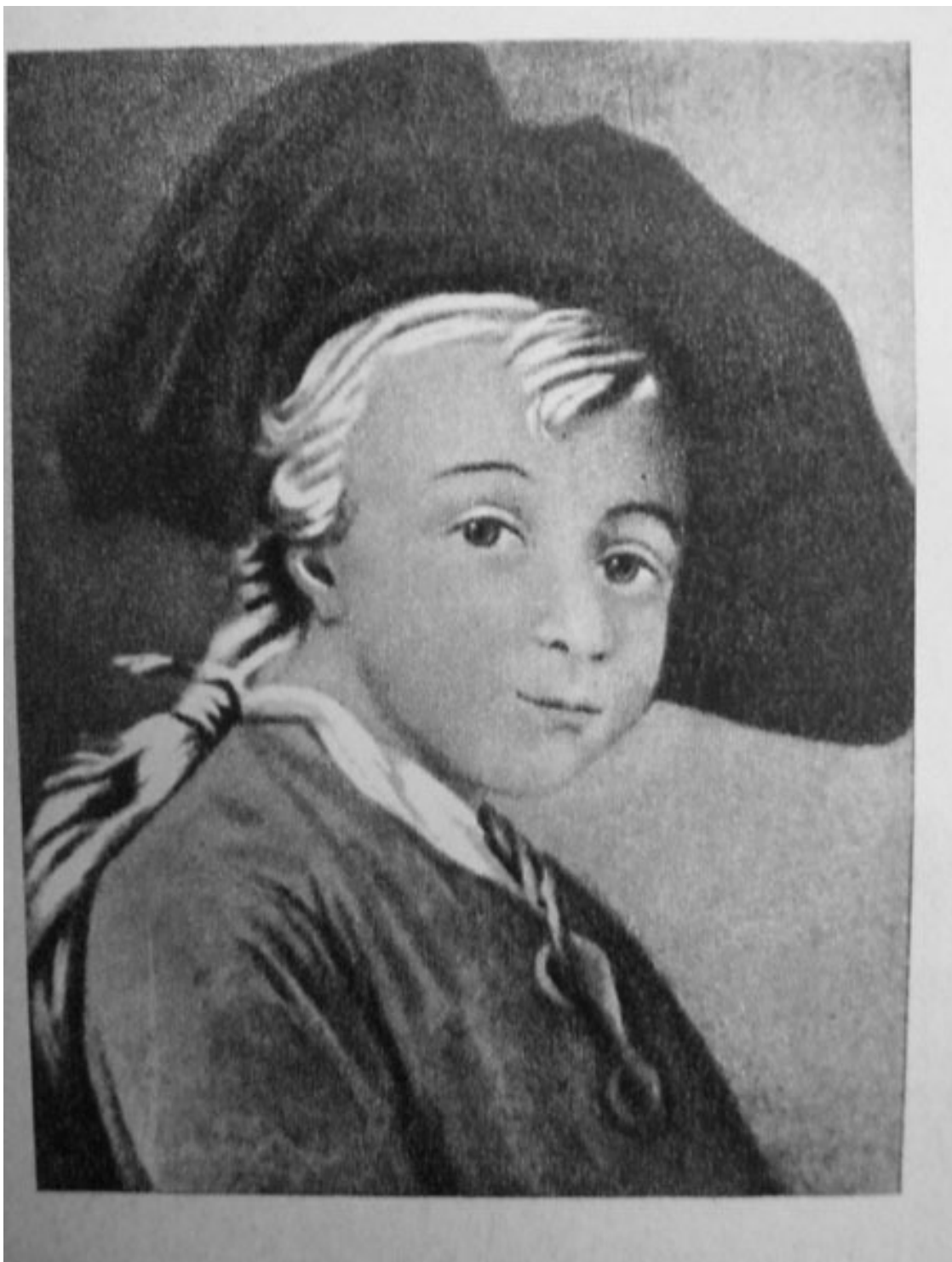
Портрет А.В. Суворова в детстве. Неизвестный художник

Саша тоже не сдаётся, для себя он уже твердо решил – он станет великим полководцем, и его военная слава превзойдет славу Цезаря. Для этого ему нужно: 1) укрепить здоровье, и он разрабатывает сам для себя особую систему физических упражнений и закаливания посредством обливания холодной водой (2 ведра утром, 2 ведра вечером); 2) изучить всю известную в его время литературу по военному делу, и он продолжает усердно изучать военные труды Петра I, Герцога Мальборо, Фридриха Прусского и других выдающихся полководцев. И третий, пожалуй, самый интересный пункт, – познать душу русского солдата. Возможности осуществить данный пункт у него пока нет, но внутренне к его осуществлению он уже готов.