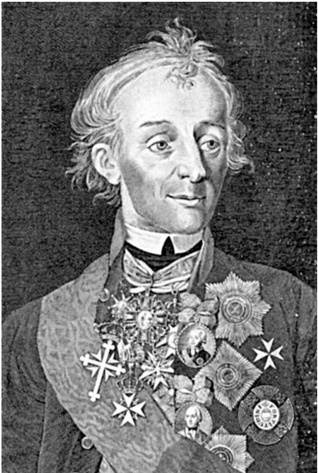
А.В. Суворов. Гравюра А. Флорова