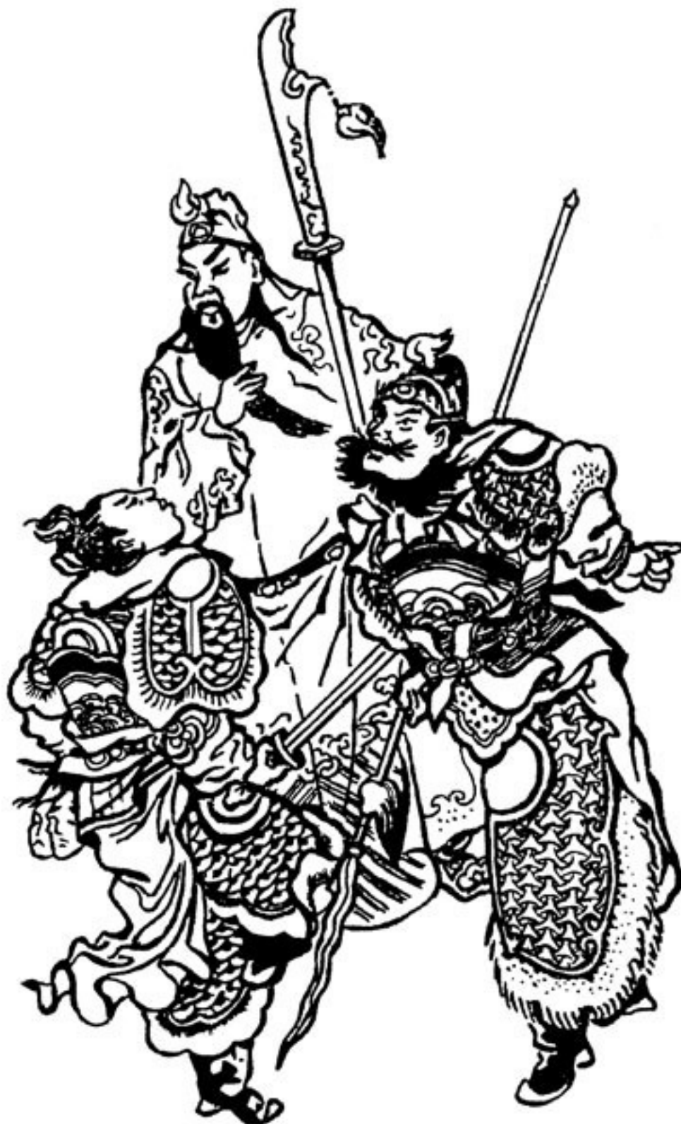
Китайские военачальники. Со старинной гравюры

стратег ставит ее в один ряд с борьбой дипломатической, политической и всякой иной. Отличие только в одном: из всех видов борьбы «нет ничего труднее, чем борьба на войне».