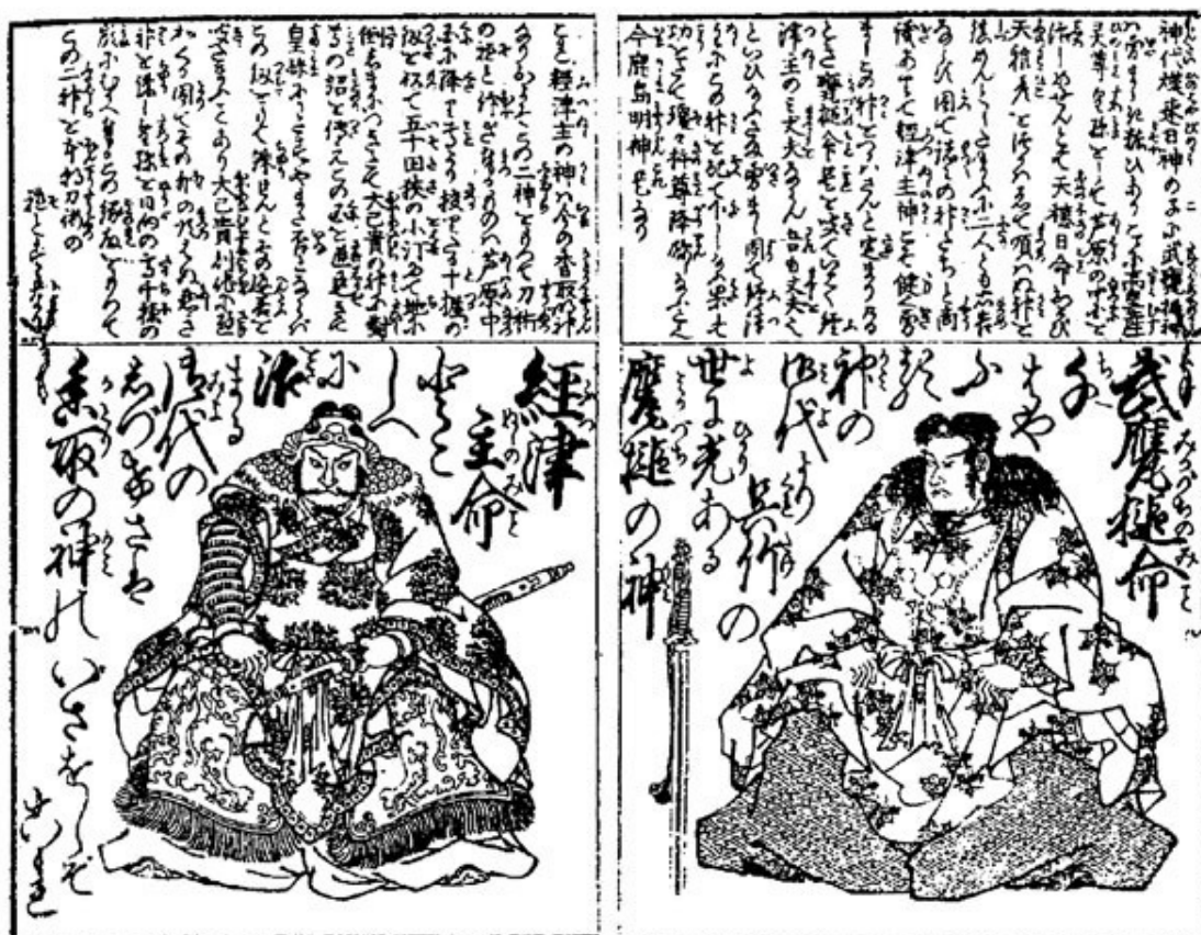
Воинские божества Фуцунуси-но микото (слева) и Такэмикадзути-но микото (справа). Со старинной гравюры

В качестве таких «разведчиков» в «Кодзики» и «Нихонги» упомянуто несколько богов, в том числе и покровители воинов и воинских искусств Такэмикадзути-но микото и Фуцунуси-но микото. Интересно, что с важнейшими центрами почитания этих богов, храмами Касима-дзингу и Катори-дзингу, связаны две крупнейшие школы японского боевого искусства: Касима синто-рю и Катори синто-рю, каждая из которых включает в свою программу свой вариант системы шпионажа и разведки – синоби-но дзюцу .