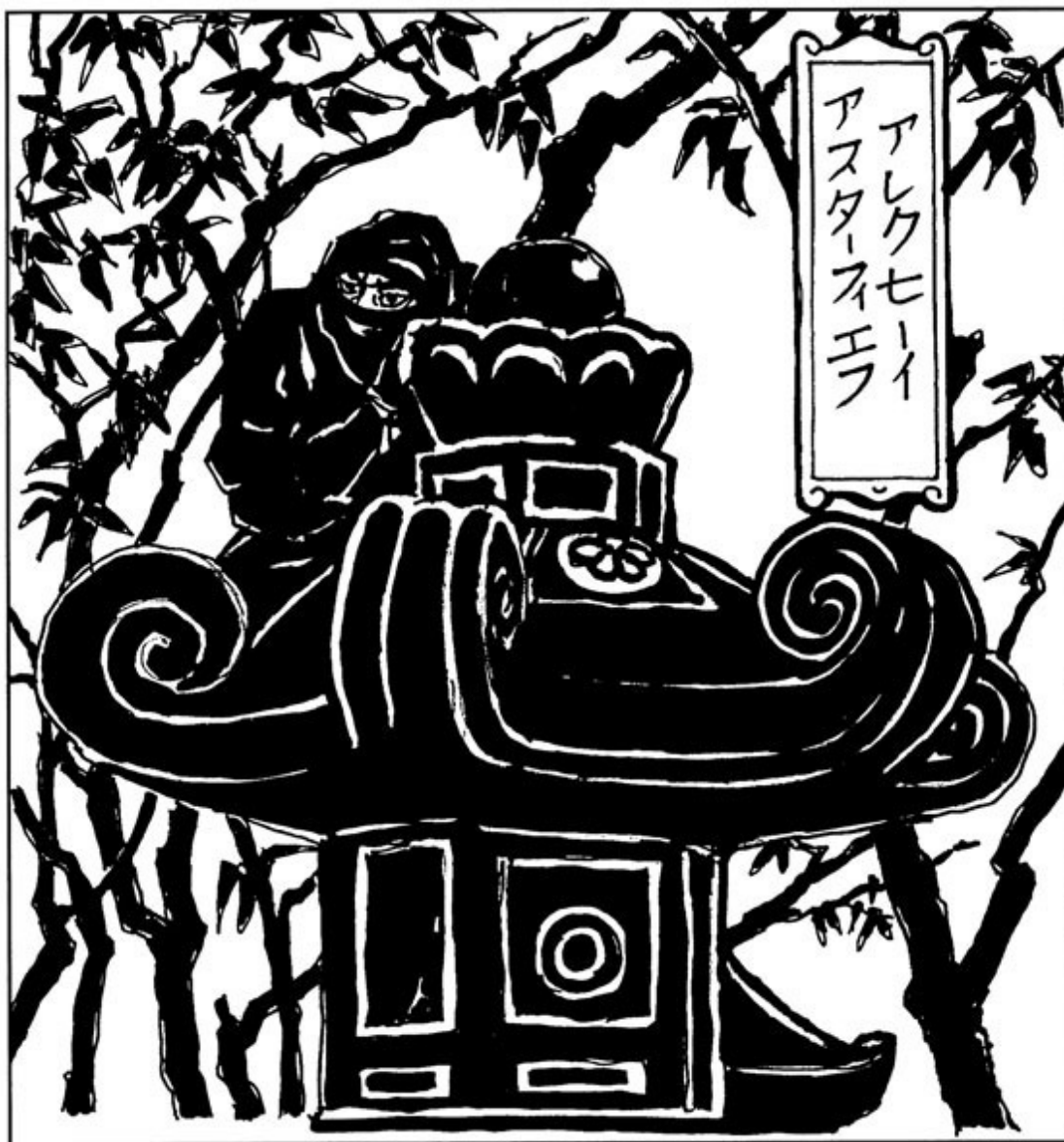
Ниндзя маскируется под каменный фонарь. Рисунок по мотивам японских гравюр

Большую ценность представляют дневники тех времен, например «Тамон-ин никки» («Дневник обители Тамон») 6 .