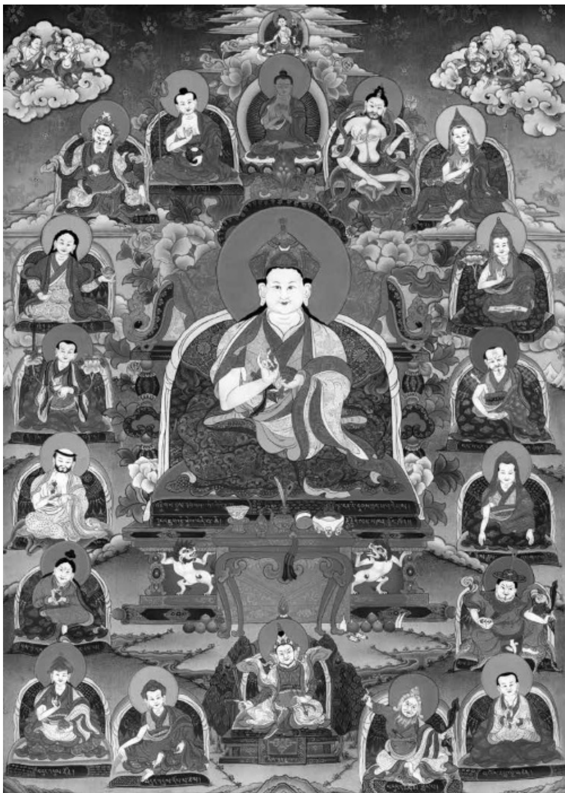
Дуджом Ринпоче, его прошлые и будущие перерождения