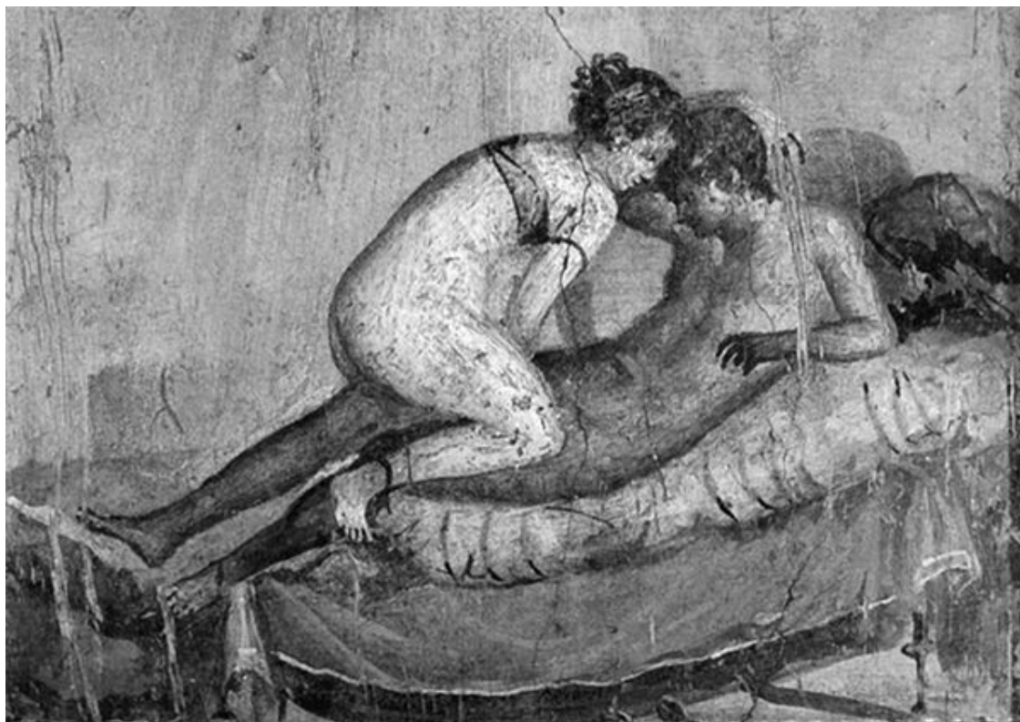
Соитие. Древнеримская фреска

что надо всегда быть готовым к сексу и если кто-то проявляет инициативу, а ты не хочешь или не готов, «нет» прозвучит нелепо и немужественно.