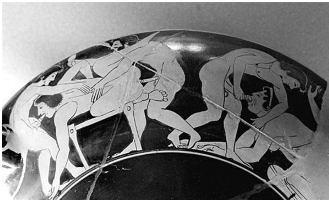
Оргия. Рисунок на древнегреческой вазе

После многих лет практики публичного секса нас поражает, что большинство людей ни разу не видели, как это делают другие. Оглянитесь вокруг – все люди прекрасны, когда кончают. Поэтому оргия – рай для эксгибициониста: на секс-вечеринках каждый становится звездой и может блистать как никогда.