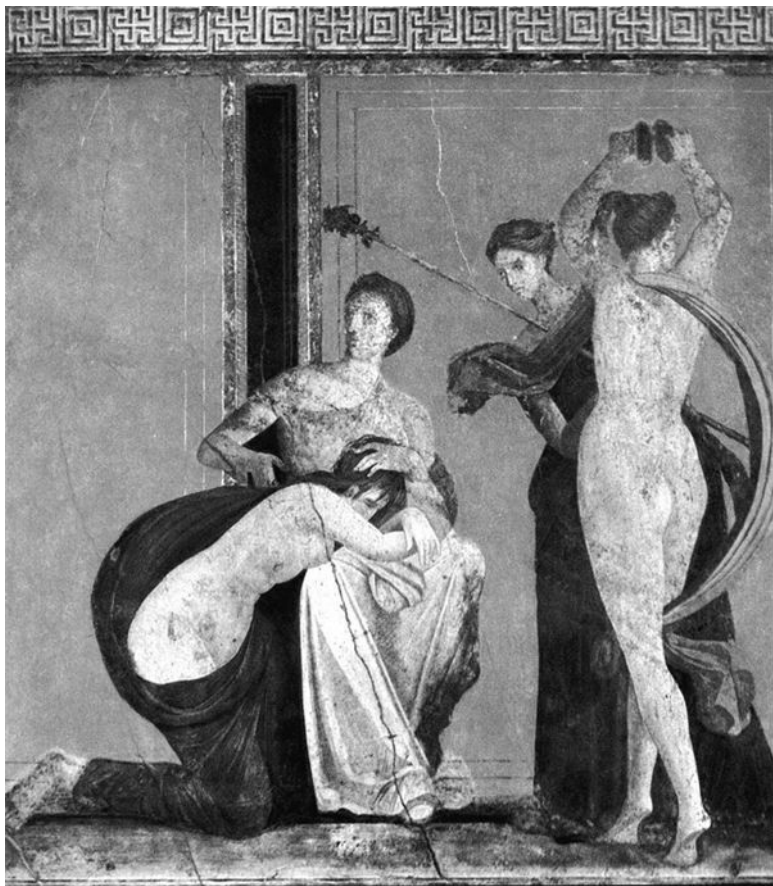
Бичуемая девушка и вакханка. Древнеримская фреска

Если бы познание другого человека шло вглубь, если бы познавалась бесконечность его личности, то другого челове-