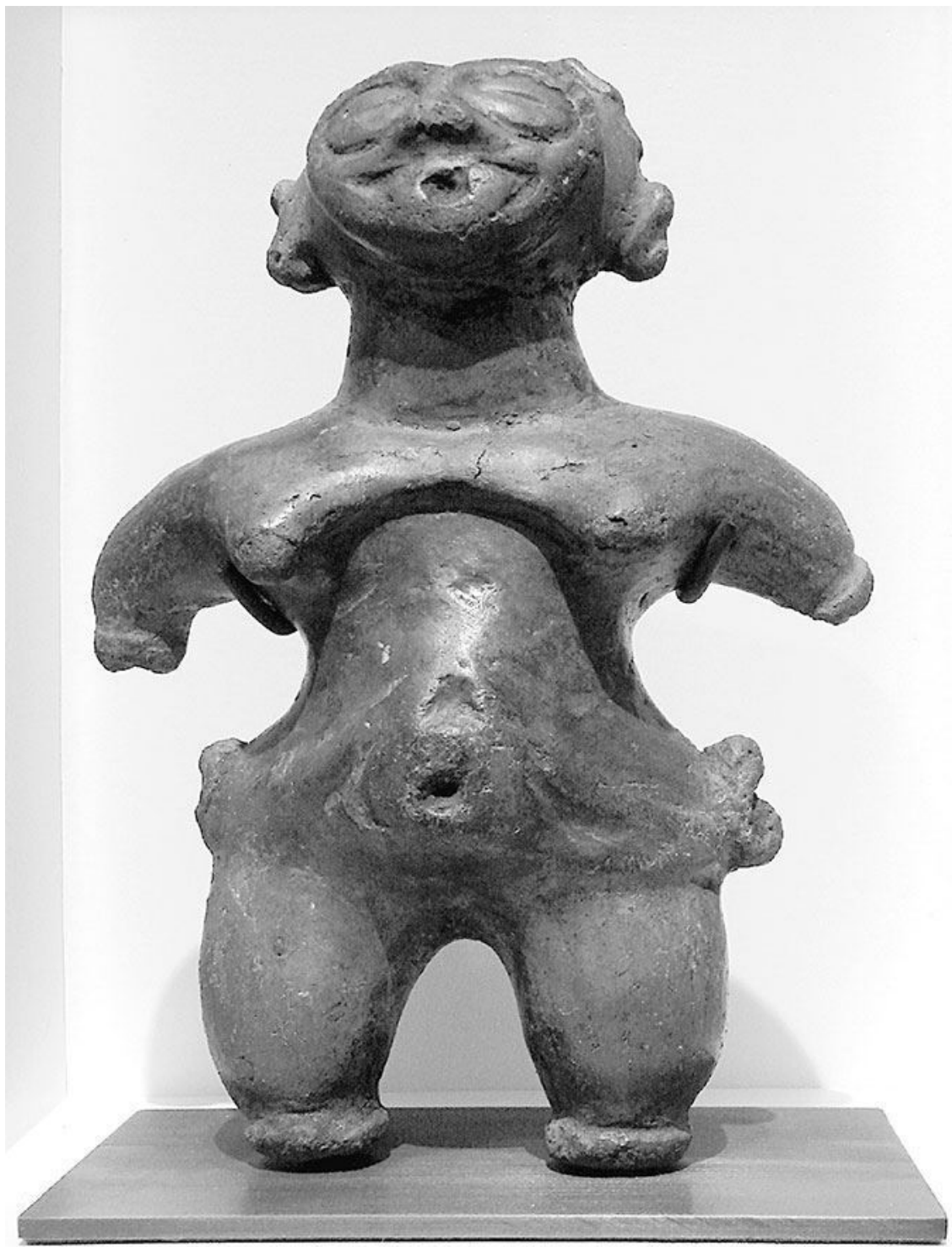
Догу (глиняная фигурка) периода Дзёмон (г. Хиросаки, преф. Аомори)

«Я раскрыл книгу по истории, но, о каком бы периоде ни шла речь, каждая страница книги была испещрена словами «гуманность», «справедливость», «мораль», «добродетель». Так как я все равно не мог уснуть, то продолжал читать далеко за полночь и вдруг обнаружил, что вся книга пронизана одним словом: «людоедство», – писал в Китае Лу Синь. К сожалению, у нас, в Японии, мы еще не можем иметь своих Лу Синей.