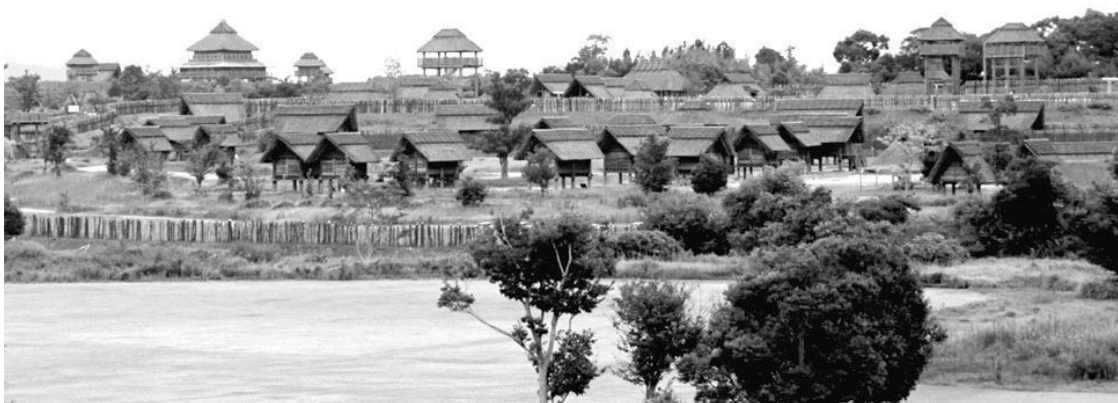
Реконструкция стоянки Ёсиногари, период Яёй (пос. Ёсиногари, преф. Сага)

Древнее рабовладельческое общество Японии, находившееся под влиянием континентального Китая, где в то время уже существовал феодализм, не достигло того уровня развития, какой был характерен для античной Европы. В Японии рабовладение переплеталось с крепостничеством, иначе говоря, Япония достигла полурабовладельческой-полукрепостнической стадии развития, от которой она перешла к феодально-крепостнической стадии.