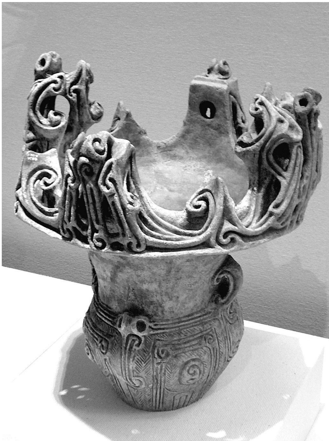
«Огненный горшок», период Дзёмон (пос. Цунан, преф. Ниигата)

Наконец, в-третьих, большинство японского народа, жившего под властью императорской системы, представлявшей собой господство привилегированного класса, по существу, находилось на положении рабов или на положении, близком к рабскому, и эксплуатировалось из поколения в поколение в качестве так называемых бэмин .