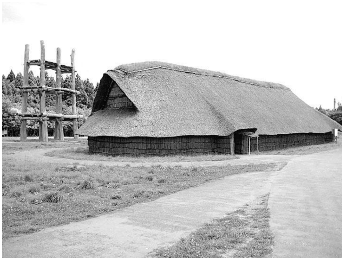
Реконструкция общего дома периода Дзёмон на стоянке Саннай-Маруяма (г. Аомори, преф. Аомори)

Однако в новое время, когда в Японии установилась монархическая система современного типа, стали настойчиво доказывать, что якобы в «Кодзики» и «Нихонсёки» излагается история японского народа. Научные же исследования древней истории, археологические изыскания и изучение древнего общества во многих отношениях и поныне еще находятся на подготовительной стадии.