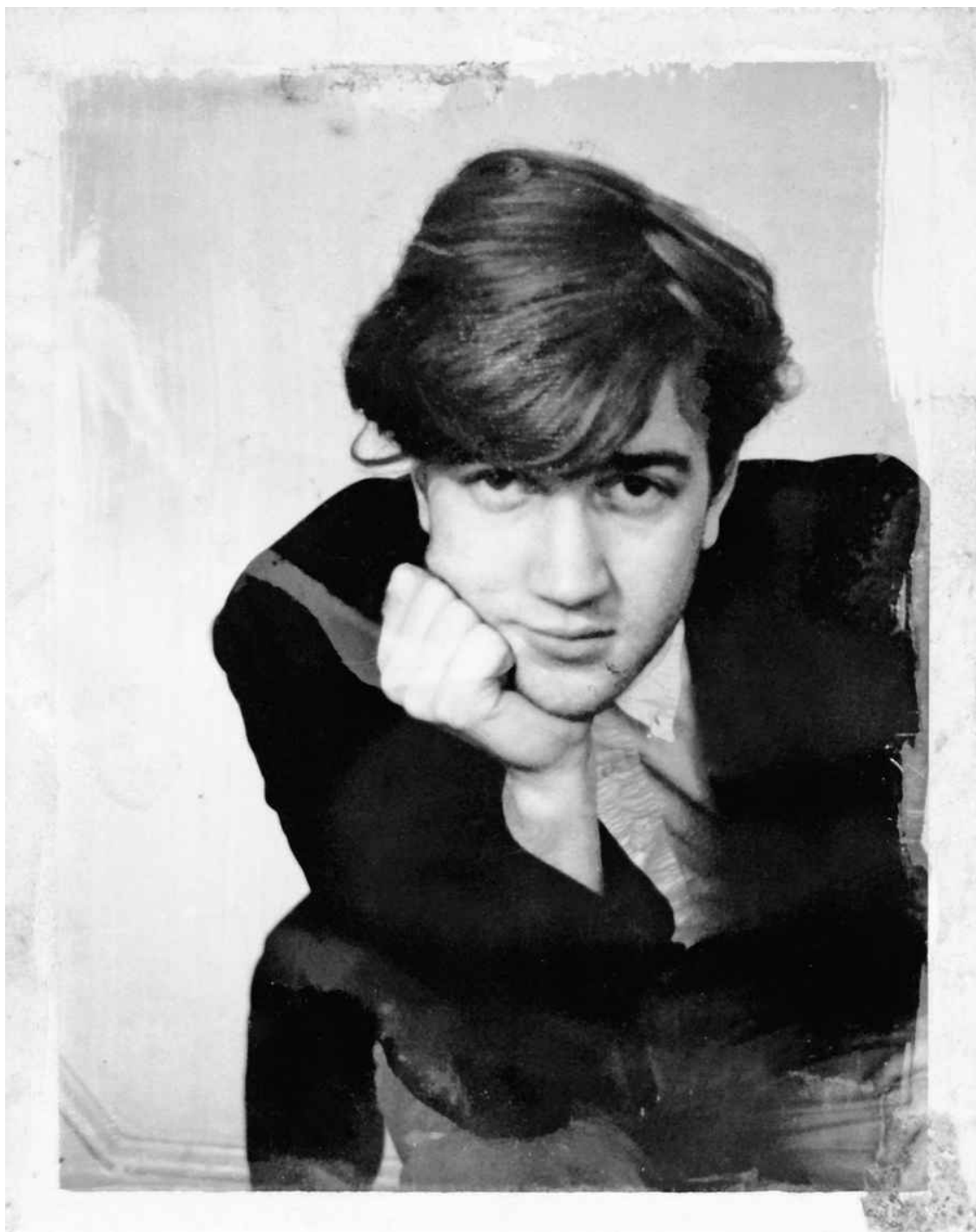
Линч, 1967. «Эта картина была сделана в Филадельфии в доме Отца, Сына и Святого Духа».