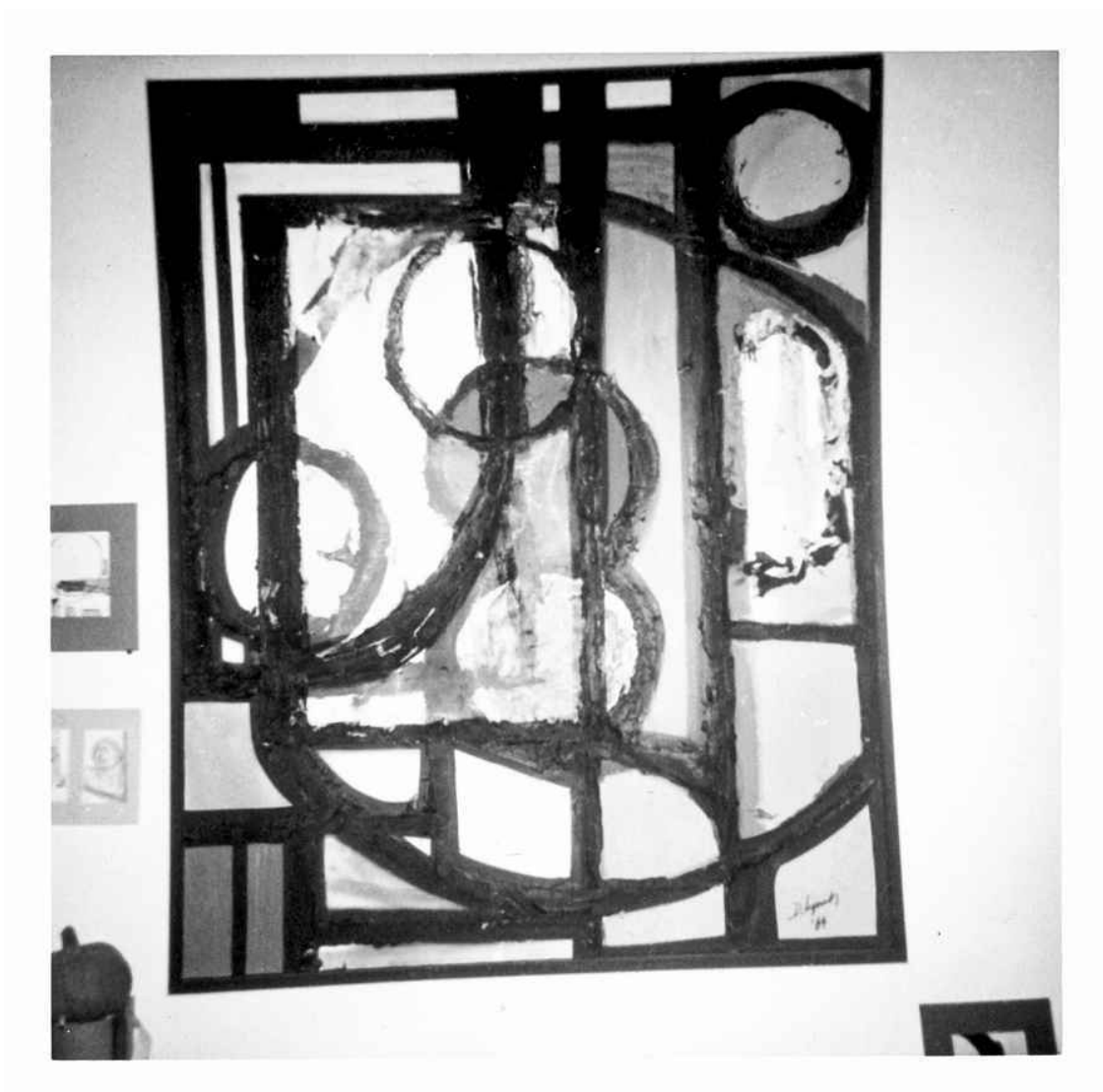
Безымянная картина, масло на холсте (1964). Линч нарисовал эту картину во время обучения в Школе Бостонского музея. Фотограф: Дэвид Линч.