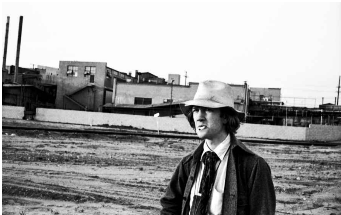
Авантитул: Линч на съемках фильма «Голова-ластик» в Лос-Анджелесе. 1972. 1