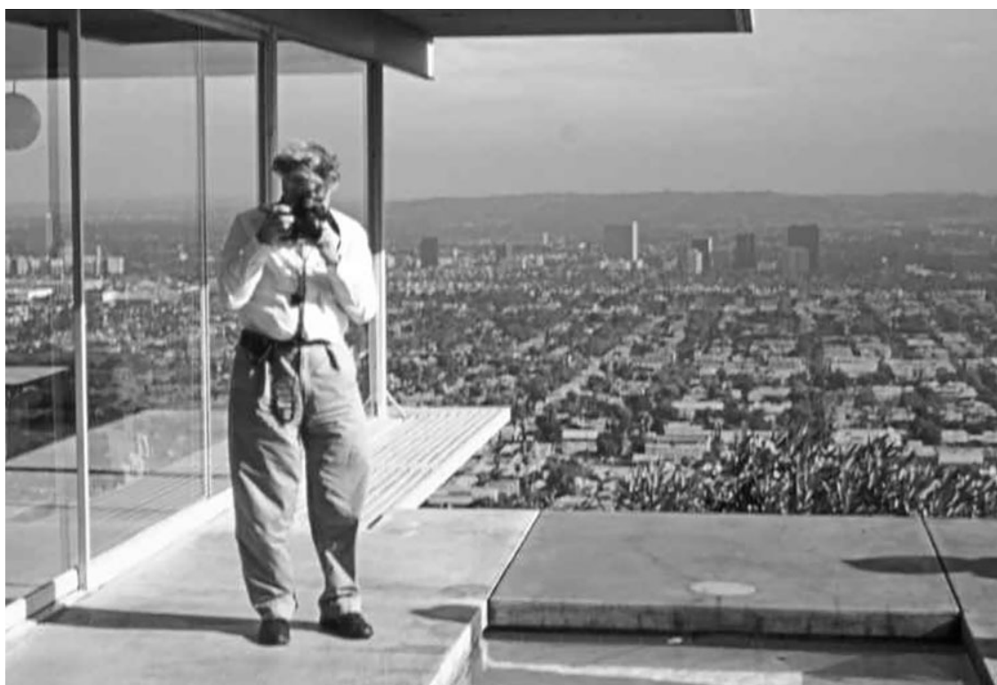
Титул: Линч в доме Пьера Кенига #22 в Голливуде на съемках рекламного ролика L'Oréal , 2004. Содержание: Линч и Патриша Аркетт на съемках фильма «Шоссе в никуда» в 1995 году в доме Линча в Голливуде.