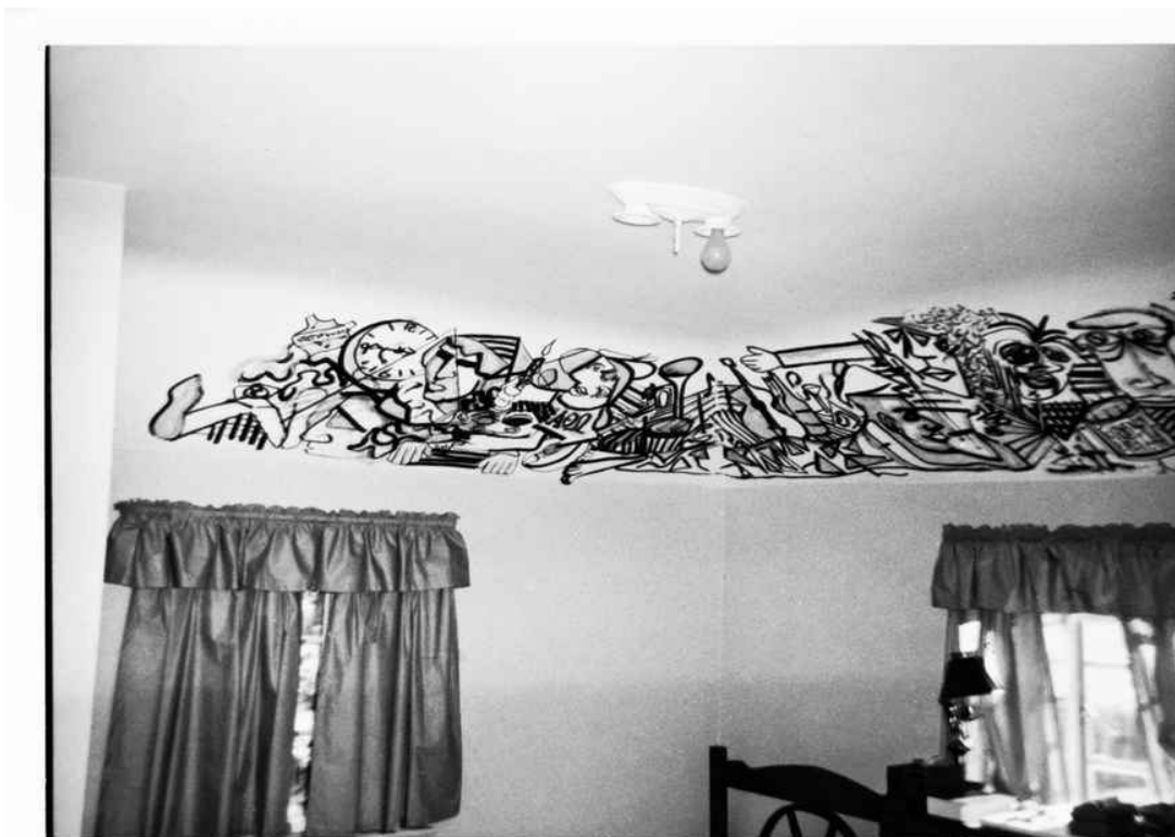
Фреска, которую Линч нарисовал на потолке своей спальни в Александрии, 1963.