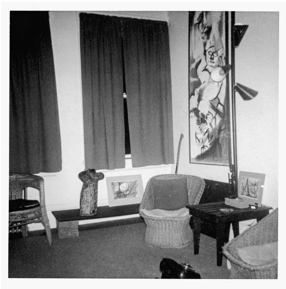
Гостиная в квартире, где жил Линч, когда учился в Бостоне, 1964.

Девятый класс был худшим периодом в моей жизни. Я скучал по своим друзьям из Бойсе, по самому месту – свету, запахам. Вирджиния в этом смысле казалась очень темной. Я не выносил природу в Александрии – леса здесь разительно отличались от тех, что были в Бойсе, и в итоге я связался с плохой компанией и стал в каком-то роде малолетним преступником. Один из тех ребят, вроде как лидер, был старше и похож на взрослого. Лстец. Эта уменьшенная копия Рока Хадсона угоняла соседскую машину, собирала компанию, и мы все отправлялись в округ Колумбия в два-три часа утра на скорости сто двадцать миль в час – вниз по Ширли хайвей, а затем пускались по сувенирным магазинам, выпивали и так далее. Меня тянуло к этому парню, потому что мне не нравилась моя жизнь, и с помощью странных поступков я как-то с этим справлялся. Мне это нравилось и не нравилось одновременно. Как-то раз он пришел ко мне с сигаретой за ухом, начатая пачка торчала из завернутого рукава футболки, и мои родители его встретили. Они не слишком обрадовались. Подумали: «Бедный Дэйв, опять во что-то ввязался...»