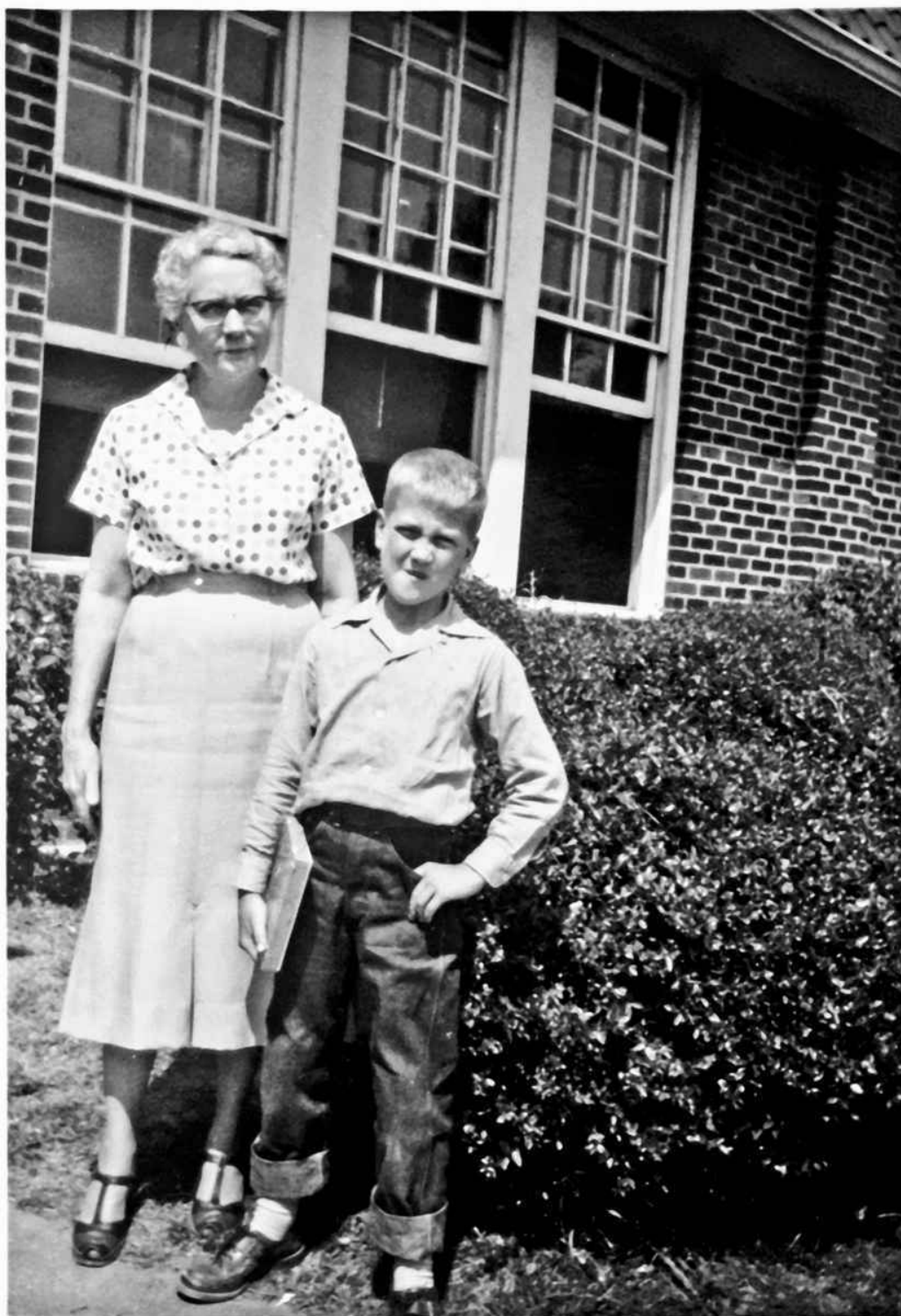
Линч и его учитель второго класса, миссис Крабтри, в Дареме, Северная Калифорния, 1954. «Единственный раз, когда я получил отличную оценку» Фотограф: Санни Линч.