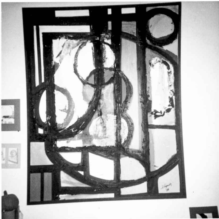
Безымянная картина, масло на холсте (1964). Линч нарисовал эту картину во время обучения в Школе Бостонского музея. Фотограф: Дэвид Линч.