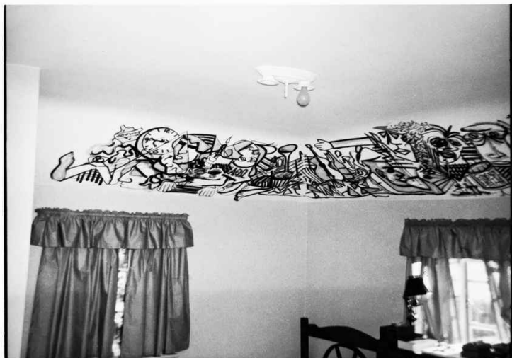
Фреска, которую Линч нарисовал на потолке своей спальни в Александрии, 1963.