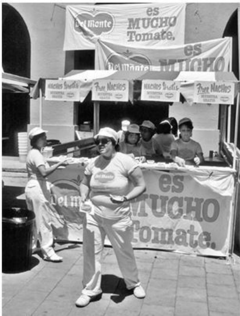
Рисунок 2.2. Буэнос-начос