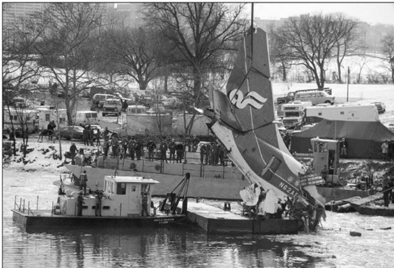
Рисунок 1.2. Катастрофические последствия капитанити- са

За несколько минут до того, как этот авиалайнер рухнул в реку Потомак недалеко от Национального аэропорта в Вашингтоне, округ Колумбия, между пилотом и вторым пилотом произошел обмен мнениями о целесообразности взлета со льдом на крыльях. Их разговор был записан в черный ящик самолета.