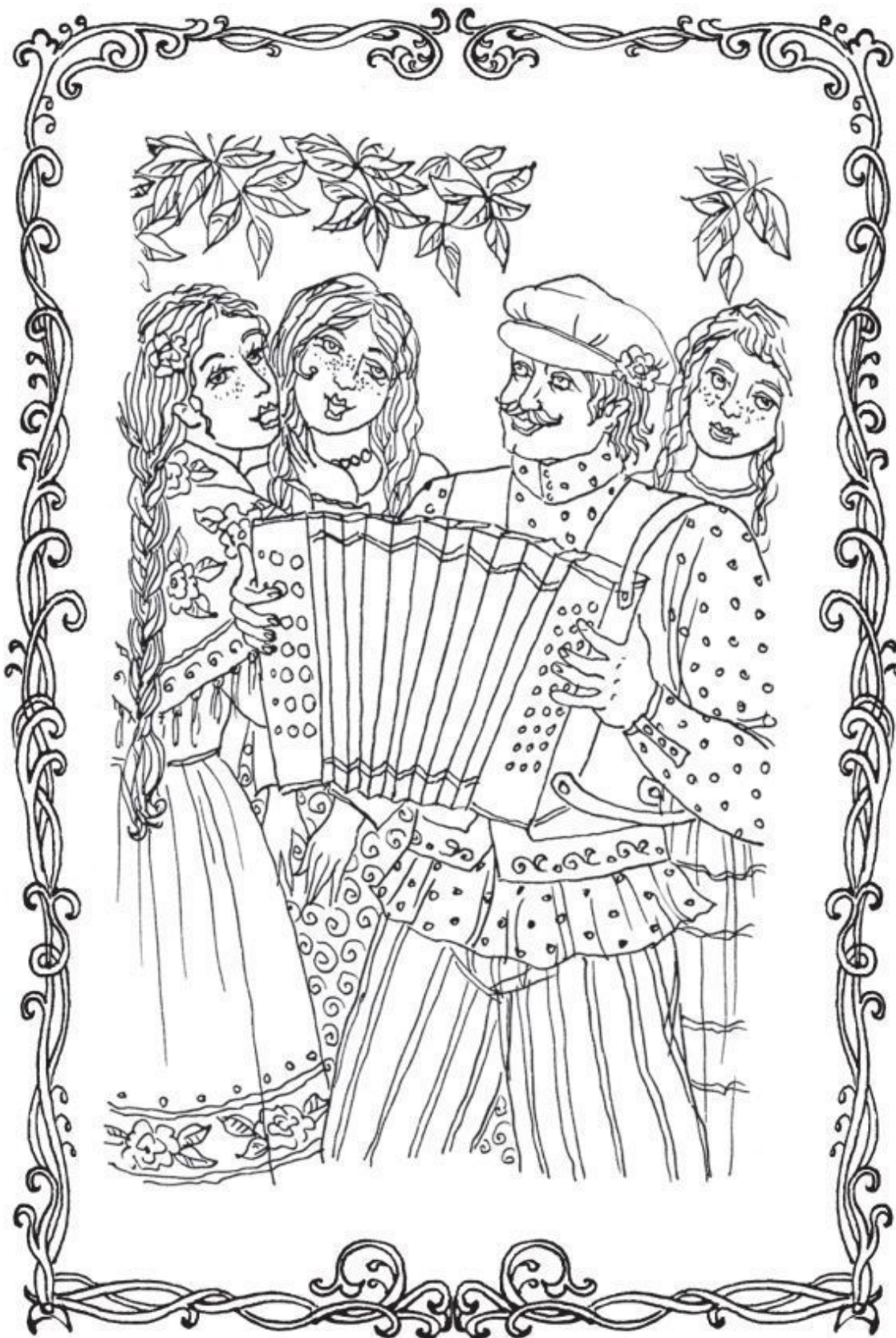
На гармошку, на двухрядку