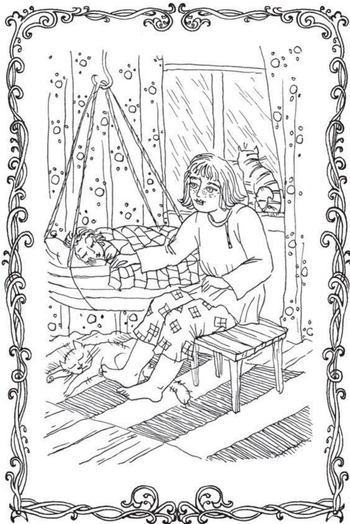
Как хотела меня мать