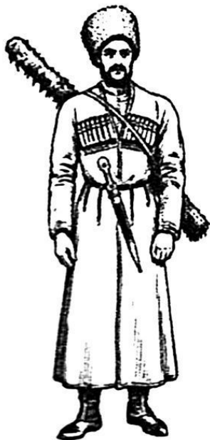
Казак-пластун Черноморского войска. Россия

...Что касается тактики пластуна – она сложная. Волчья пасть и лисий хвост – ее основные правила. В ней повседневную роль играют след – «сакма» и засада – «залога». Тот не годится «пластуновать», кто не умеет убрать за собой собственный след, задушить шум своих шагов в трескучем тростнике; кто не умеет поймать следы противника и в следах его прочитать направленный на линию удар. Где спорят обоюдная хитрость и отвага, где ни стой, ни с другой сто-