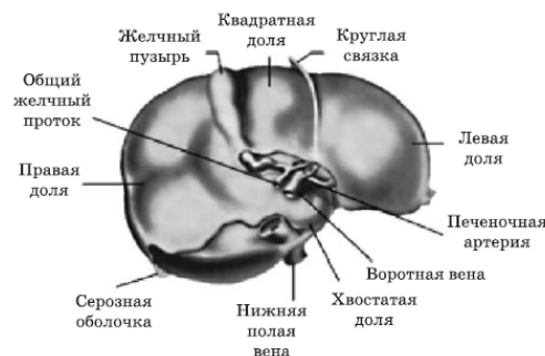
Рис. 2. Печень в разрезе

Учитывая, что множество неприятностей с работой печени кроется в нарушении проходимости желчных протоков, уделим немного времени особенностям их анатомического строения. Попытаемся ответить на простой вопрос: зачем печени желчный пузырь?