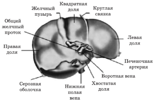
Рис. 2. Печень в разрезе

Учитывая, что множество неприятностей с работой печени кроется в нарушении проходимости желчных протоков, уделим немного времени особенностям их анатомического строения. Попробуем ответить на простой вопрос: зачем печени желчный пузырь?