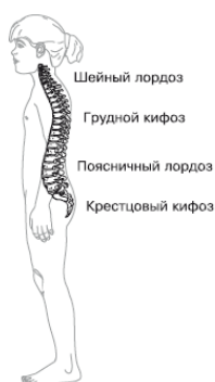
Рис. 1.2. Изгибы позвоночника

У ребенка, ведущего естественный, подвижный образ жизни, изгибы позвоночного столба почти всегда являются оптимальными для его роста и веса. Под нарушениями осанки понимают сглаживание или увеличение физиологических изгибов позвоночника. Это еще не болезнь, и такие изменения обратимы. Искривлением позвоночника (сколиозом) называют появление дополнительных изгибов во фронтальной плоскости и скручивание позвоночника. В подавляющем большинстве случаев деформирования позвоночника формируются в раннем детстве, а потом лишь прогрессируют. У взрослого человека последствия неудобной позы быстро дают о себе знать болями в спине – в первую очередь страдают корешки спинномозговых нервов. По этой причине он вскоре сам заботится об обеспечении удобного положения кресла и компьютерного стола.