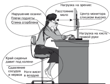
Рис. 1.1. Опасности для здоровья, которые подстерегают человека, работающего за компьютером

Таким образом, возможное негативное влияние компьютера на здоровье человека весьма обширно и затрагивает многие органы (рис. 1.1). Охарактеризуем каждую из проблем более подробно и рассмотрим возможные способы предупреждения.