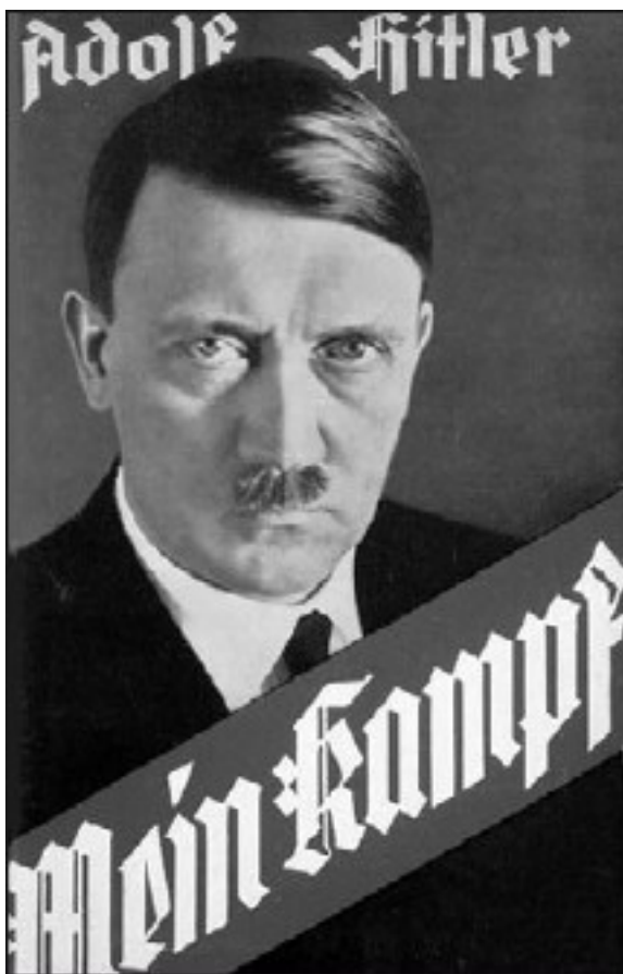
«Майн кампф» – «библия» пропаганды

Показателем успешности информационной войны, развернутой А. Гитлером против человечества, является и распространенность его главного произведения. До 1945 года книга «Майн кампф» была переведена на 16 языков, а ее общий тираж составил 10 миллионов экземпляров. На тот момент с этим «бестселлером» могли соревноваться по популярности разве что Библия и «Капитал»! Еще в начале 1930-х годов «Майн кампф» издавалась огромными тиражами в США, Дании, Швеции, Италии, Испании, Японии и т. д. В 1933 году книга вышла в Англии: всего за пять лет было раскуплено почти 50 тысяч экземпляров. Успешная пропаганда своих идей по всему миру дала А. Гитлеру широкие возможности для привлечения союзников – новых врагов СССР.