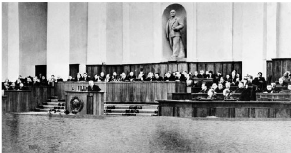
XX съезд КПСС, 1956 год

Манипулирование сознанием людей невозможно без знания и использования общественной психологии. Данная научная дисциплина изучает такие важные процессы, как общение, убеждение, внушение, подражание, а также психические состояния, которые присущи большим социальным группам (включая возбуждение, подъем, спад, энтузиазм и стрессы, решимость и растерянность) 5 .