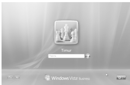
Рис. 1.1. Вход в Windows Vista

Операционная система Windows Vista запускается практически сразу после нажатия кнопки питания на системном блоке. В том случае, если в Windows Vista зарегистрированы несколько пользователей, при загрузке системы на экране отобразится окно приветствия (рис. 1.1). В нем необходимо щелчком мыши выбрать имя требуемого пользователя, после чего ввести пароль (если он задан) и нажать клавишу Enter .