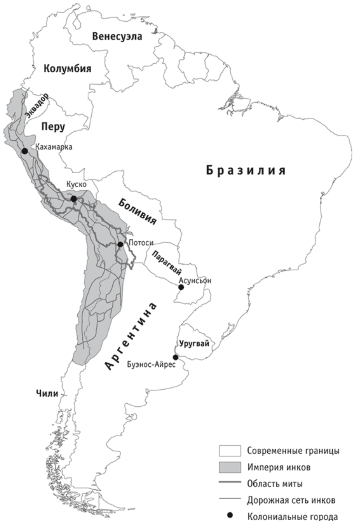
Карта 1. Империя инков, сеть инкских дорог и границы области миты

Помимо концентрации трудовых ресурсов и использования миты, Толедо трансформировал энкомьенду в подушный налог – фиксированную сумму, которую ежегодно должен был платить (серебром) каждый взрослый мужчина. Это была еще одна схема принуждения людей