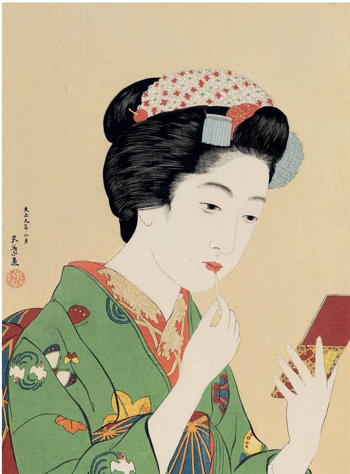
Женщина наносит краску на губы. ( Портрет Тиё, майко из Гиона ) Хасигути Гойо, 1920 г.