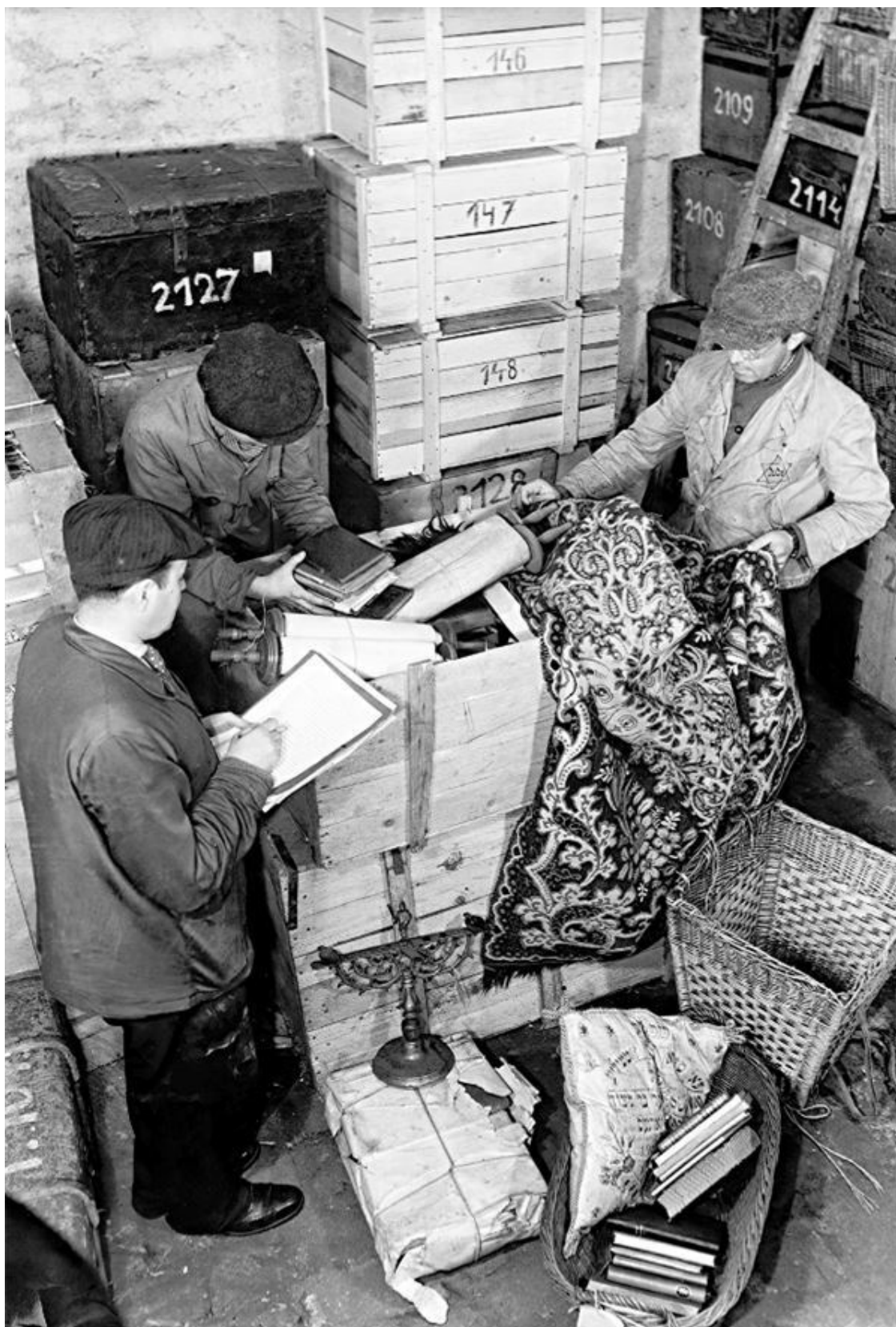
б. Распаковка ящиков, предназначенных для Еврейского музея в Праге, ок.1942 г.