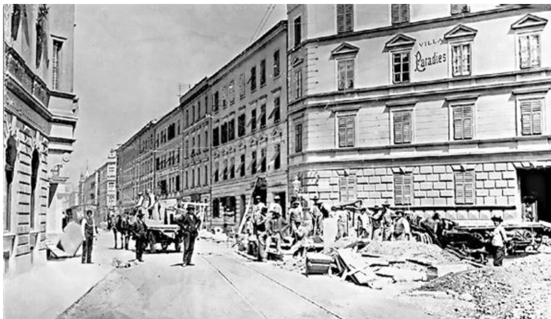
5. Андреас-Гофер-штрассе, 1905 год