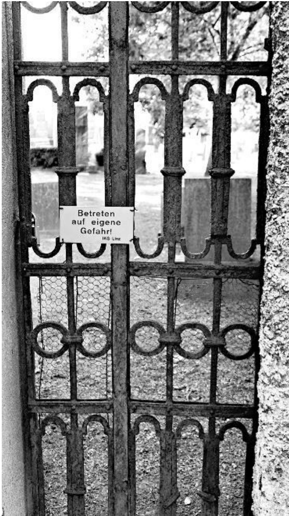
7. Калитка еврейского кладбища Линца, с предупредительной табличкой «Вход под личную ответственность»