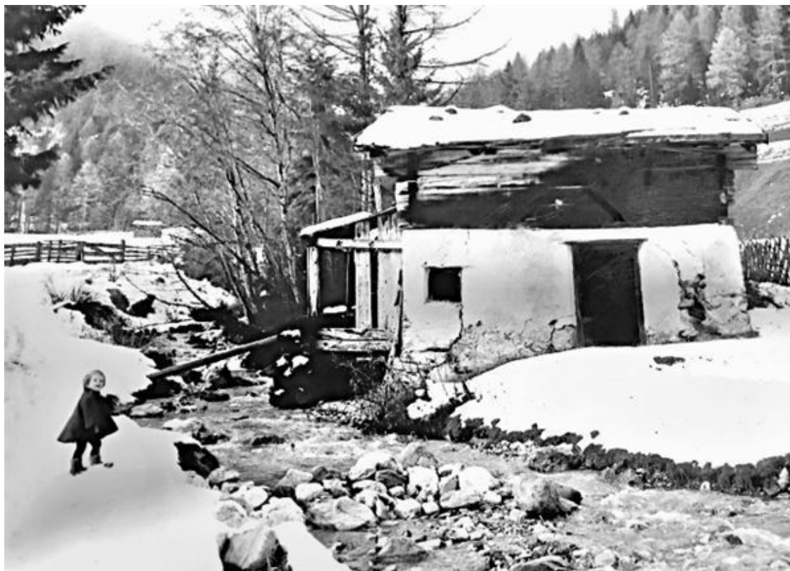
1. Я трехлетняя иду к дому в Тринсе

Курт развивал грандиозные планы. В своем «прекрасном Тироле» он хотел начать новую жизнь, которая теперь была к нему менее сурова, чем в Англии, где его отправили за решетку. «Ты здесь научишься кататься на лыжах», – возражал он на мой горячий протест против неожиданного зигзага моей подростковой жизни.