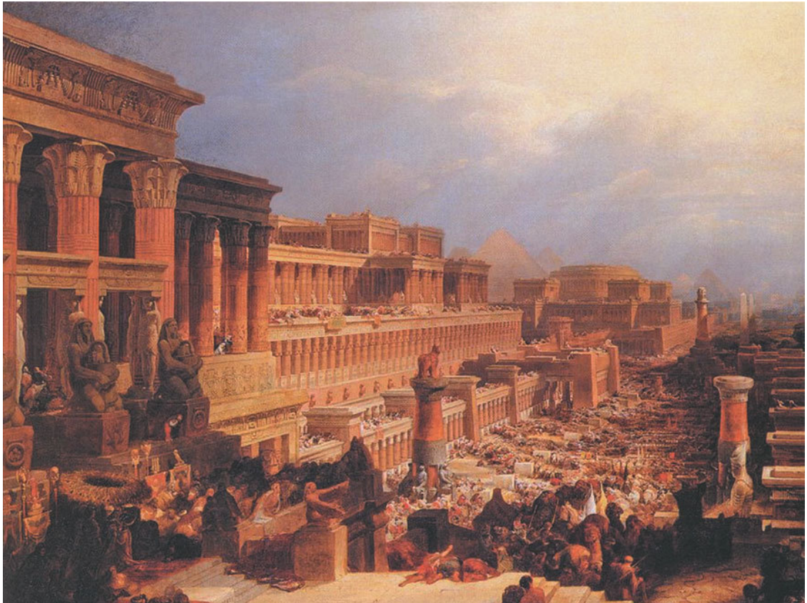
Исход евреев из Египта 1

Пасха восходит к событию, упомянутому в Ветхом Завете – закланию беспорочного агнца во время исхода евреев из Египта.