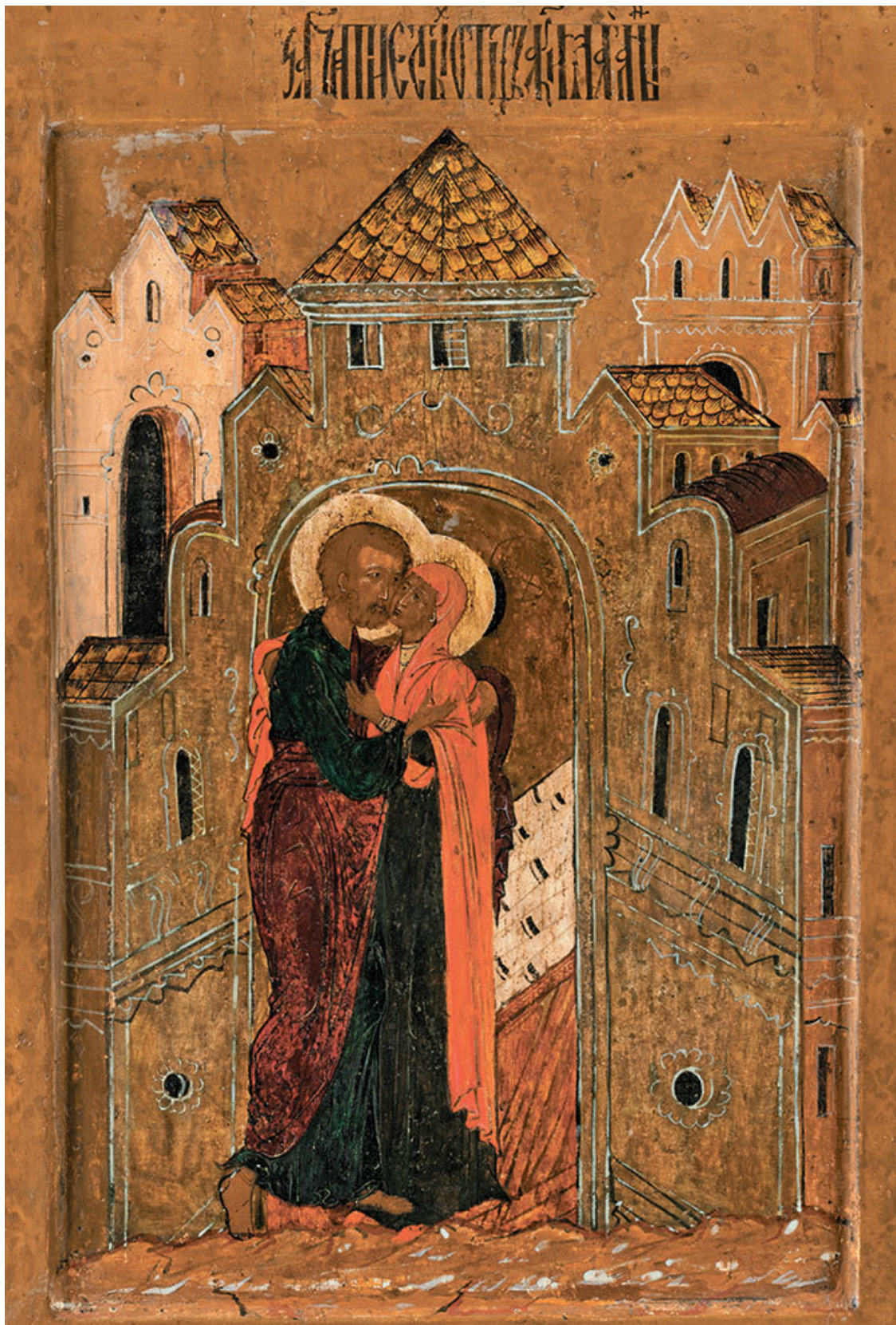
Праведные Иоаким и Анна славились благочестием, милостивым сердцем и преклонением пред волей Господней 3