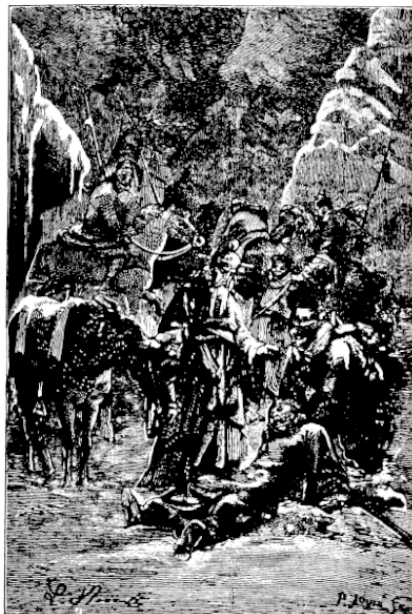
Фа-Сянь и его спутники в горах

В Индии Фа-Сянь посетил много городов и местностей, где собирал легенды и сказания о Будде. Из Индии он переправился на остров Цейлон, затем на остров Яву, после чего отплыл в Китай.