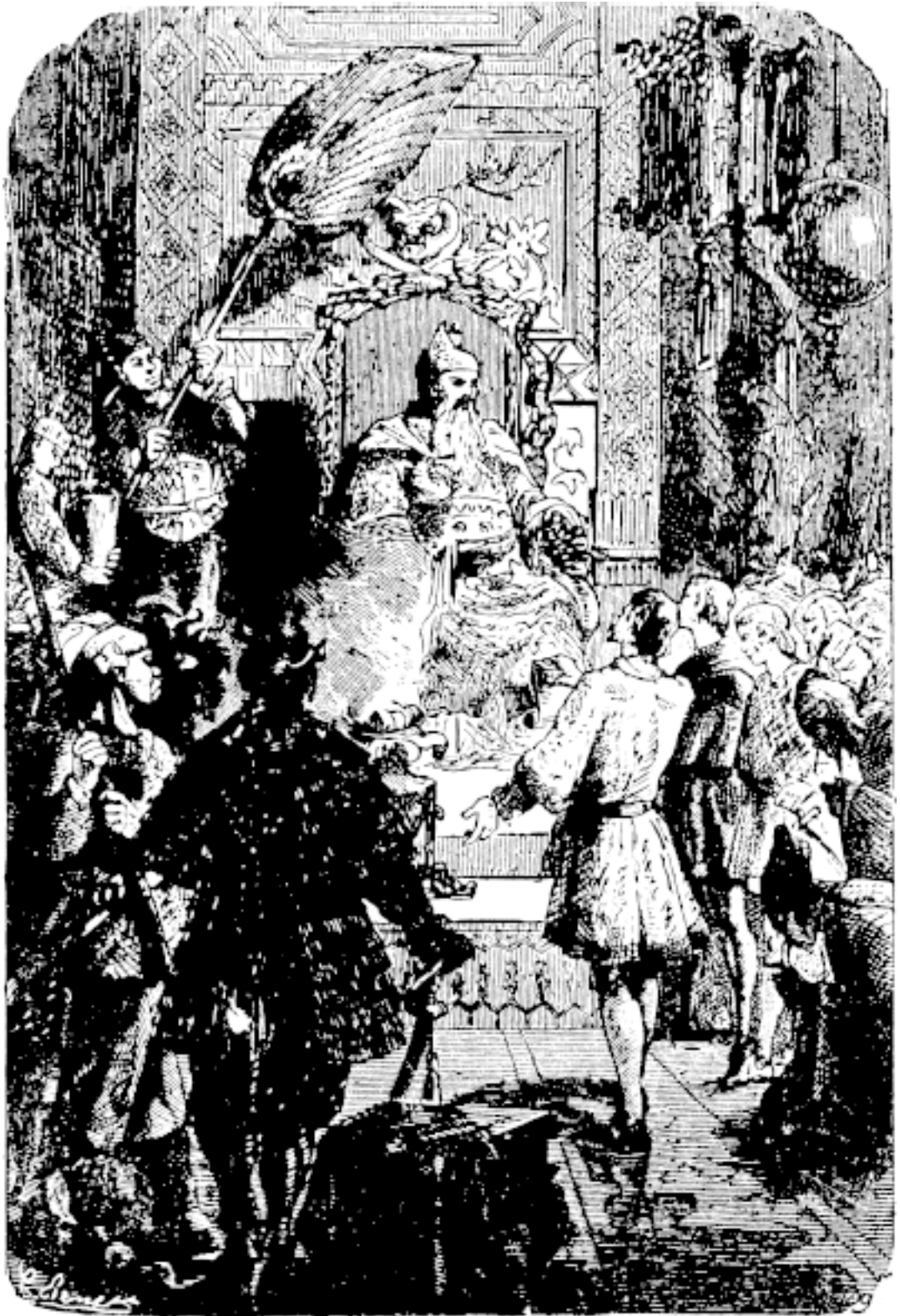
Великий хан Хубилай принимает венецианских купцов

Затем Марко Поло приводит биографические сведения о хане Хубилае и говорит, что он владеет таким количеством земель и сокровищ, каким не владел ни один повелитель на земле, «от времен Адама, нашего предка».