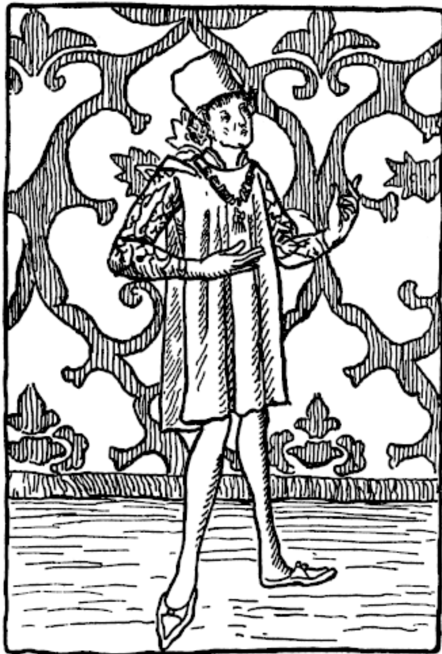
Марко Поло. Рисунок из первого печатного издания «Книги Марко Поло»

Из Малой Армении Марко Поло отправился в Туркменскую землю, жители которой, обладая прекрасными пастбищами, разводят добрых туркменских коней и хороших, дорогих мулов. Горожане занимаются там торговлей и ремеслами. Особенно они славятся производством ковров и шелковых тканей.