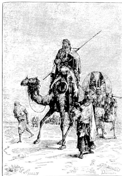
Вениамин Тудельский в Сахаре

Из Египта Вениамин направился в Италию, а оттуда – через Германию – он попал в Париж. Описанием Парижа Вениамин Тудельский и заканчивает повествование о своих путешествиях. Несмотря на некоторую сбивчивость изложения, это описание представляет ценный памятник географических знаний середины XII столетия. Современные названия городов, упомянутых путешественником, дадут читателям возможность ознакомиться с его маршрутом по новейшей карте.