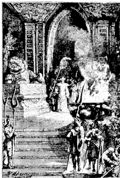
Дворец великого хана в Пекине

Далее путешественник сообщает любопытные подробности об образе жизни великого хана. По его словам, хан Хубилай «ради важности держит около себя охрану из двенадцати тысяч всадников». Обеды хана совершаются с разными церемониями и подчинены строгому этикету. За своим столом, возвышающимся над всеми остальными, он сидит на северной стороне, лицом на юг. По левую сторону от него сидит старшая жена, а по правую – сыновья, племянники и родичи, так что «головы их приходится у ног великого хана». Прислуживают ему знатные лица, у которых нос и рот прикрыты золотой тканью, «чтобы дух и запах не касались пищи и питья великого хана». Когда хан собирается пить, раздаётся музыка, а когда берет в руки чашу – знать и все присутствующие смиренно преклоняют колена.