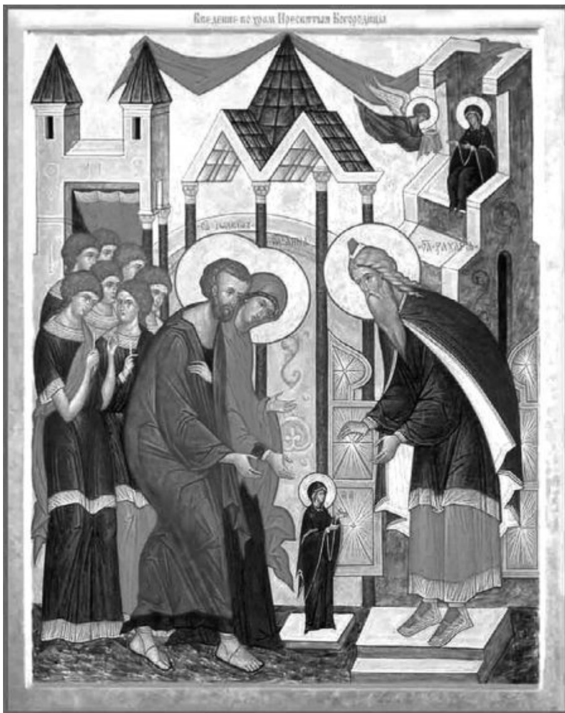
Икона «Введение Богородицы во храм»

Первосвященник, увидев в этом особое знамение Божие, провел Марию в глубину храма – туда, куда не только женщинам, но даже священникам был вход закрыт, и куда входить мог только сам первосвященник. Это место – Святая Святых – было назначено Пречистой Деве для постоянных молитв.