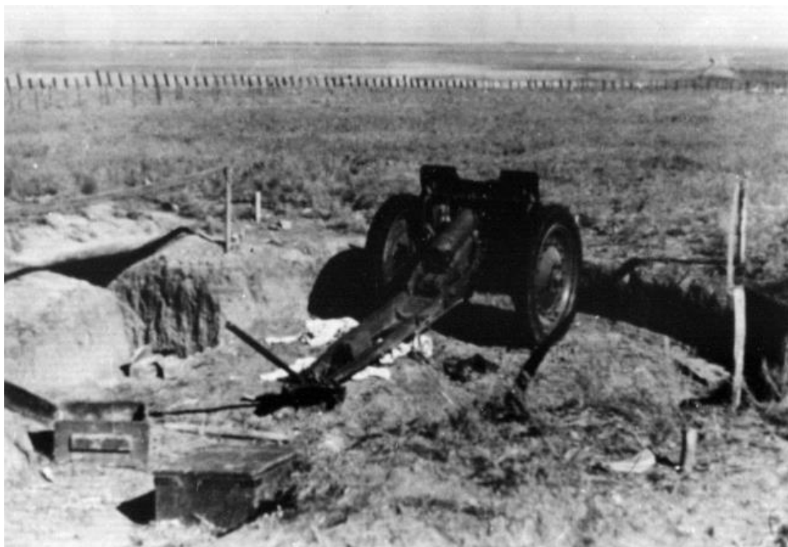
Позиция советской 76-мм полковой пушки обр. 1927 г. на Перекопе.

Войска Приморской армии, ведя напряженные бои с противником, стремившимся захватить дорогу Ялта – Севастополь, к 9 ноября вышли в район Севастополя и развернулись для обороны на его подступах. Подошедшая Приморская армия в это время состояла из 25, 95, 172 и 421-й стрелковых дивизий, 2,40 и 42-й кавалерийских дивизий, отдельного танкового батальона, 265-го корпусного артиллерийского полка и некоторых других подразделений.