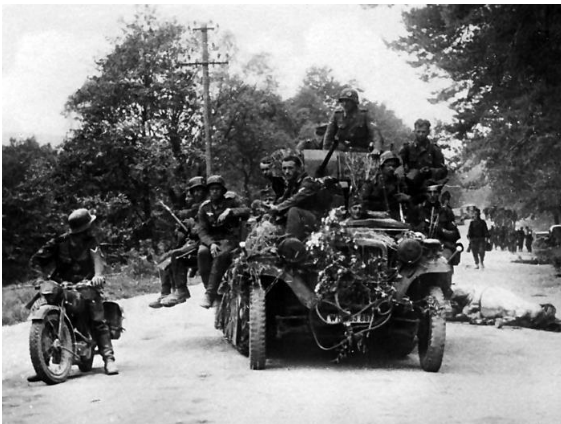
20-мм зенитный автомат, установленный на полугусеничном тягаче. Такие машины могли использоваться в передовых отрядах.

В то время как войска 51-й армии отходили на Керченский полуостров, Приморская армия вышла к Севастополю. Первому объединению не удалось закрепиться ни на одном рубеже, включая так называемые Ак-Монайские позиции, хорошо приспособленные к длительной обороне. Незначительные силы ВВС и ПВО в Керчи (две эскадрильи гидросамолетов и одна истребительная эскадрилья, шесть зенитных батарей 65-го зенитного артполка) мало что изменили в балансе сил. Ни П.И. Батову, ни прибывшему на его командный пункт вице-адмиралу Г.И. Левченко, ни присланному из Москвы представителю Ставки ВГК маршалу Г.И. Кулику не удалось организовать оборону Керчи, что имело для двух последних руководителей крайне негативные последствия – их отдали под суд, разжаловали, лишили наград.