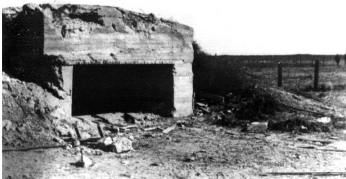
Бетонный ДОТ под 76-мм пушку на Перекопе.

штаб ссылаясь на отсутствие у него директив правительства по этому вопросу, а лично Сталин отшучивался или высказывал весьма общие предположения» 93 .