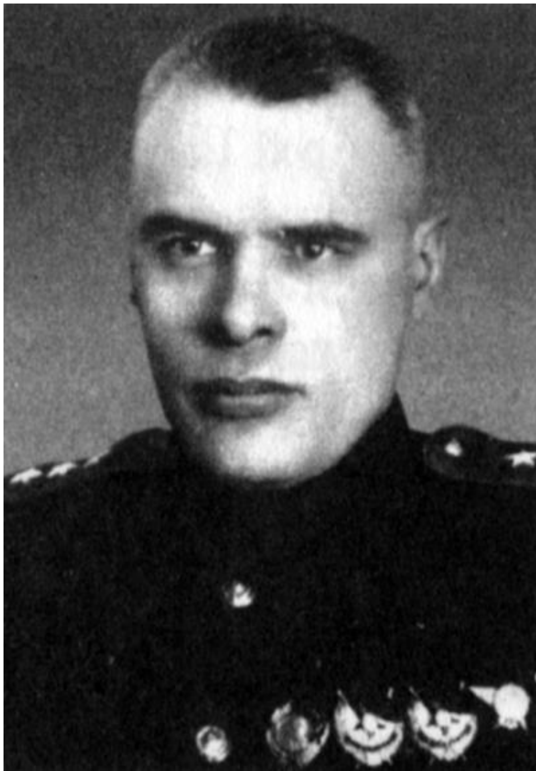
Командующий 51-й армией Ф.И. Кузнецов.