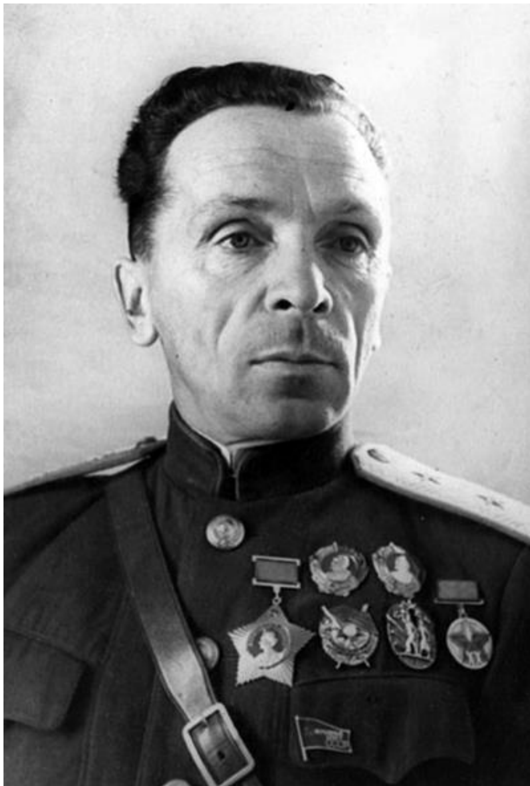
Командир 9-го стрелкового корпуса генерал-лейтенант П.И. Батов.

Единственное подвижное соединение в Крыму, 32-я кд, становится резервом корпуса. Следует отметить, что на 22 июня 1941 г. корпус еще не имел наименования «особый» или «отдельный». Переименование в «отдельный» произошло 23 июня, а «особым» он стал 25