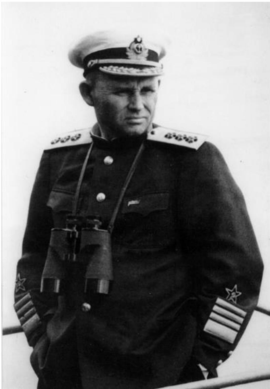
Командующий ЧФ вице-адмирал Командир 24-й пд генерал-майор