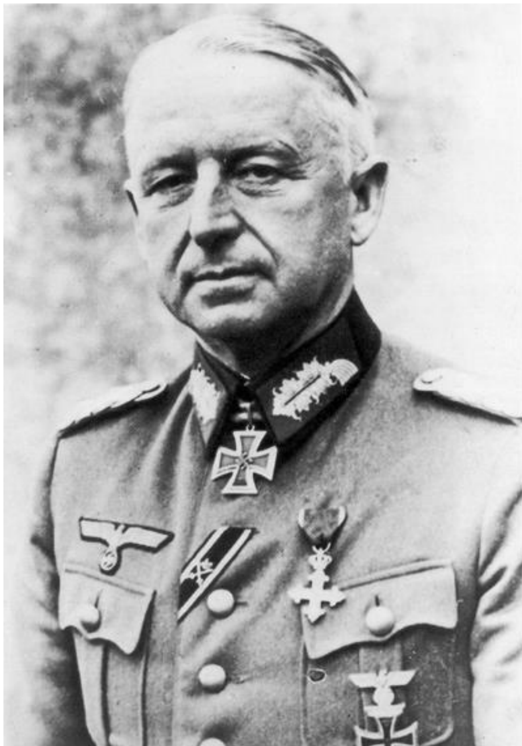
Командующий 11-й армией Э. фон Манштейн. На момент вступления в должность в сентябре 1941 г. – генерал пехоты.