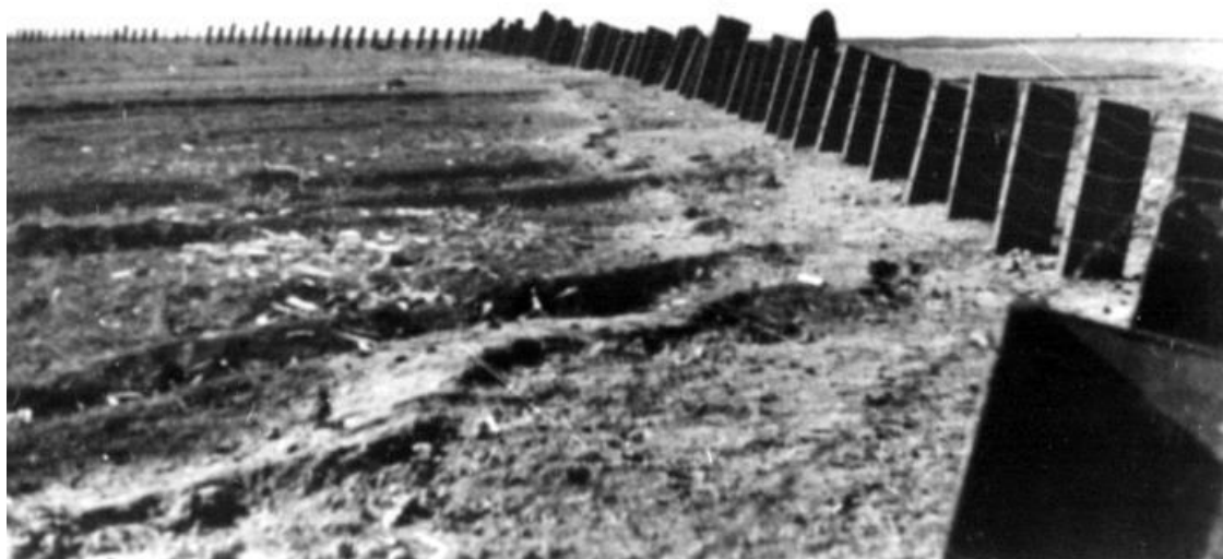
Советские «зубы дракона» на Перекопе: противотанковые надолбы из стальных балок.

Таким образом, сложности возведения оборонительных сооружений, на которые сразу обратил внимание П.И. Батов в ходе совместной с А.Н. Первушиным рекогносцировки Перекопа в июле 1941 г. были в немалой степени преодолены.