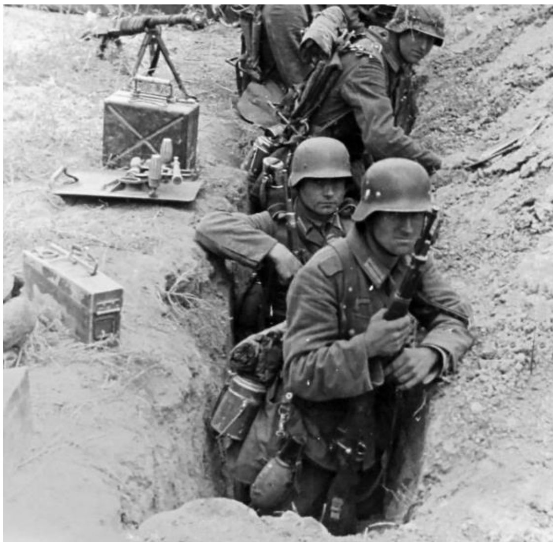
Немецкие пехотинцы перед атакой на Перекопе. Позади солдат противотанковое ружье и плита 50-мм миномета.

«12 сентября был первый массированный удар авиации по Перекопу, и с этого времени активность 4-го германского Воздушного флота ежедневно повышалась, – вспоминал заместитель командарма-51 генерал-лейтенант П.И. Батов, наблюдая из опорного пункта «Червоний чабан». – Над Перекопским валом немецкие самолеты появлялись с утра и не оставляли нас в покое до вечера. Небольшими группами они заходили от Сиваша и, следуя один за другим, клали и клали бомбы по гребню. В морской дали скрывается одна группа, а от Сиваша появлялась другая. Не оставалось, кажется, непораженным ни метра. Плотность при массовой бомбежке была такая, что однажды произошло прямое попадание в корабельную башню, поставленную на валу в качестве НП начальника дивизионной артиллерии...» Павел Иванович резюмировал: «Под сильным давлением с воздуха мы особенно остро ощущали в те дни слабость нашего авиационного прикрытия» 130 .