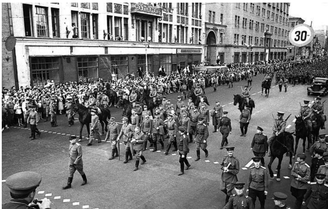
Колонна немецких военнопленных во время «марша побежденных» в Москве 17 июля 1944 г. Впереди компактной группой шагают 19 генералов

Шагающие по Садовому кольцу немецкие пленные стали одним из самых известных и знаковых событий войны в целом и лета 1944 г. в частности. Накопление знаний о том периоде заставляло по-новому взглянуть на, казалось бы, хорошо знакомые кадры. Бредущие по Москве колонны отличались от нестройной и облезлой толпы «фольксштурмистов» и «гитлерюгенда» 1945 г. Возглавлявшие колонны пленных немецкие генералы, поначалу воспринимаемые как достаточно абстрактные фигуры поверженных полководцев противника, с годами были опознаны, и за каждым из них встала своя история.