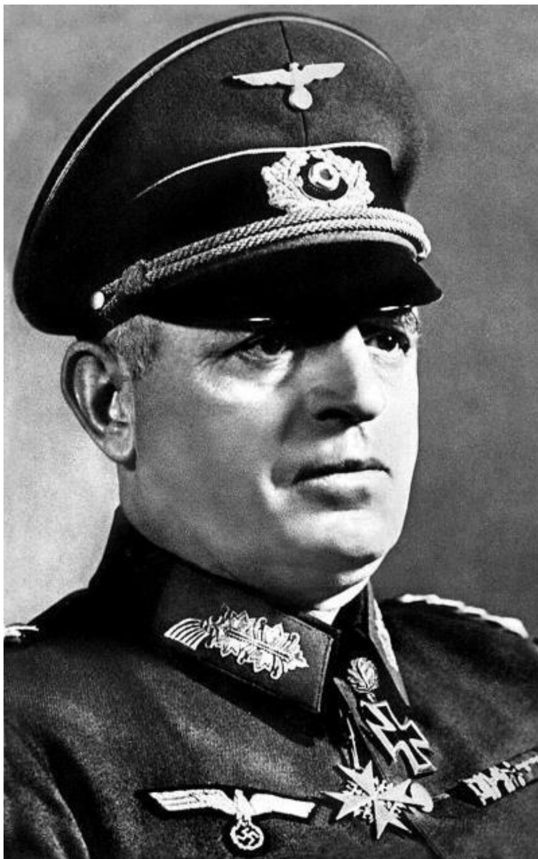
Командующий ГА «Центр» генерал-фельдмаршал Эрнст Буш

В тот же день, когда началось советское наступление под Ленино, произошла смена командования группы армий «Центр». Бессменно командовавший группой армий фельдмар-