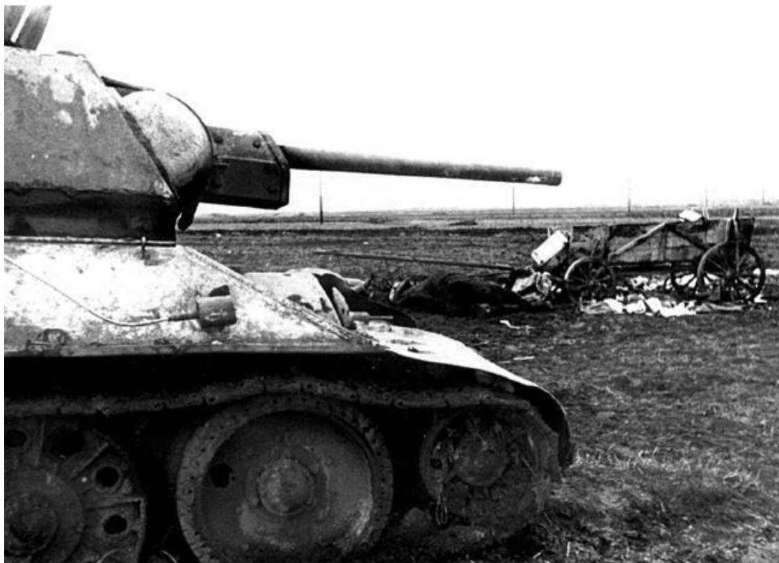
Подбитый в районе шоссе Москва – Минск под Оршей танк Т-34

С целью сломить сопротивление противника на новом рубеже командованием Западного фронта была предпринята перегруппировка войск. Находившаяся доселе южнее 21-й армии 33-я армия рокировалась вправо на оршанское направление в район м. Ленино. Для выполнения новой задачи 33-я армия была усилена и в итоге имела в своем составе шесть стрелковых дивизий в составе 70-го (338, 371, 220-я сд) и 65-го (144, 58, 173-я сд) стрелковых корпусов, 42, 164 и 222-ю стрелковые дивизии «россыпью», 5-й мехкорпус, 6-й гв. кавкорпус, две артбригады, 10 арtpолков РГК, 1495-й сап, 1577-й тсап, 256-ю, 43-ю гв. и 56-ю гв. тбр. Также в состав армии была включена 1-я польская пехотная дивизия им. Т. Костюшко. В тот период все еще были полны энтузиазма. Начальник оперативного отдела 33-й армии И. А. Толконюк вспоминал: