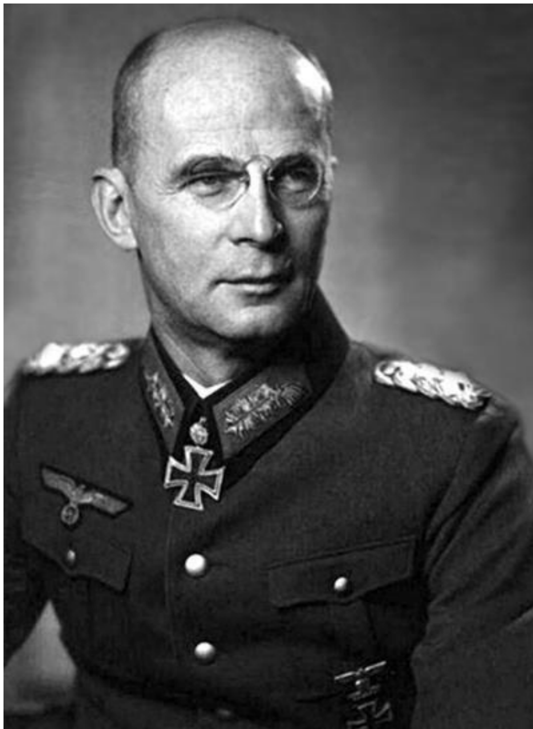
Командующий 3-й танковой армией генерал-полковник Георг-Ханс Рейнгардт

Слабое воздействие на артиллерию противника во многом обусловило неудачу советского наступления. В записи в ЖБД немецкой 3-й танковой армии особо отмечается именно этот промах: «Генерал Йордан обратил внимание командующего [Рейнгардта. – А.И.] на тот странный факт, что во время большого русского наступления русская артиллерия ни разу не вела огня с целью подавления нашей артиллерии» 35 .