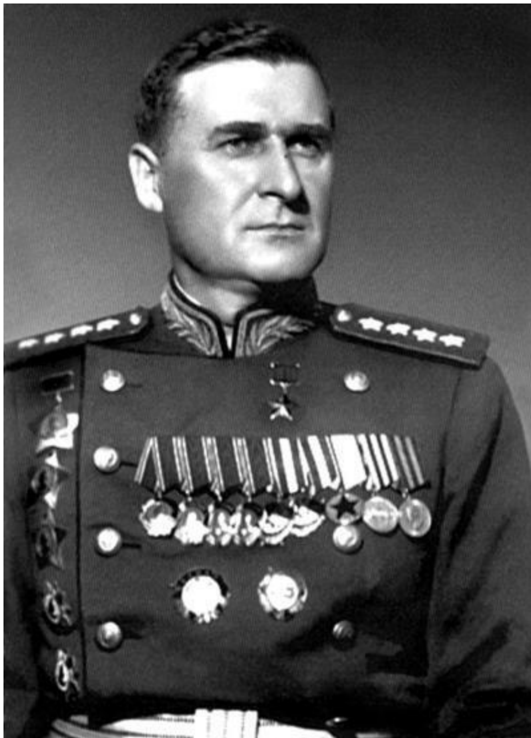
Командующий Западным фронтом в зимнюю кампанию 1943–1944 гг. Василий Данилович Соколовский

любого другого фронта (все фронты имели 2775 орудий этого типа). Соответственно 203-мм гаубиц имелось 95 штук, всего на одну единицу меньше, чем на 1-м Украинском фронте, – заметно больше, чем в составе любого другого фронта.