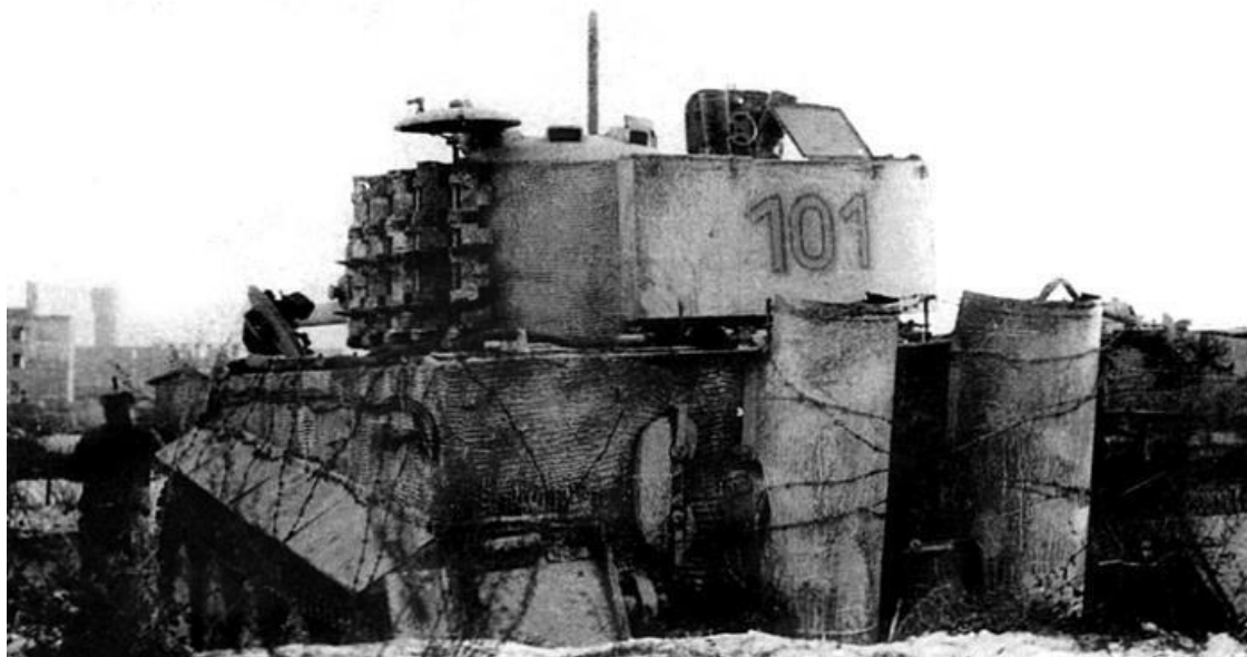
Немецкий тяжелый танк «Тигр» 501-го батальона тяжелых танков в засаде. Обратите внимание на опутанные колючей проволокой борта и корму танка – экипажи явно опасались взбирающихся на него в ближнем бою советских пехотинцев

Начинающаяся зима серьезно ухудшила условия ведения боевых действий. Сплошные дожди, туманы, начинающиеся холода изматывали людей. Оршанское направление стало Пашендейлом советско-германского фронта, позиционным сражением в грязи. В истории 25-й танкогренадерской дивизии ярко описываются тяжелые условия, в которых велись эти бои за автостраду: «Гренадеры, промокшие и переутомленные, стояли в своих затопленных грязью окопах. Мокрая одежда ночью замерзала на теле. Пулеметы и винтовки были полностью загрязнены, большинство из них непригодно к использованию. Бои велись ручными гранатами и холодным оружием. Поддержка со стороны артиллерии и систем залпового огня была великолепной и часто имела решающее значение» 25 . Фраза про гранаты и холодное оружие может показаться преувеличением, но она почти дословно повторяется в донесении ГА «Центр»: «Там, где из-за грязи отказывало стрелковое оружие, противника отбрасывали и уничтожали прикладами, лопатами и ручными гранатами» 26 . Понятно, что реальную работу в таких условиях, при отказе стрелкового оружия, делала артиллерия. В этот период отмечается централизация использования артиллерии немцами, когда по одной цели вели огонь значительно удаленные друг от друга батареи.