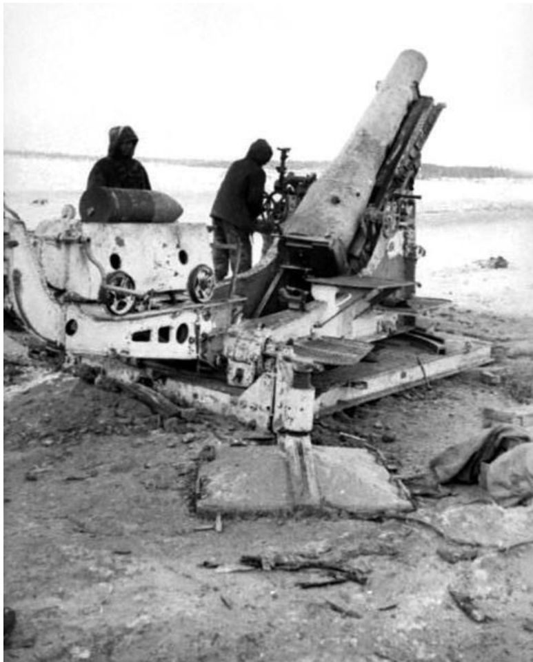
На позиции трофейная 280-мм мортира Шнейдера, принятая на вооружение в вермахте под наименованием