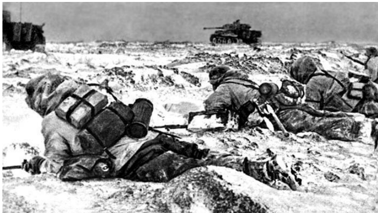
Иллюстрация к статье из немецкого журнала военного времени, посвященной ноябрьским боям на оршанском направлении. На фото видны «Тигры» и залегшая пехота

На флангах 31-й армии 10-я гв. армия и 68-я армия (южнее Днепра) получили вспомогательные задачи. Каждая из этих армий к тому моменту насчитывала по девять стрелковых дивизий. Казалось, что удалось найти ключик к немецкой обороне под Оршей.