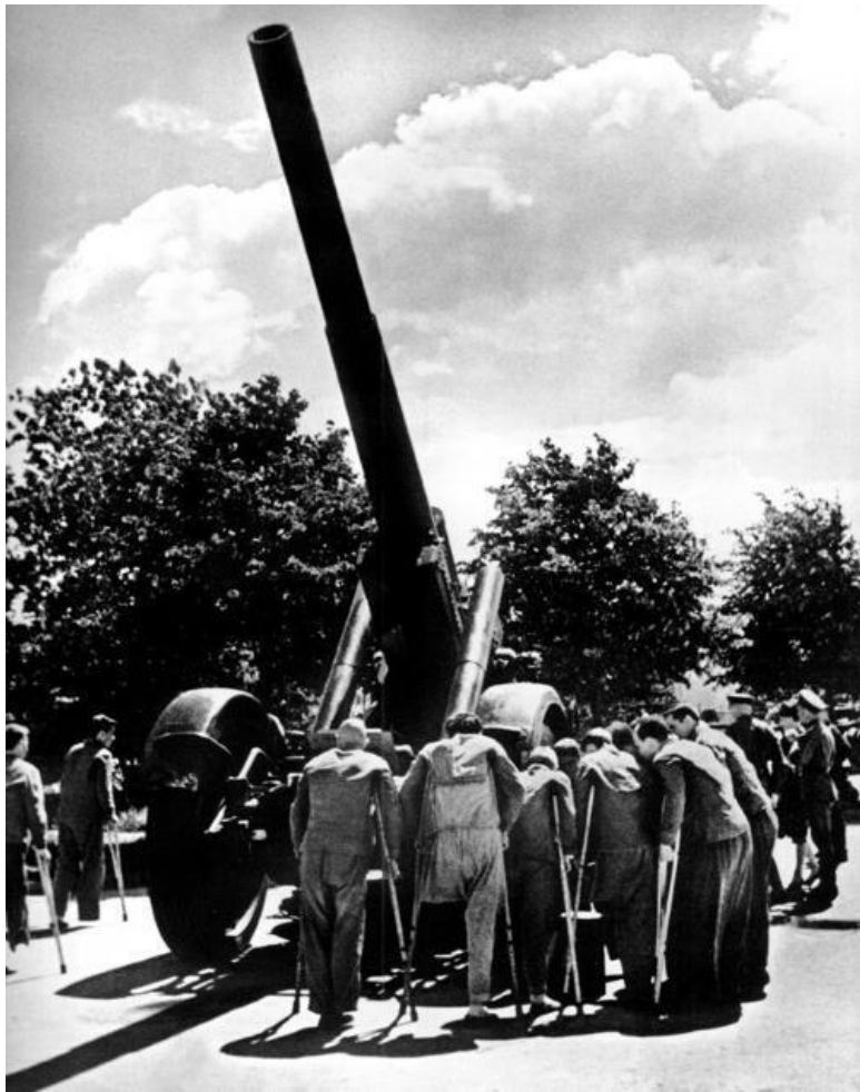
Одно из самых страшных фото войны. Раненые солдаты на экскурсии по выставке трофеев в Москве рядом с