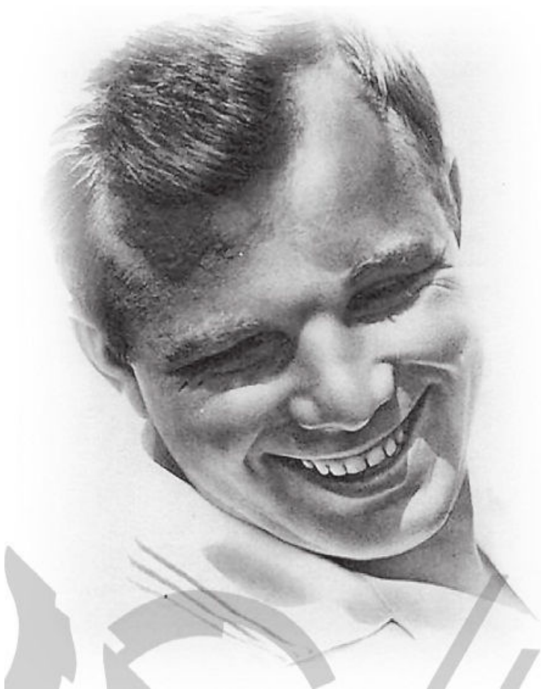
Юрий Алексеевич Гагарин.

А итоговое обращение Центрального Комитета КПСС, Президиума Верховного Совета СССР и правительства Советского Союза вызвали у советских людей настолько сильные чувства, что в тысячах городов и посёлков страны на улицы вышли миллионы граждан. И это было необыкновенное событие – люди смеялись и плакали от избытка чувств, обнимались и поздравляли друг друга. И те, кто не сразу понимал, что, собственно, происходит, осознав суть события, тоже принимались обниматься и поздравлять всех вокруг.