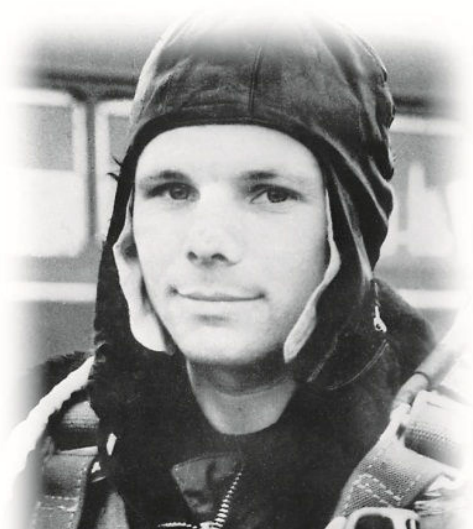
Майор Юрий Гагарин перед прыжком с парашютом. 12 апреля 1960 года.

Во время подготовки, которая, к слову, длилась недолго (Королёв торопился опередить американцев, по данным разведки, собиравшихся отправить человека в космос 20 апреля), будущие космонавты подружились. Оба понимали – полететь может только один.