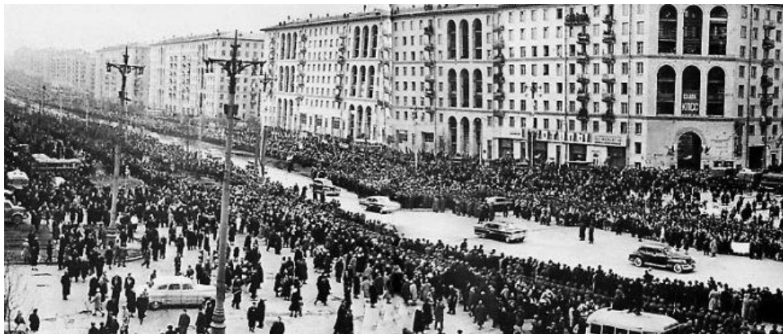
Москва встречает Юрия Гагарина. Апрель 1961 года.

Это была сложная эпоха. Только-только опустели сталинские лагеря, через которые прошли десятки миллионов человек. Наступила «оттепель». Появилась возможность говорить о том, о чём раньше опасно было даже молчать. Люди распрямили плечи, подняли головы. Намечалась перспектива нормальной жизни – без лишений, голода, страха. И полёт Гагарина стал апофеозом «оттепели», высшей точкой всеобщего взлёта, с которого для СССР начались 1960-е годы.