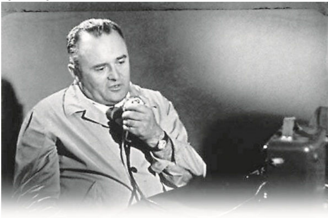
Сергей Павлович Королёв на командном пункте, поздняя реконструкция.

Через минуту – снова голос Королёва, дрожащий от волнения. Он впервые называет позывной Гагарина. «Даётся зажигание, „Кедр“». Ответ Гагарина: «Вас понял – даётся зажигание». Сергей Павлович: «Предварительная ступень... Промежуточная... Главная... Подъём!» И Гагарин восторженно восклицает: «Поехали!»