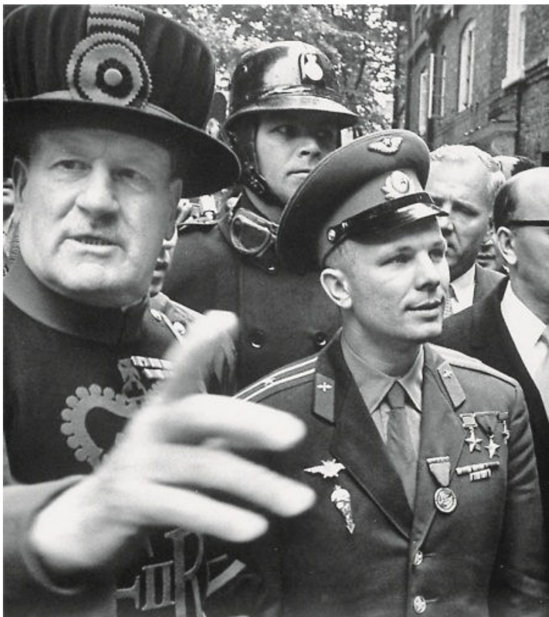
Гагарин в Англии. Июль 1961 года.