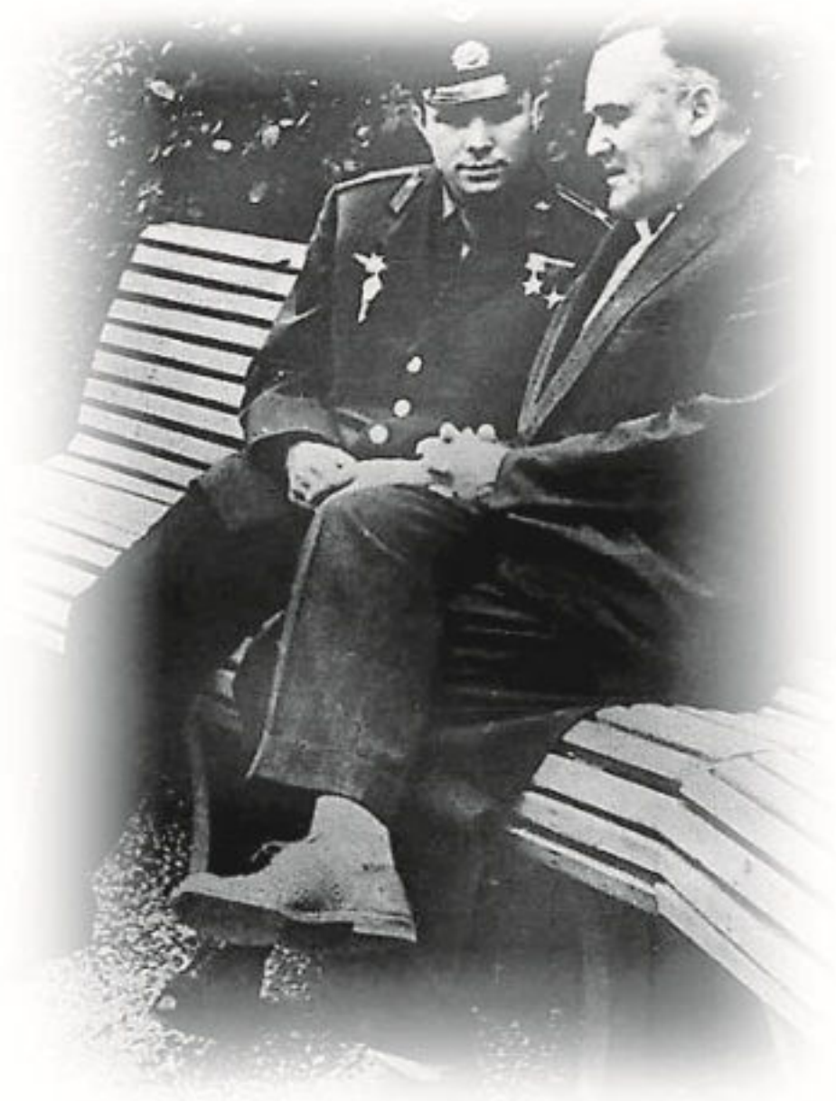
Гагарин и Королёв, уже после полёта.