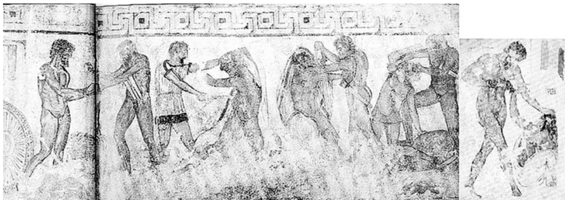
Римская фреска, IV в. до н. э.

Долгое время эти строки из речи Клавдия были единственным свидетельством о загадочном персонаже по имени Мастарна. Но в середине XIX в. археологами была открыта гробница в этрусском городе Вульчи (этот город находился примерно в 80 км к северу от Рима). Речь о гробнице Франсуа (она названа по имени первооткрывателя) и ее знаменитых фресках.