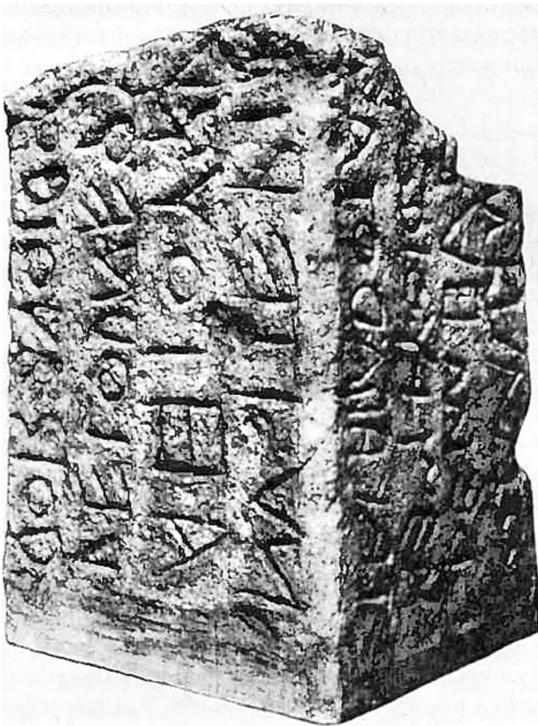
Фрагмент столба с надписью

Точно установить содержание надписи нельзя: часть текста утеряна. Но в ней совершенно точно присутствует слово «царь» на архаичной латыни – «RESEI» (в надписи слово употребляется в дательном падеже, то есть «царю» или «царя»). Это доказывает, что цари действительно существовали 45 . Но сколько их было? Как долго длилось их правление? Как звучали их имена? Ответов на эти вопросы археология нам дать не может, и здесь «мы остаемся практи-