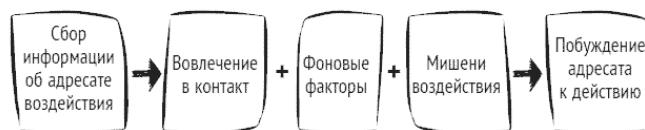
Рис. 2. Универсальная схема (модель) скрытого управления

Ранее [Шейнов, 2007] нами показано, что любое воздействие посредством скрытого управления происходит по следующей схеме (рис. 2):