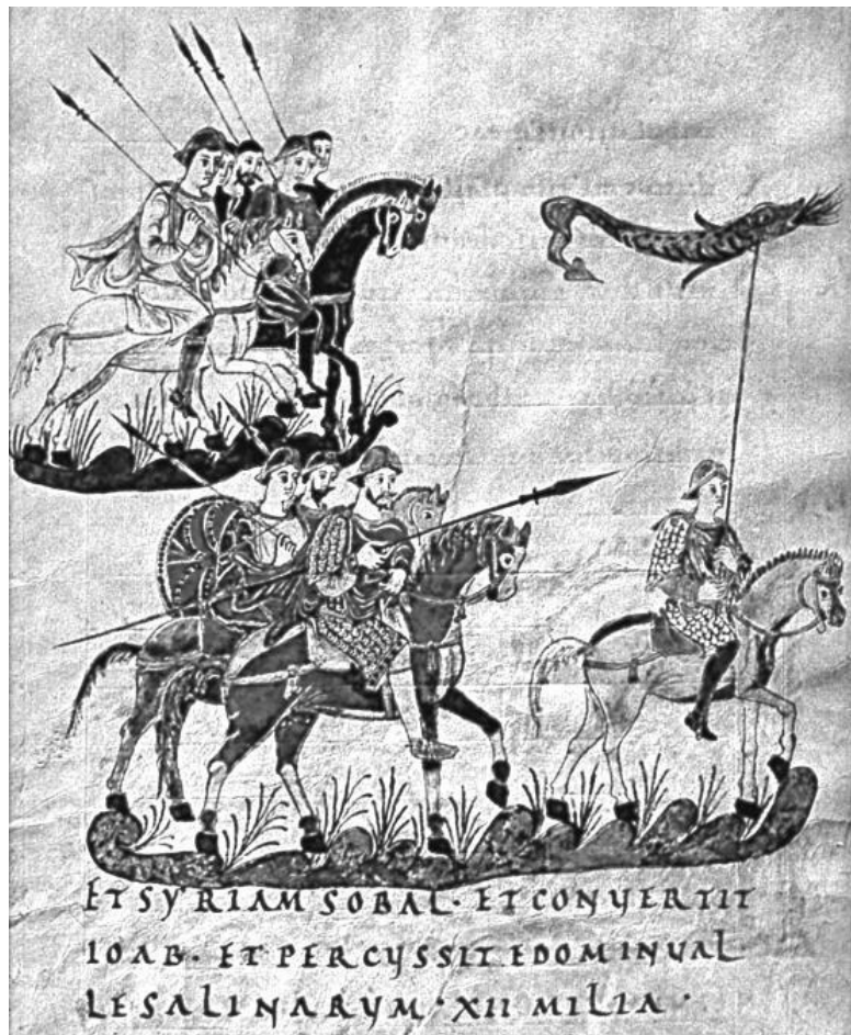
Конница франков. Миниатюра из «Золотого Псалтыря» монастыря Святого Галла, около 883 г. Впереди конного войска франков движется знаменосец, знамя которого представ-