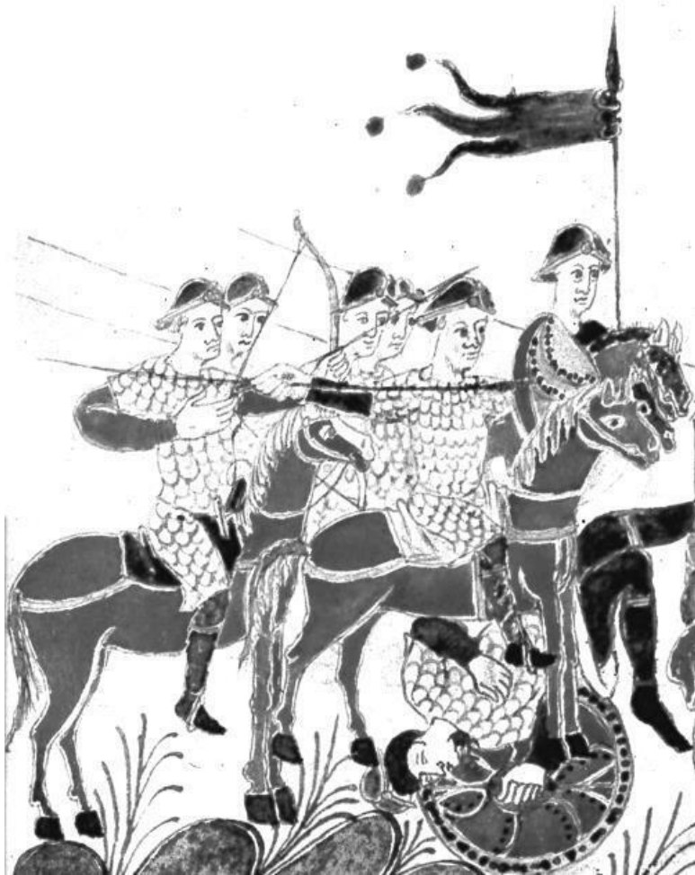
Конница франков. Миниатюра из «Золотого Псалтыря» монастыря Святого Галла, около 883 г. На миниатюре по-