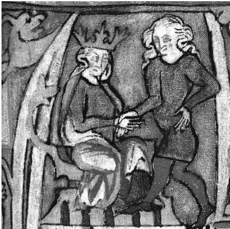
Иллюстрация из «Книги с Плоского острова» (Flateyjarbók) XIV в. – «юный король Харольд I получает Норвегию из рук своего отца». Первый король Норвегии из рода Инглингов, Харальд Хорфагер, или Прекрасноволосый (др. – исл. Haraldr hárfagri, норв. Harald I Hårfagre; ок. 850-ок. 933), был единственным сыном и преемником Хальвдана Черного, конунга из рода Инглингов, правителя