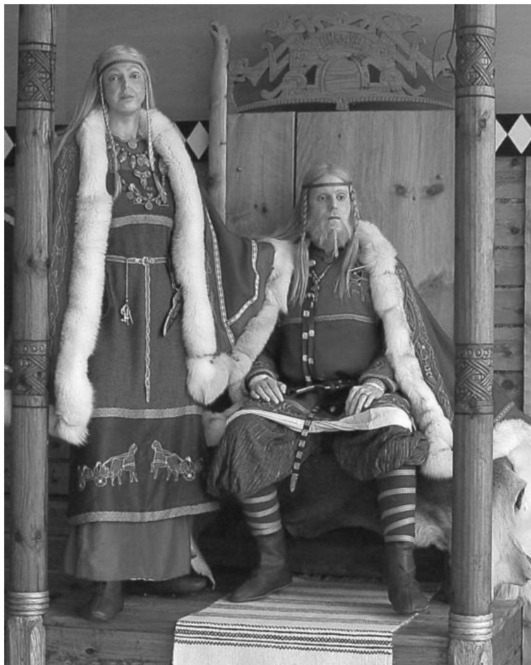
Первый король Норвегии из рода Инглингов, Харальд