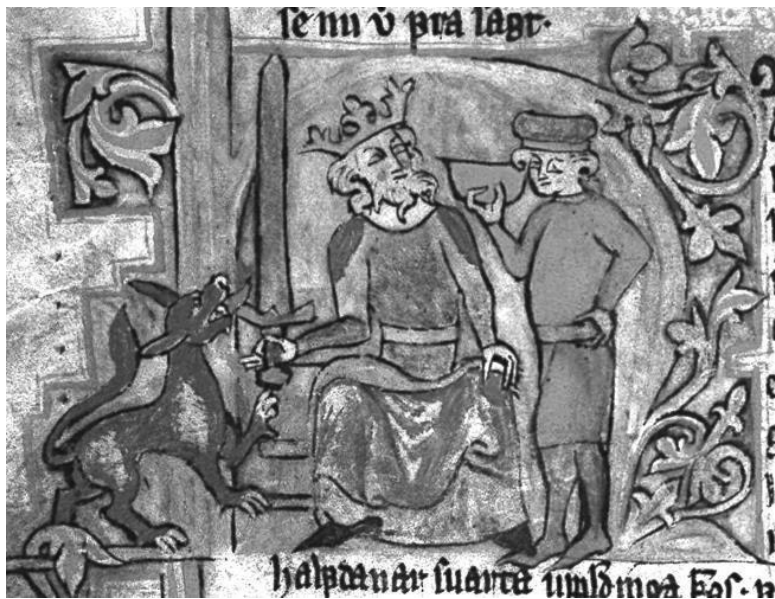
Иллюстрация из «Книги с Плоского острова» (Flateyjarbók) XIV в. — «Харольд I король Норвегии». Первый король Норвегии из рода Инглингов, Харальд Хальфдансон Хорфагер или Прекрасноволосый, изображен сидящим на троне в золотой короне с мечом в руке.

После убийства короля Годфреда в 810 году конунгом стал его племянник Хемминг, а его собственные сыновья вынуждены были отправиться в изгнание. Два года спустя Хемминг умер, и борьбу за трон повели два рода. Во главе одного из них стоял Сигфред (другой племянник Годфреда), а