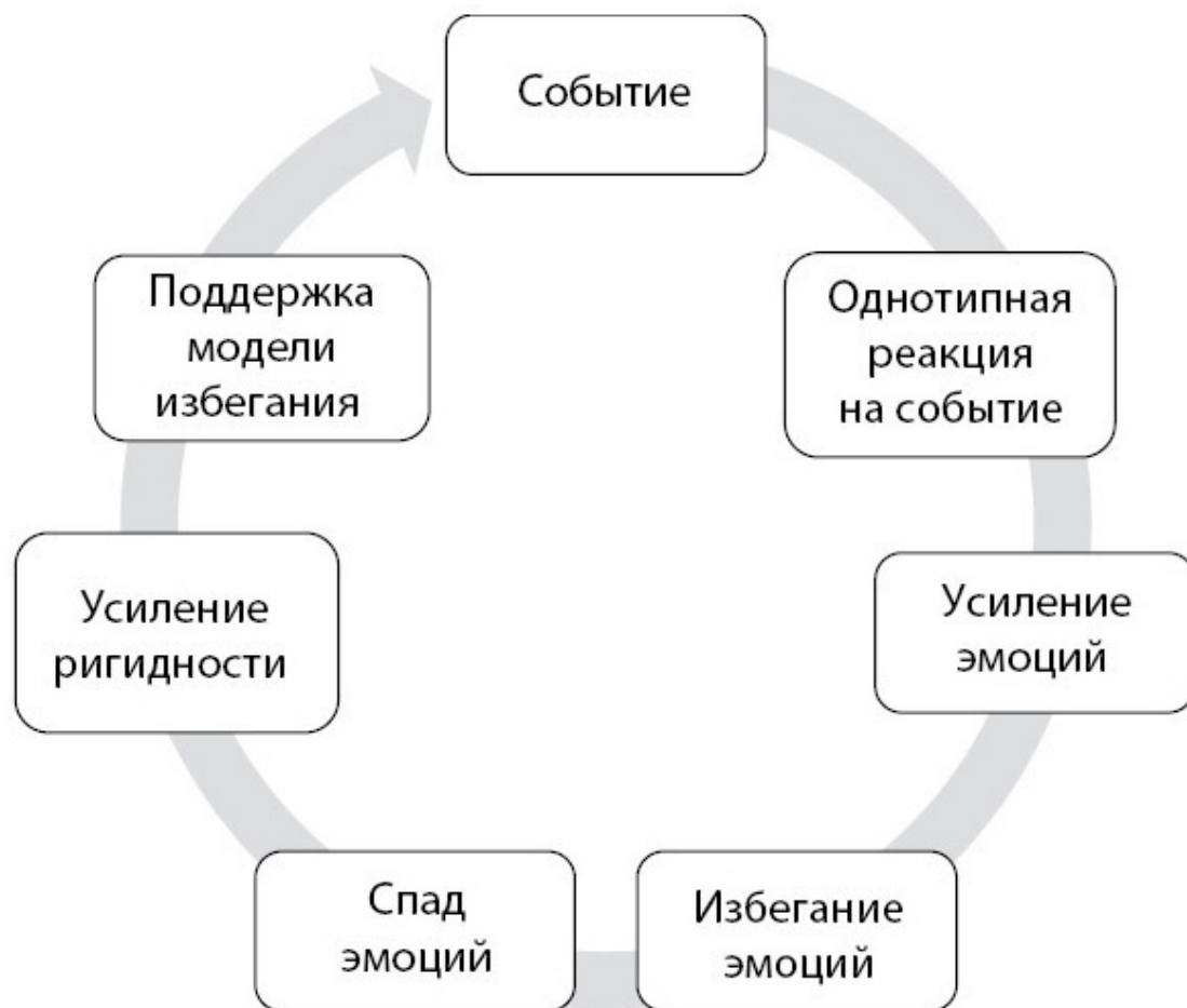
Рис. 1.1. Цикл избегания эмоций

Например, у вас депрессия, и вы уклоняетесь от общения – считаете, что не получите от него удовольствия. Если возникли проблемы со здоровьем, не хотите идти к врачу – вдруг диагноз будет неутешительным. Или не занимаетесь спортом – как бы не спровоцировать сердечный приступ.