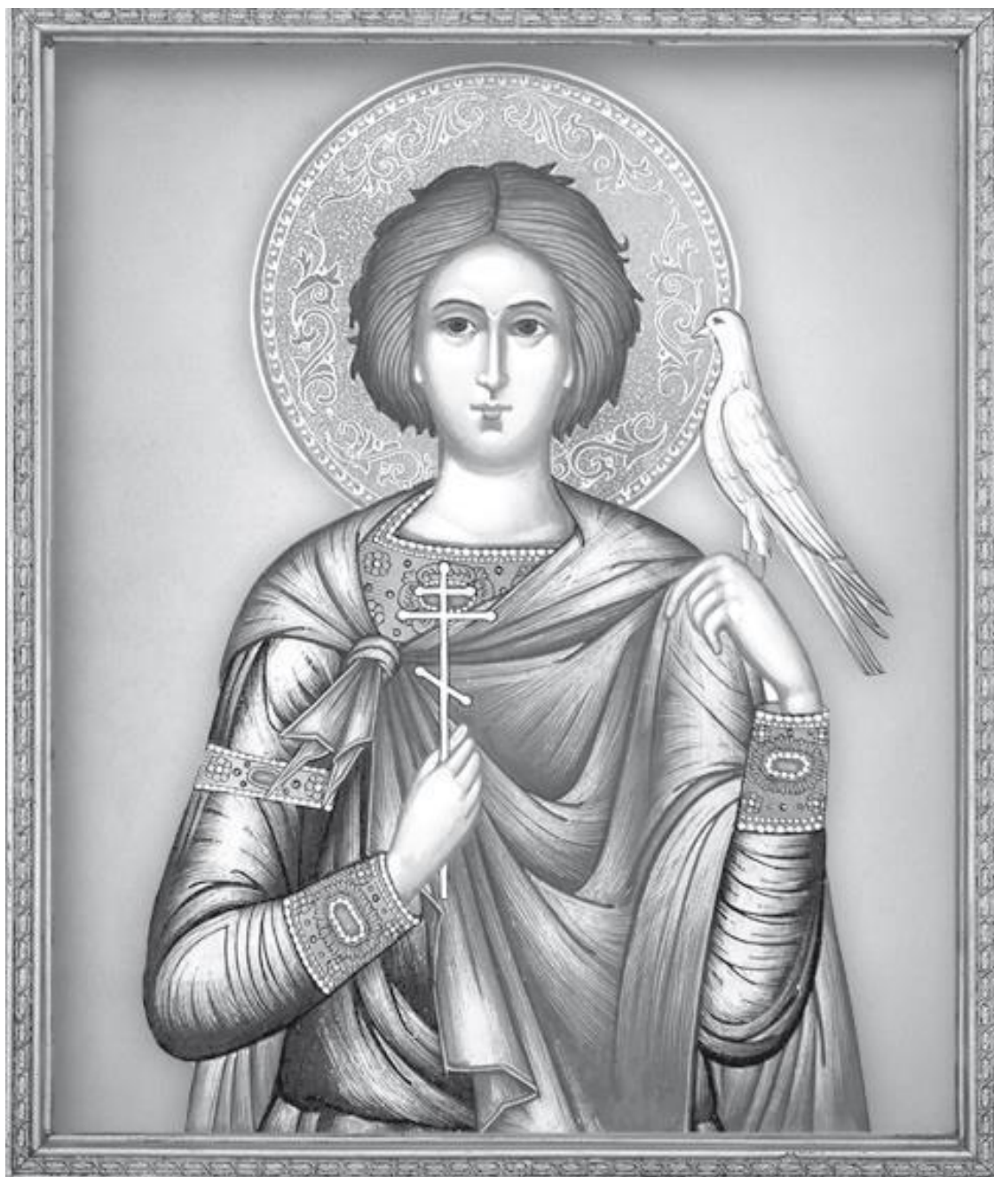
Святой мученик Трифон

Рекомендовано к публикации Издательским Советом Русской Православной Церкви (ИС 13-309-1736)