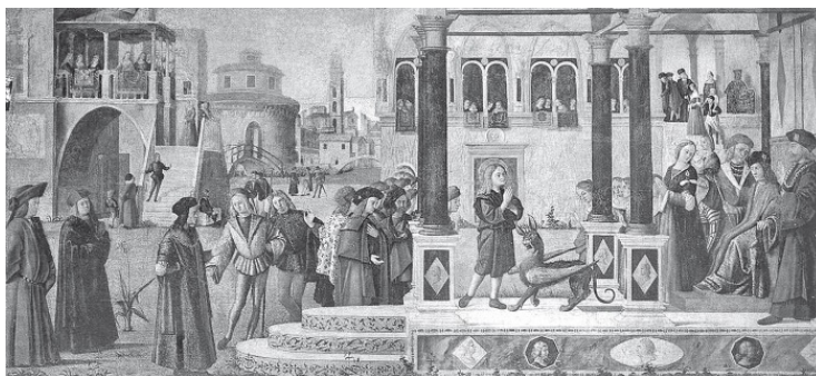
Витторе Карпаччо. Изгнание беса из дочери императора Гордиана св. Трифоном. 1507 г., Италия.

Родители собрали со всей империи жрецов и заклинателей, они пытались помочь девочке, но все тщетно. В конце концов было решено отыскать именно того Трифона, который изгонит нечистого духа. К императору приводили многих людей, носивших имя Трифон, но не один из них не смог исцелить царевну. Добралась посланники императора и до Фригийского города Апамеи.