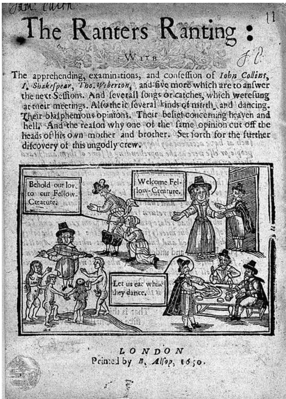
Титульный лист книги Джона Ридинга «Речи рантеров» (Лондон, 1650)

Нет никаких свидетельств о том, что хоть один рантер когда-либо проявлял интерес к исламу. Однако есть некоторые причины верить в наличие связей между рантеризмом и пиратством. «Бухта рантеров» на Мадагаскаре была убежищем для пиратской утопии позднее, в XVII веке, а некоторое количество рантеров было сослано на Карибские острова в период, когда там царил «Золотой век пиратства». Определённые аспекты исламской мысли вполне могли нравиться крайним протестантам – например, антитринитаризм, человеческая, но при