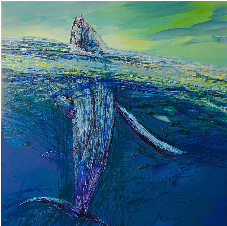
Серия «Портрет Океана», «Кит», Косьянковская К. Е., х., м., 150×150 см, 2017 г.

Только невозможные миссии бывают успешными. Жак-Ив Кусто, французский исследователь Мирового океана, фотограф, режиссёр, изобретатель, автор множества книг