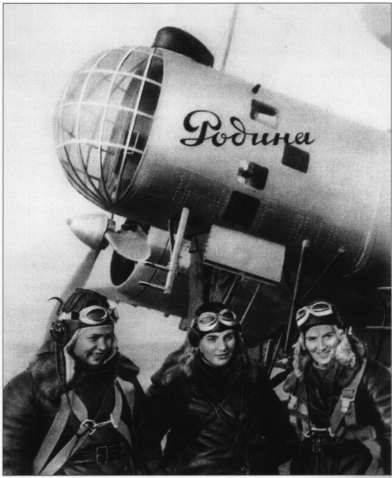
Экипаж самолёта «Родина» (слева направо): П.Д. Осипенко, В.С. Гризодубова, М.М. Раскова перед стартом на Щёлковском аэродроме.