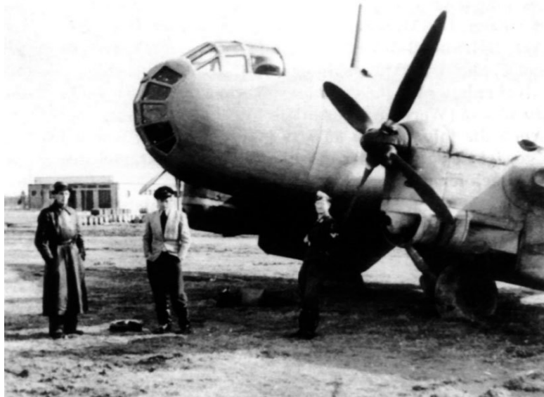
Высотный разведчик Ю-86Р (Ju86R) на аэродроме. Такие

чальных скоростей. При попадании в танк баллистический наконечник сминался, и в броню впивался твердосплавный сердечник. За счет высокой скорости и меньшего калибра такой сердечник пробивал более толстую броню, чем обычный снаряд такого же калибра. Взрывчатого вещества такие снаряды не имели, только стакан с трассирующим составом. Однако при пробивании брони от нагрузок сердечник обычно разрушался, и множество раскаленных осколков поражали экипаж, боеприпасы и горючее боевой машины.