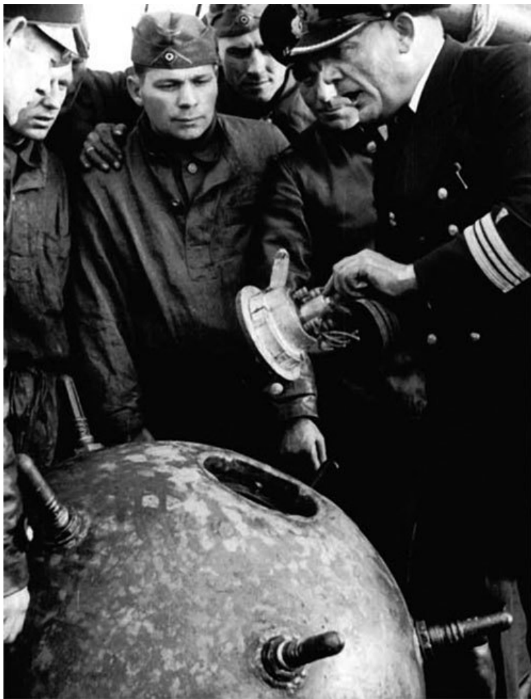
Изучение матчасти. На занятиях по устройству морской