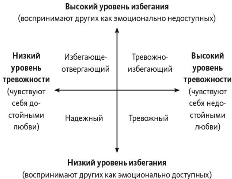
Схема 1. Модель четырех типов привязанности во взрослом возрасте 1

Тревожный (preoccupied): высокий уровень тревожности, низкий уровень избегания.