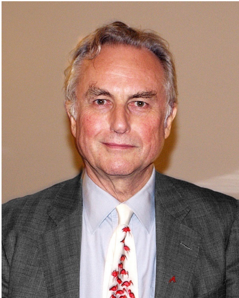
Ричард Докинз.